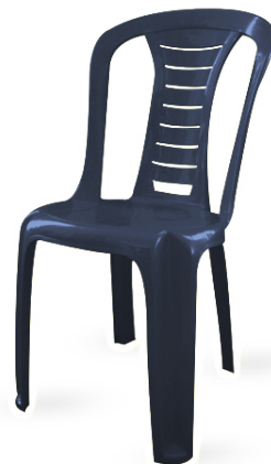
כסא פלסטיק חזק