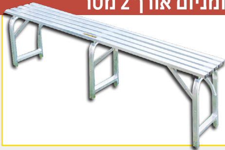
ספסל אלומיניום אורך 2 מטר