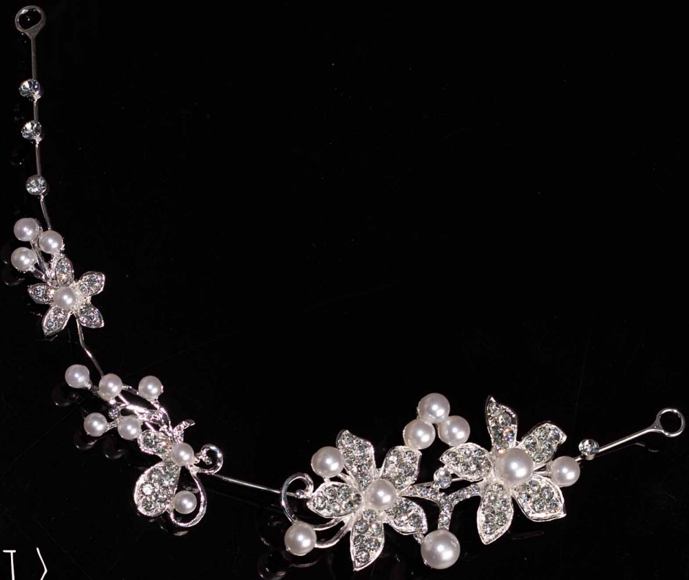
413 סגד >