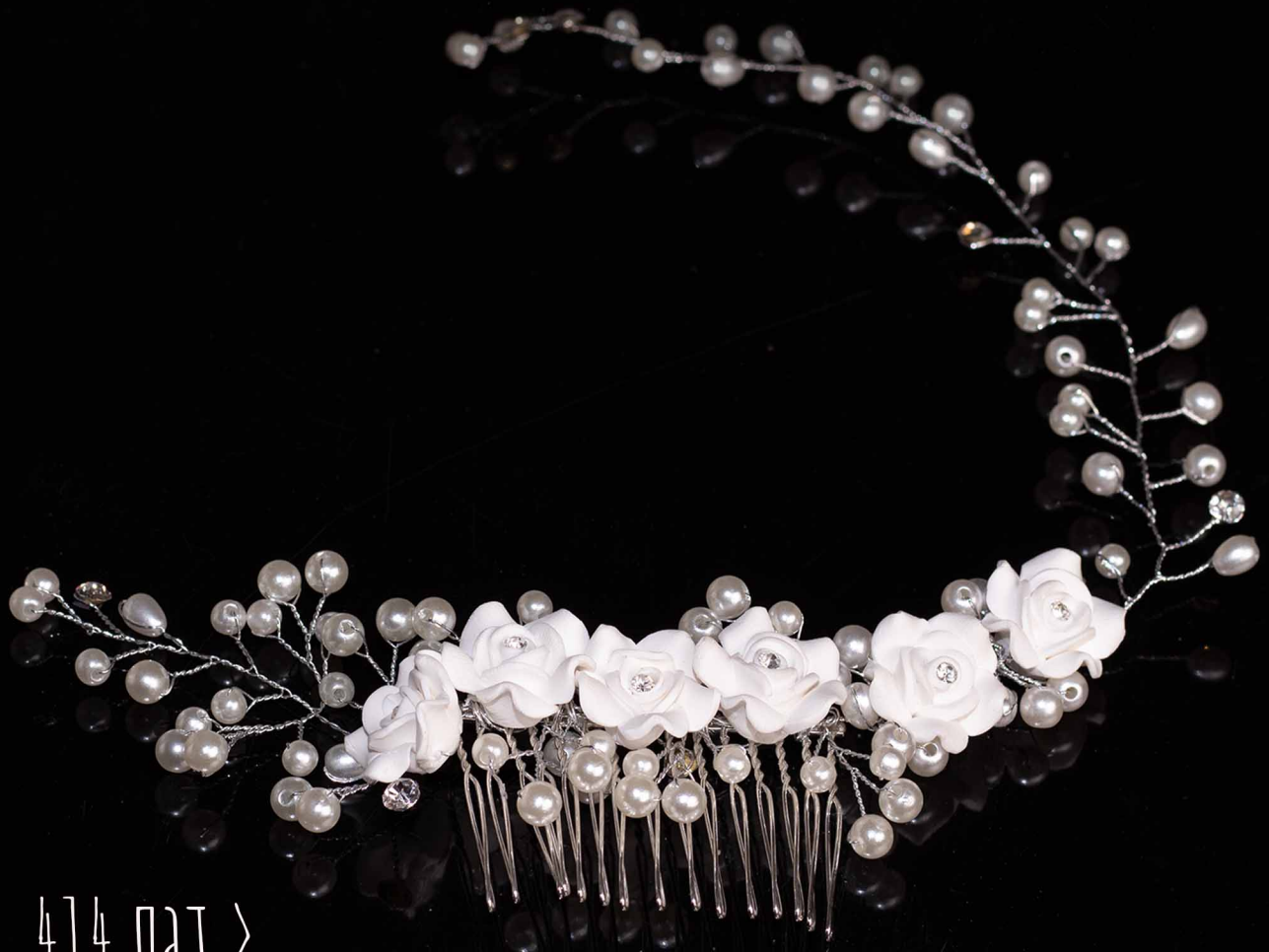
414 סגד >