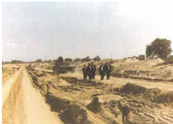
ארץ לא זרחה באשדוד שקמה וניצבה תחת ידיו