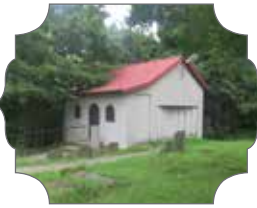
הרה"ק רבי מנחם מנדל מדימנוב זי"ע