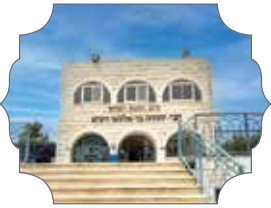
התנא רבי יהודה בר אלעאי זי"ע