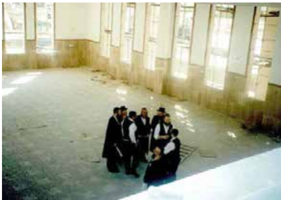
מלווה את שלבי הקמת ביהמ"ד בית מאיר באשדוד