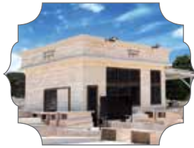
מדרן רבותינו הקדושים זי"ע