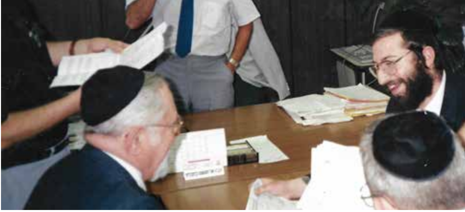
פועל עבור אחיו בעיריית ירושלים