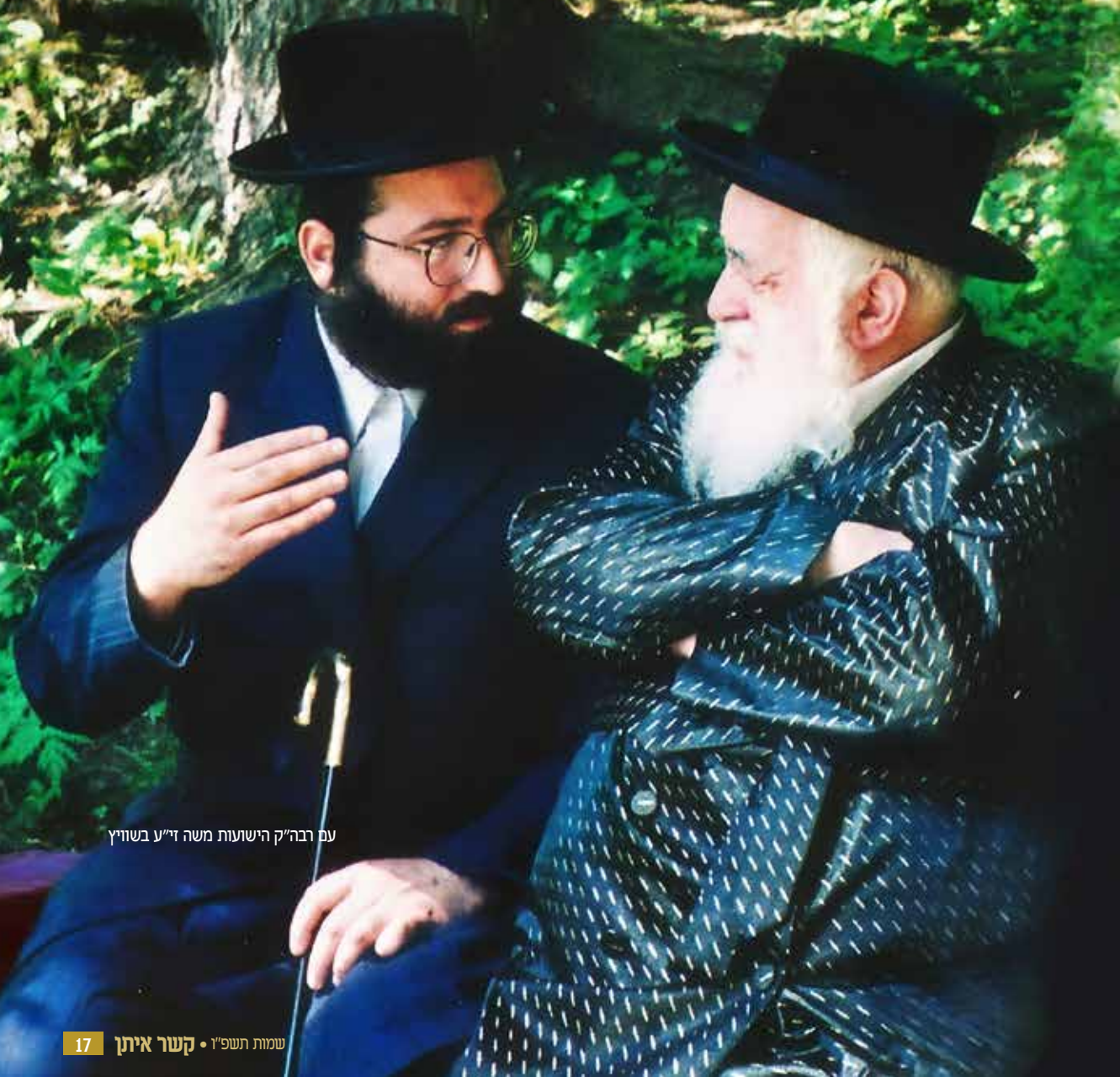
עם רבה"ק הישועות משה זי"ע בשוויץ