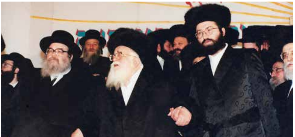
עם רבה"ק ז"ע ויבלחט"א האדמו"ר מבעלזא בחנוכת הבית לביהמ"ד בית מאיר באשדוד

כך החלו העסקנים בהובלתו של ר' מאיר לגלגל את פרויקט הדירור הגדול באשדוד, מלווים בעצתו ובסיועו הצמוד של רבינו ז"ע. לנוכח סירובו העיקש של שר השיכון לסבסד מיזמי דירור לטובת הציבור החרדי, נפגש עמו רבינו הישועות משה' והביע בפניו נרגשות את מצוקת הציבור עד שהלה נעתר לשתף פעולה. גם על הקמתה של אגודת 'משכנות רווחה'