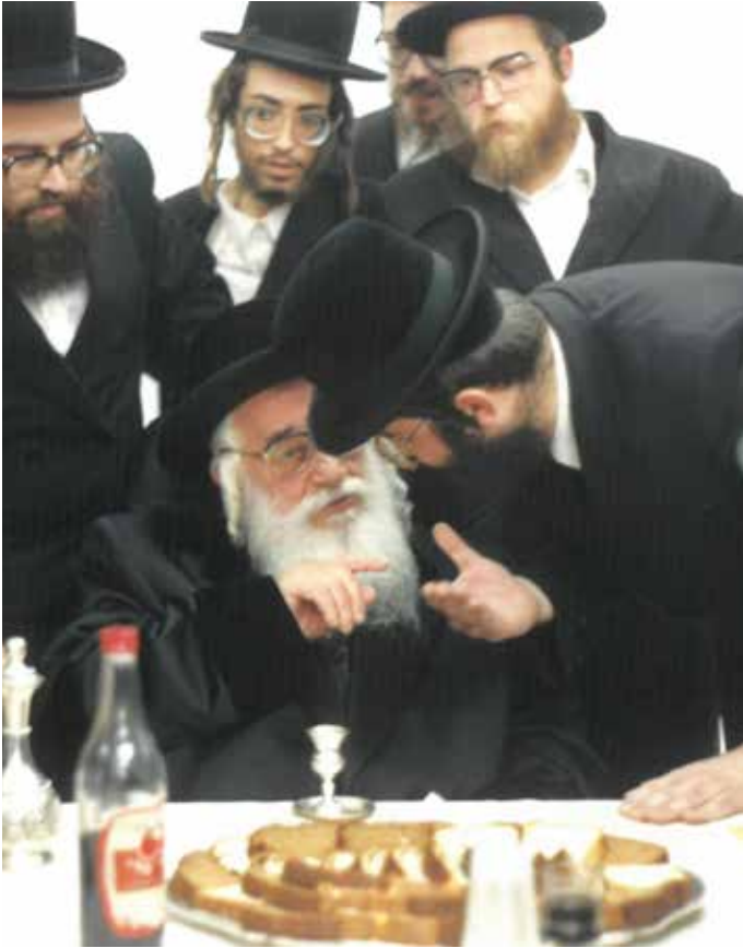
מקבל את הוראת הקודש