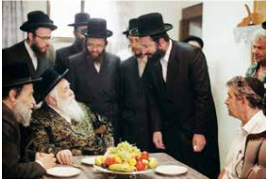
מציג את ראש עיריית אשדוד לפני רביה"ק זי"ע