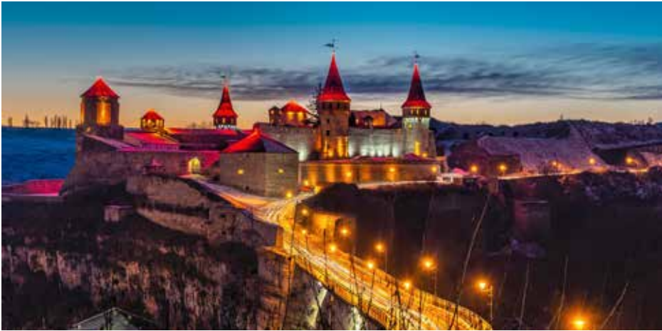
מבצר העיר קאמיניץ בה נשורף התלמוד רח"ל בעצת הפראנקיסטים

כשאמר הבעש"ט 'עננו' נפל ברעיזנו של רבינו פישט נכון בתוספות בו התקשה כל כך. אח"כ אמר הבעש"ט לרבינו: "ה'עננו' שלי יכול לפרש טוב התוספות". השיב רבינו: "רואני כי יש לכם חלק בתורה של כל אחד מישראל, על כן הנני נכון להתקשר אליכם בכל לבבי באמת", ומאז נעשה מתלמידי הבעש"ט