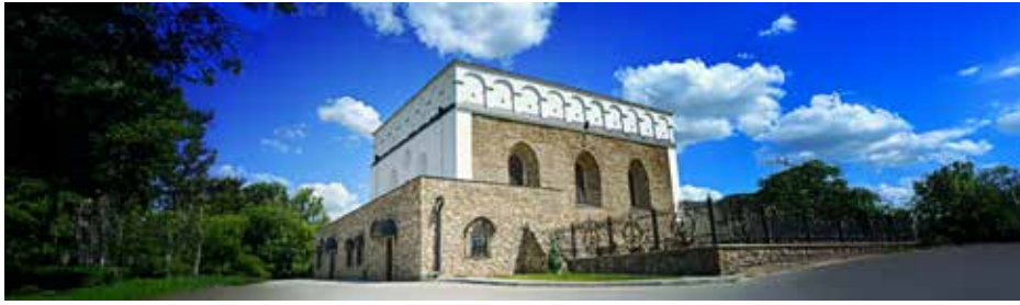
בית הכנסת בסאטינאב ששופץ וחודש

כל אנשי חיל לקרוא אותם, כי בללו לשונם ושפתם ורק הם ידעו הסוד... והביאו אל הגאון הקדוש ר' ישראל חריף אגרותיהם האלה, ותיכף מצא ברוב חכמתו את חידתם, ונגלה נבלותם וטומאתם, כי מצא המפתח והסוד שלהם, וגילה לעין כל עד שהיו נקראים כל אגרתם, ומצאו כי בשוליהם טומאתם וטמא טמא יקראו, ואז התחילו לרדוף אותם ולגרשם ולהדפם ולהבדילים מקהל ישראל, והכל היה על ידו... ועוד שמעתי הרבה דברים שהרבו לספר בשבחו, אבל אך למותר הוא כי גלוי וידוע ומפורסם הוא בכל העולם".