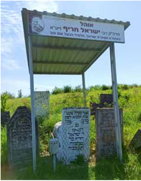
מצבת קדשו של רבינו בסאטינאב

בשנים תק"ד – תק"כ צצה בפולין הכת הארורה ה'פראנקיסטן' שבראשה עמד יעקב פראנק ימ"ש, בהכרזו כי יגאל את ישראל מהגלות, עפ"ל.