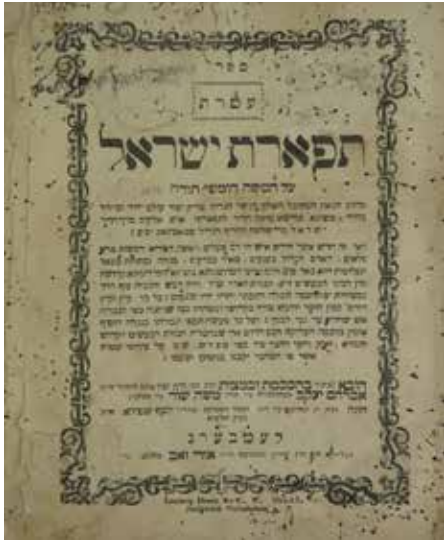
ספרו הקדוש של רבינו