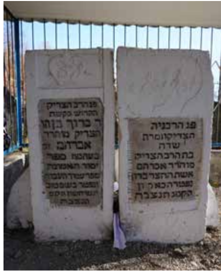
המצבה בקאסוב של הרה"ק רבי בחן ז"ע מגדולי תלמידי הבעש"ט שחיבר את ספרו 'עמוד העבודה' כדי לעקור את טומאת הפראנקיטים

העיד קדושי ישראל הבעש"ט ז"ע: רבי ישראל שלי מסאטינוב, אפילו בשעה שיושב על האיציטבא שלפני ביתו, ומעטן את המקטרת שלו, גם אז הוא מייחד יהודים קדושים