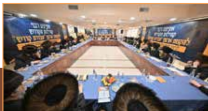
כלל רבני חצרות הקודש באסיפה