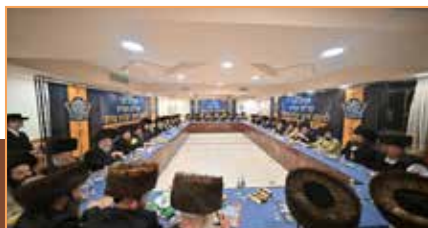
כלל רבני חצרות הקודש באסיפה