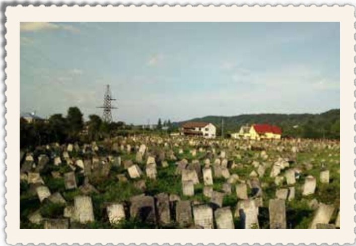
בית העלמין החדש בויזניץ (טשעוניהחא)