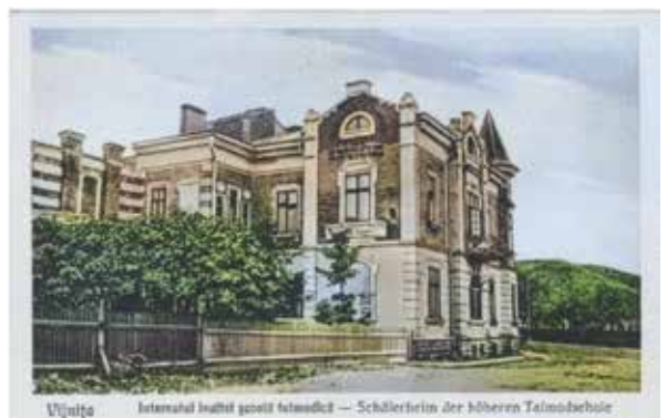
האינטערנאט' - פנימיית הישיבה בוויזניצא אז והיום