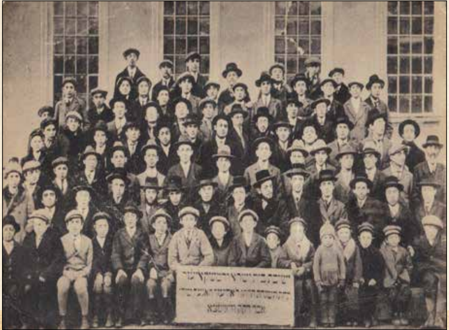
תמונה הסטורית מתלמידי הישיבה"ק בוויניצא בשנת תרפ"ט, ברקע נראים חלונות ביהמ"ד העתיק

תשט"ו: חנוכת האגף השני של בנין הישיבה בשיכון ויזניץ