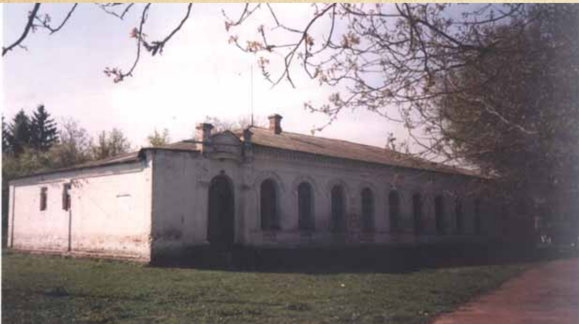
נישט אלעס קען מען נאך מאכן". הוויף בעיר ראחמיסטריווקא