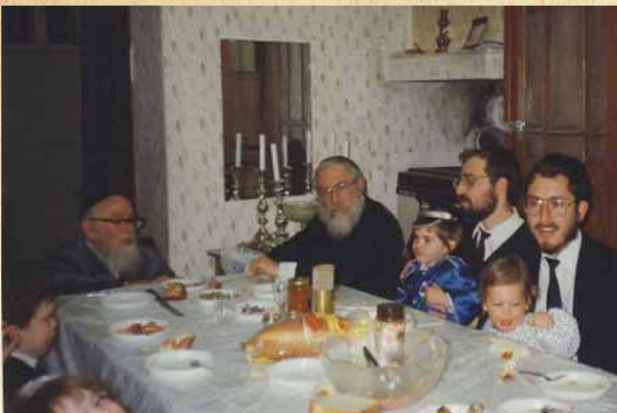
סמוך על שולחן חותנו הגדול. רבינו זצ"ל עם בניו ונכדיו יבדל"ח בסעודת פורים בבית חותנו מרן הגרש"ז אויערבאך זצ"ל