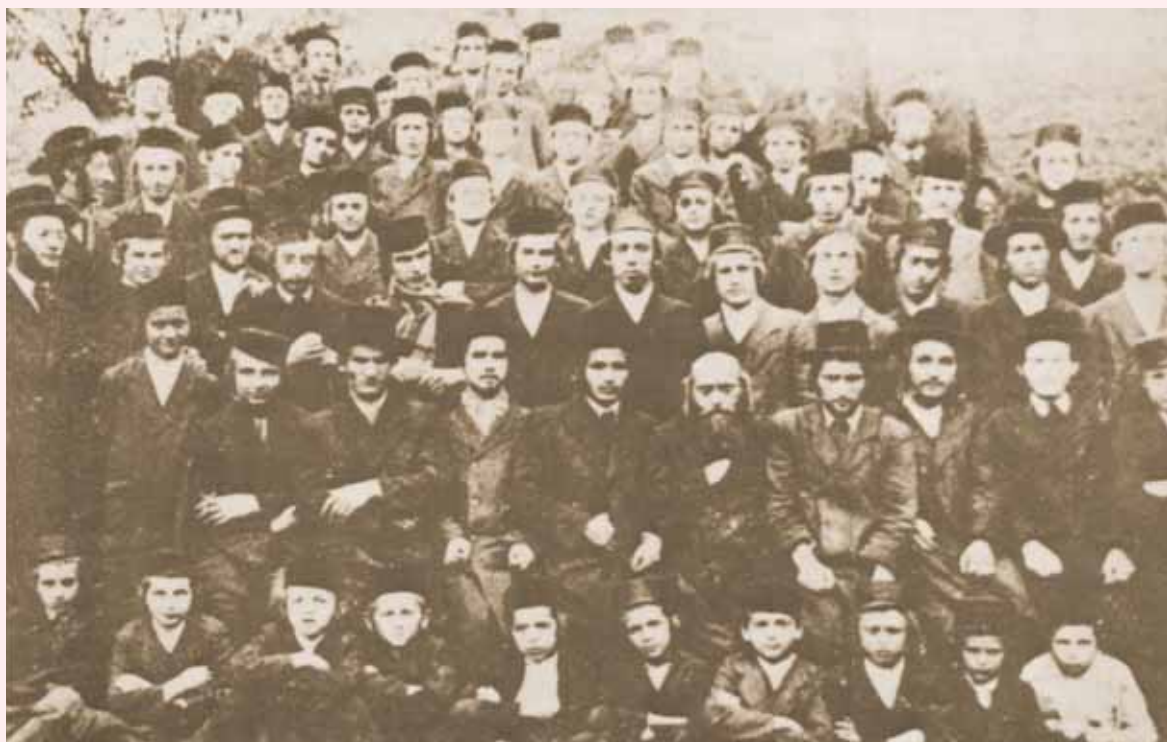
תלמידי ישיבות 'עץ חיים' בגלציה

מעורבותם הישירה של הבעלי-בתים בהחזקת לומדי התורה, מתוך אהבת התורה, הביאה להשפעה ברוכה על בתיהם: "וכמעט שלא היה בית בכל מדינות פולין שלא היו לומדים בו תורה, או הבעל הבית בעצמו היה למדן או בנו או חתנו היו לומדים, או בחור אחד מאוכלי שלחנו ולפעמים היו כלם יחד בבית אחד, והיו מקימין כל ג' דברים שאמר רבא במסכת שבת פרק א', 'אמר רבא דרחים רבנן הוה ליה בנין רבנן, דמוקיר רבנן הוה ליה חתנותא רבנן, דדחיל מרבנן הוא גופיה הו צורבא מרבנן, ולכן היו בכל קהלה וקהלה הרבה חכמים, אם היתה קהלה מחמשים בעלי בתים היו שם עשרים חכמים שנקראו בשם 'מורנו' או בשם 'החבר', והראש ישיבה