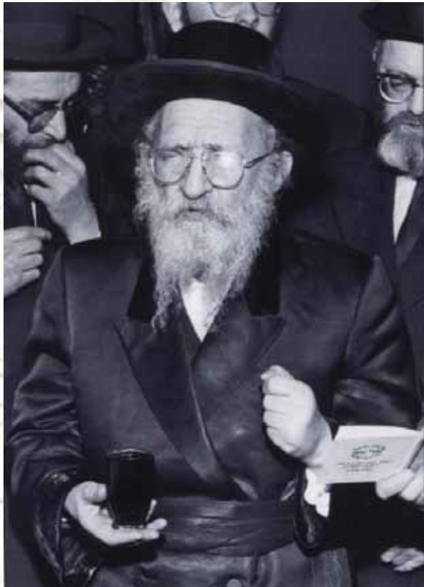
כ"ק מרן אדמו"ר ה'נועם אליעזר' מסקולטן ז"ע | לרגל יו"ד כ"ט מנחם-אב