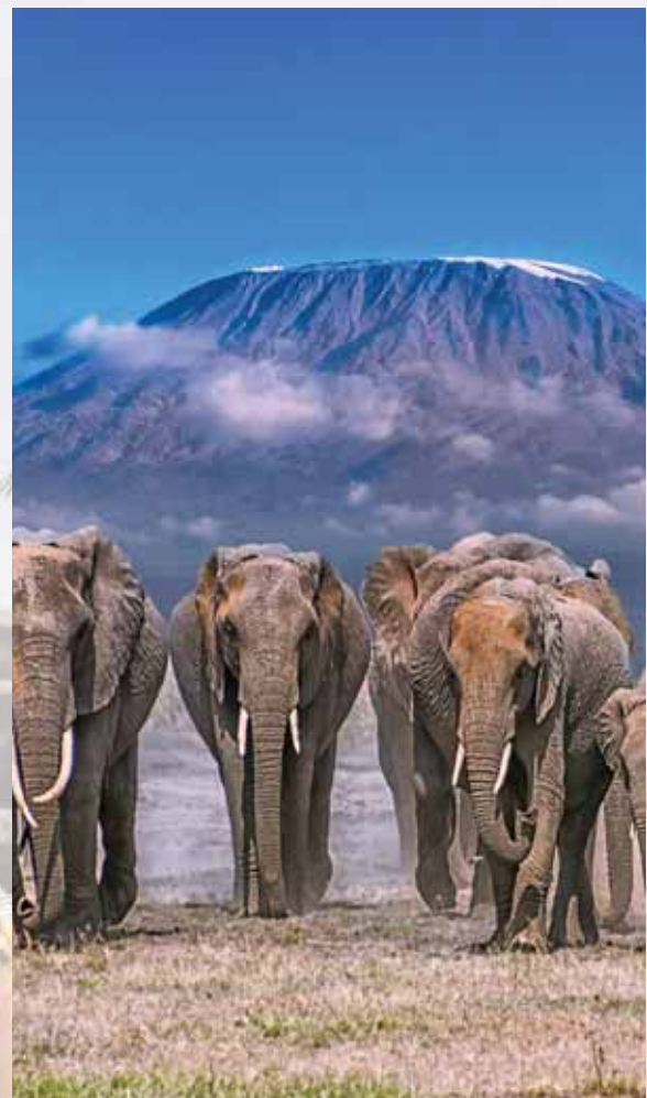
משנה הבריות | עדר פילים בסוואנה באפריקה

בתוך דבריו מזכיר החזון איש "ולפעמים האדם לומד מהם חכמה ומוסר" - דבר זה נזכר כבר בתנ"ך והרבה בדברי חז"ל, ונציין שני עניינים מרכזיים: אמונה כך אמר אליהוא (רעהו של איוב) לאיוב (לה, יא) "מלפנו מבהמות ארץ ומעוף השמים יחכמו". אין הכוונה כמוכחן שבעלי