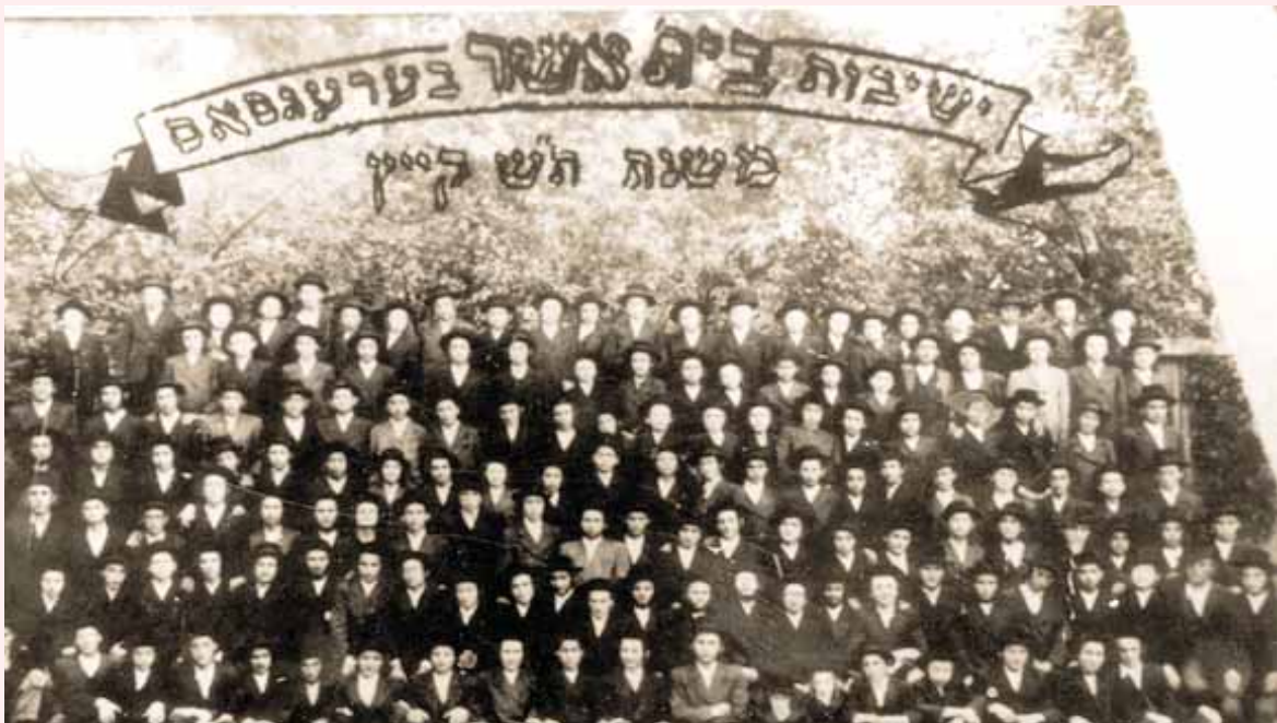
תלמידי ישיבת 'בית אשר בערגסאס' בקיץ שנת ת"ש

לבחורים תהיה לא פחות מי"ב צלמים (- קרייצר, שם מטבע), ולנער הלומד עם חברו לא פחות מז' צלמים, ולנער פחות קצת מזה.