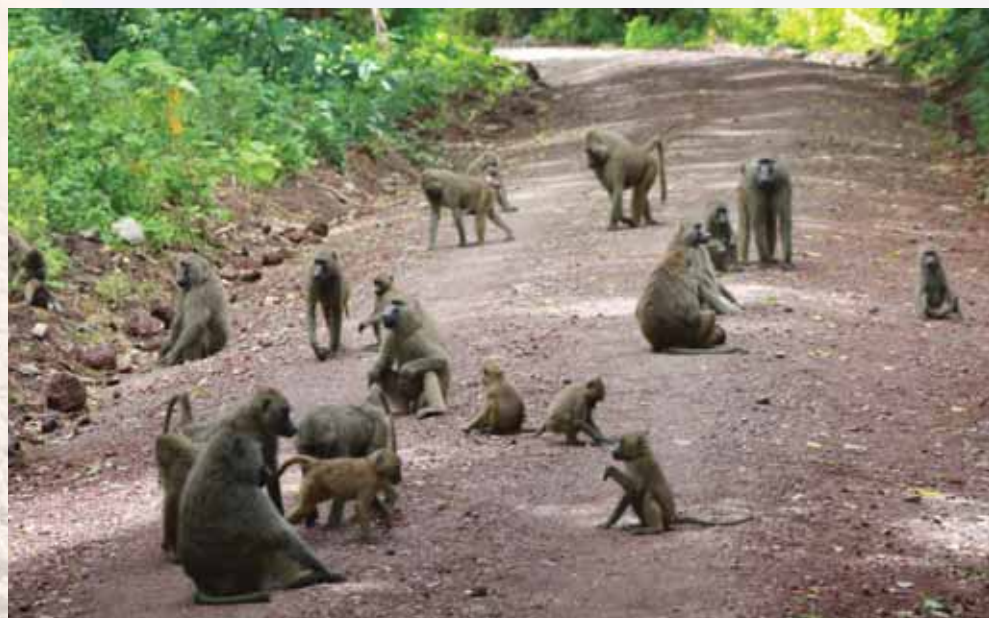
הקופים שימשו לשעשוע ולצרכי האדם | להקת קופי בבון בג'ונגל

שיניו של הכלב רחוקות זו מזו ולא ישרות, (כך נזכר בהלכות