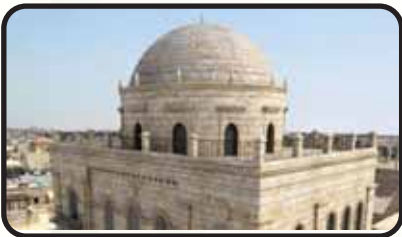
ביהכ"נ 'תפארת ישראל'

ביום ג' אלול שנת תש"ד נשלח מכתב היסטורי מאת אדמו"ר ר' רודין בארה"ק אל אדמו"ר ר' רודין המתגוררים בארה"ב למען בית הכנסת הגדול 'תפארת ישראל' רודין בעיר העתיקה בירושלים, כשבראש החותמים היה הס"ק הרה"ק רבי ישראל מהוסיאטין זי"ע, הנה כמה שורות מתוכו "בי"ה ירושלים ת"ו יום ג' לחודש אלול שנת תש"ד... אחרי המאורעות האיומים לפני שנים כאן בארץ הקדושה כשהעיר העתיקה נתרוקנה מיושביה החסידים והתמימים שהיו לאות ולמופת במעשיהם ובמידותיהם הטובות מדור דור, הוזנה גם בית מקדש מעט זה דלתותיו כמעט נסגרו כתליו הטו ליפול, ח"ו נתעוררנו כאמור לעיל לחזק את בדיק הבית, ולחדש את ימיו בקדם להכניס שוב לתוכו חבר של מתפללים הגונים ולומדי תורה ובעז"ה יתברך חפץ ה' בידינו הצליח ויסדנו חברת בית הכנסת תפארת ישראל מרוזין".