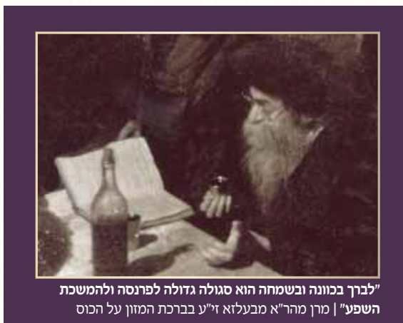
"לברך בכוונה ובשמחה הוא סגולה גדולה לפרנסה ולהמשכת השפע" | מרן מהר"א מבעלזא ז"ע בברכת המזון על הכוס