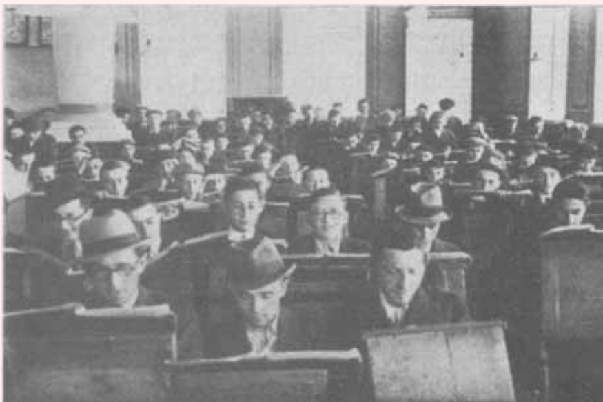
היכל ישיבת לומדה בפולין באמצע סדר הלימוד

לתקנה זו עדות מוקדמת יותר: במסכתות הש"ס שנדפסו בלובלין בשנים ש"ט-של"ז, ברוב השערים, נכתב: "בהסכמת גאוני עולם וראשי ישיבות דש"ל מדינות פולין רוסיא וליטא, שהסכימו בהסכמה אחת ותקנו בתקנה חזקה כחתימת ידיהם שילמדו בכל ישיבה דש"ל מדינות הנ"ל מסכתא אחר מסכתא כאשר נדפוס אי"ה אותן בעזה" כדי להרביץ תורה בישראל וכדי לחזק ולאמץ ידינו במלאכת שמים".