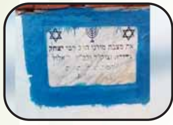
המצבה כיום בתוניס

מגדולי גאוני וקדושי העיר ג'רבא שבתונים היה הגה"ק המקובל רבי יצחק צדיקא זי"ע אשר שמו נודע מדור לדור כאיש אלוקים קדוש, ואולם במשך שנים רבות לא ידעו בכירור באיזו שנה הסתלק.