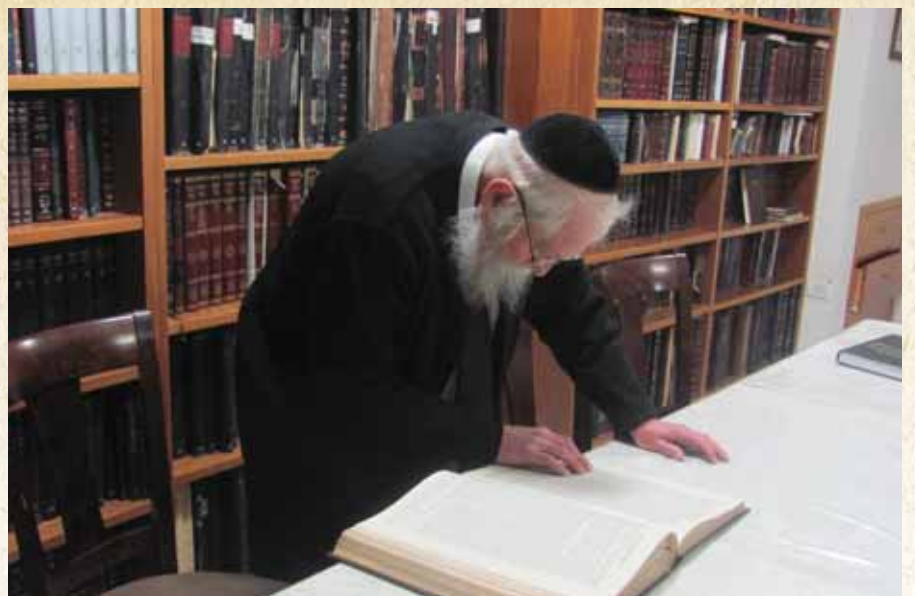
יגיעה עצומה בתורה כל ימיו. רבינו זצ"ל בעיון הלימוד בביתו