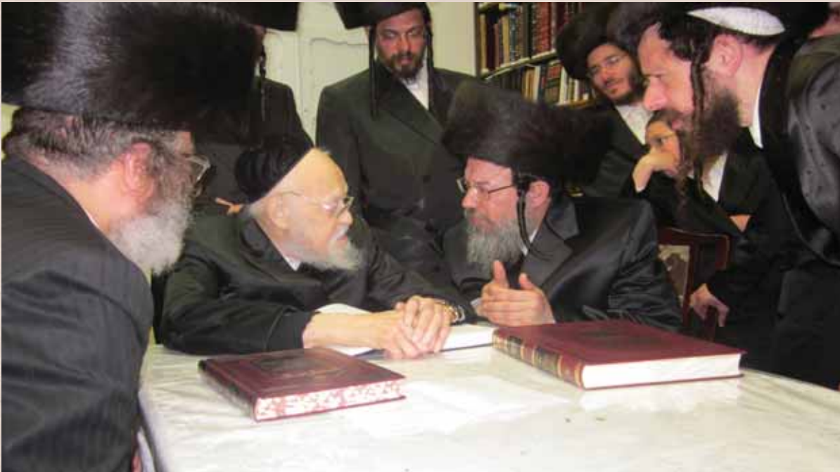
רבינו צוק"ל בשיחה תלמודית עם מרן הגר"ש אלישיב צוק"ל

במלאות שלש שנים להסתלקותו - ב' אלול תשפ"ב - תשפ"ה