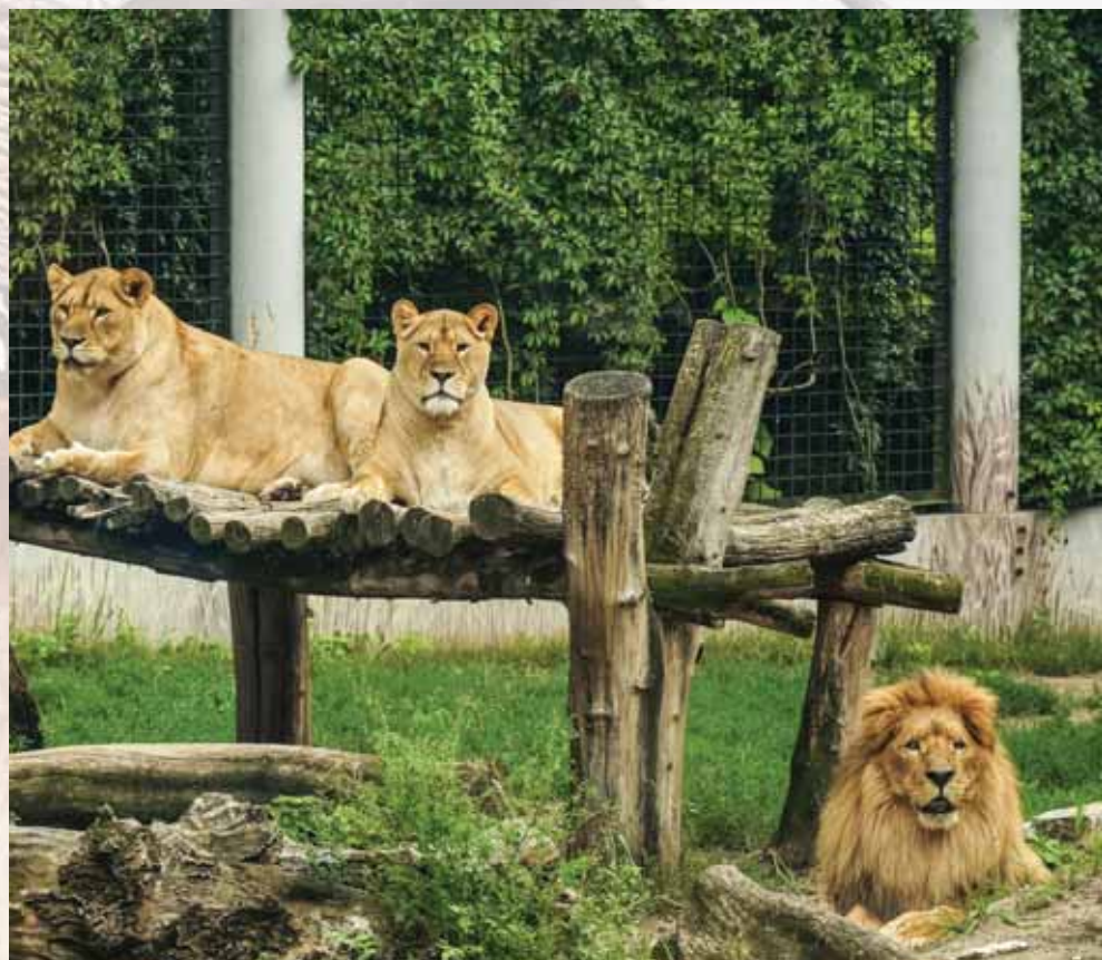
האריה נעמד על רגליו האחוריות ושם שמים התקדש לעיני הגויים | אריות בגן-חיות

קופים למכביר מאוד וגם פילין כנודע.. כמוכן שכדרכו בקודש התעורר מזה לנידון הלכתי בהלכות ברכת משנה הבריות, אם יצא בברכת משנה הבריות שביך על הקופים גם על הפילים, כשלא היה בודאי שיראה אותם. ובדומה לזה סיפר הגאון בעל תורת חיים (הגרי"ש סופר מפעסט): "ופעם אחת הייתי בטהיער גארטען לראות את החיות, וברכתי משנה את הבריות על כמה מיני קוף וכוונתי לצאת גם על הפיל, הגם שאין עומדים ביחד...". כאשר היה כ"ק מרן בעל האמרי אמת מגור זצ"ל בדרכו לארץ הקודש, עבר בקהיר שבמצרים, שם ביקר בגן החיות. וכפי המסופר שאצל הקופים והאריות עמד והתעכב זמן רב.