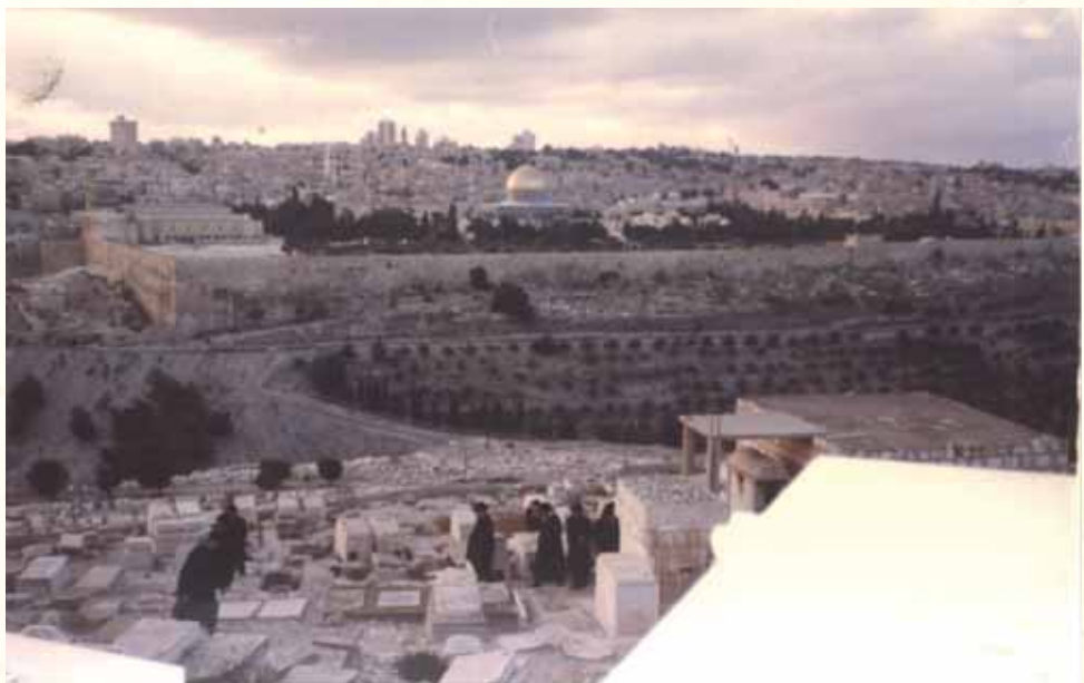
יודע בעצמו שמעודו לא פגע ביהודי. האהל בהר הזיתים על רקע הר הבית וירושלים