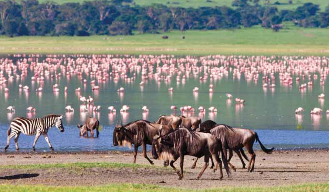
אמצעי הגנה, קרניים, ריצה וראייה חדה | קיבוץ חיות במקווה המים בסוואנה

אלוקית זו, שמכחה ניתן לבני האדם הדעת למצוא את האפשרות איך לכבוש את בעלי החיים לצרכיו.