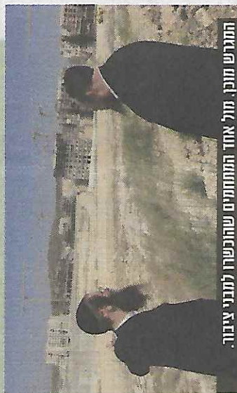
תחרש מוכן מול אחד התוניתס שהוכשרו למבני ציבור.