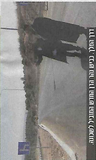
דרך התלך. בניש תהר החרדש התוניתל לשכונה.

גולדברג: "אנשים מדברים על בניה, בעיר זו בנינים פרייקט או בעיר אחרת, כולם כמובן אומרים וכולם ברוכים וטובים ומסייעים לציבור, אבל בית שמש זה משהו אחר, כל הבניה ברמות החדשות זה סדר גדול של למעלה מ-20 אלף יחידות ידיות, בית שמש כמעט מכפילה את עצמה, זה מספרים שלא הכרנו, כאן השכונה עצמה בה אנו נמצאים זה 11.000 ידיות, מתוכן כמעט רבבת ידיות שנמצאים בהליכי בניה, לא סיפורים אלא בלוקים, זה אומנם הכל תחת הכותרת של 'בית שמש', אבל נבנית כאן עיר חדשה של ממש, כך גם היחס אליה, לא מדובר רק על רחוב הטבעת שנקרא כאן "שדרות האמוראים" שזה משהו כמו רחוב רבי עקיבא של בני ברק, רחוב שכל החזית שלו היא חנויות ומסחר, אלא הכל כאן מצריך חשיבה בראש גודל, כמי שלא הולכים לאכלס שכונה אלא לאכלס עיר, וכך אכן נעשה בעירייה יחד עם משרד השיכון, בתקווה ובתפילה שתשרה ברכת ה' במעשי ידינו, ונבנתה עיר על תילה".