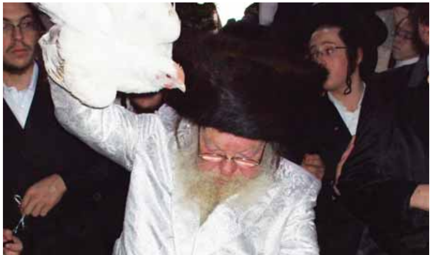
כ"ק מרן אדמו"ר מלעלוב זצ"ל בעשיית כפרות