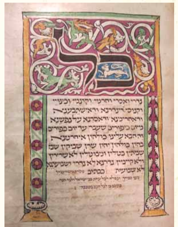
התעוררות גדולה. נוסח כל נדרי

את נועם אמריו פותח הגרי"א אונסדורפר שליט"א במנהג המקובל בכל תפוצות ישראל, לומר בהתעוררות גדולה בליל יום הכיפורים את נוסח 'כל נדרי' השמור לנו עוד מימי רבותינו הראשונים. מקור המנהג הוא מהא דאיתא בגמרא (נדרים כג): "הרוצה שלא יתקיימו נדריו כל השנה, יעמוד בראש השנה ויאמר, כל נדר שאני עתיד לידור יהא בטל". אולם, דבר אחד יש לנו לבאר, למה אומרים זאת דווקא בכניסתו של יום הכיפורים, שאז הווי עת רצון מיוחד והתעוררות האדם גדולה היא עד מאוד, כאשר כל אחד טרוד אז בתשובה, בתפילה ובחשבון הנפש, ולמה