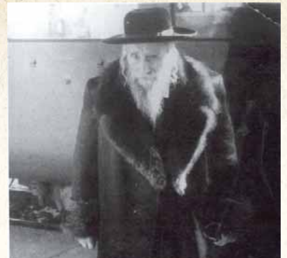
תשובה מאהבה. צורת קדשו של רבינו

נטל נר בידו, הביט על מצח אחיו ונענה: "כתוב ומחוק, כתוב ומחוק". כלומר, בכוח התשובה נמחק רושם החטא שעל המצח. כאשר ב'ראשית חכמה' (שער התשובה פ"ה) מובא שכאשר דומעים בתשובה, באות דמעות התשובה ומנקות את המצח מכל רישומי החטא.