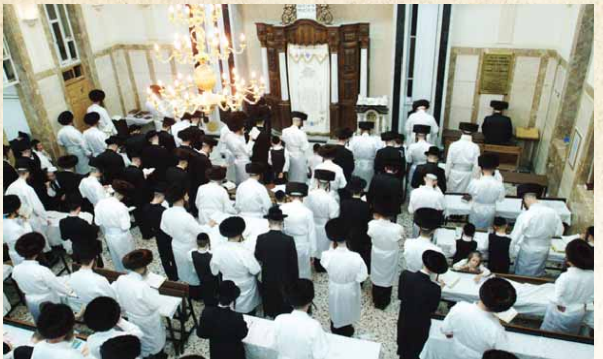
הרהור תשובה שמגיע לכל יהודי בימים אלו. מתפללים בערב יום הק'

כאשר יהודי יהיה באותה צרה - אשר הצדיק היה בה - יוכל היהודי להתפלל לה, ותפילותיו יגיעו אל הקב"ה דרך השער הנ"ל. "והנה, דוד המלך ע"ה היה מוקף בשונאים שהיו מבקשים אותו נפש והיו מטכסים עצה ותחבולה איך להורגו, לפיכך חבר מזמור מיוחד, להודות ולהלל לפניו על הנסים שעשה לבני ישראל על קריעת ים סוף ולעורר את ההתעוררות שהייתה בשעת קריעת ים סוף - שבני ישראל עמדו אז בעת צרה והיו מוקפים בשונאים וצעקו אל ה' וענה להם, כאשר בזה רצה לעורר למעלה שייפתח השער ההוא שנפתח על הים, גם עכשיו יהיה עת רצון, וייושע באותה ישועה שנושעו בה ישראל. "ולכן אומרים אנו בכל יום מימי אלול ותשרי המזמור הזה, כדי לעורר בזה שהקב"ה יפתח לנו את השערים שנפתחו בתפילתם של ישראל על הים, ובתפילתו של דוד המלך בשעה שהיה הוא בעת צרה. מעתה, מתבאר לנו טעם אמירתנו מזמור זה והתועלת שיש באמירתו, שעל ידו זוכים אנו לצאת זכאי בדיו מבלי שיהיה פתחון פה למקטרגים ועל אף שאין אנו ראויים לכך."