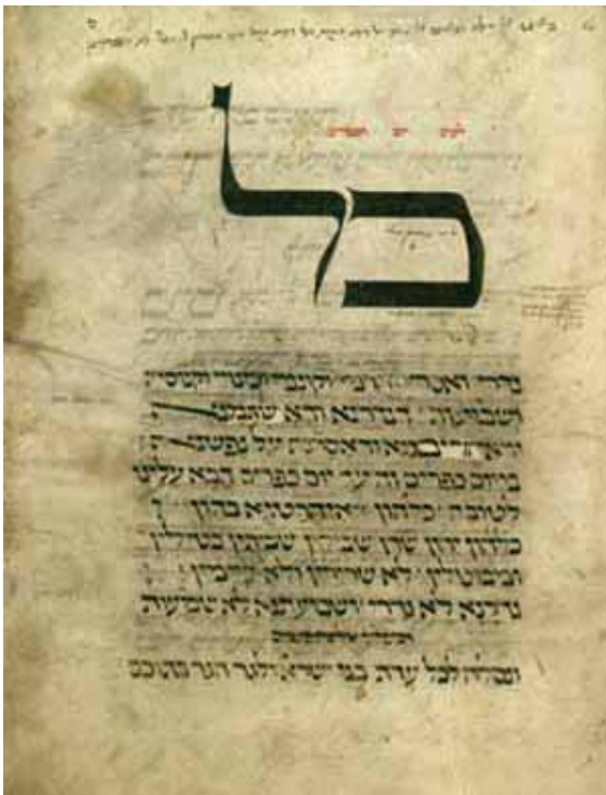
מתוך מחזור וורמייזא (וורמס) - כרך ב', 1272

על פי דברי המגיד מקאז'ניץ מבאר הרה"ק רבי צדוק הכהן מלובלין ז"ע ("פרי צדיק" ערב יוה"כ, ג) שמועה נשגבה שנשמעה מפה קודשו של המגיד מקאז'ניץ בעצמו: "ושמענו בשם המגיד דקאז'ניץ זצ"ל שאמר פעם אחת בערב יוה"כ, שגם אז בזמנו נמצא כוח ג' האבות הקדושים, ואמר על הרב הק' מאפטא בעל אוהב ישראל זצ"ל שהוא בחינת אברהם, ועל הרבי מלובלין זצ"ל שהוא בחינת יצחק, ואת עצמו שהיה שמו ישראל חשב כנגד בחינת יעקב, רק חסר הכבש להקריב. ואמר שהוא מכוון כל אותן הכוונות של הכה"ג בהקרבתם". ומבאר הרה"ק רבי צדוק הכהן את הדברים העלומים, על פי דברי המדרש (ויק"ר כא, יא) שדרשו על הפסוק (ויקרא טז, ג-ה) "בזאת יבא אהרן אל הקדש בפר בן בקר לחטאת ואיל לעלה... שני שעירי עזים לחטאת", ששלושה מיני קרבנות אלו רומזים לזכותם של האבות הק' שעמם בא הכהן הגדול לקודש הקדשים: "בפר בן בקר" זה אברהם... "איל לעולה" זה יצחק... "עז" בזכותו של יעקב... לכן אמר המגיד, כי גם בזמנו ישנם צדיקים הקרויים בשמות אבות הקדושים והם בבחינתם, ובכוח זכותם וקדושתם, בצירוף הכוונות הפנימיות של סדר העבודה שהוא יכול לכוון - כמו שהיו מכוונים גדולי הדור בזמן שלא היה הכהן גדול ראוי לכך, תתקיים הפעולה הרוחנית של עבודת היום. רק חסר הכבש להקריב" - כלומר, "מכיוון שיכול להיות הכוונות על ידי אחר, אין הקרבנות