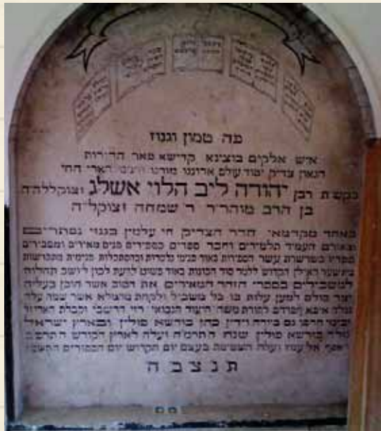
מצבת קדשו בהר המנוחות

אליו מיום כ"ג בכסלו תרצ"ב מפרש רבנו את שיחו בתורת ה"גייעה", וכה דבריו: