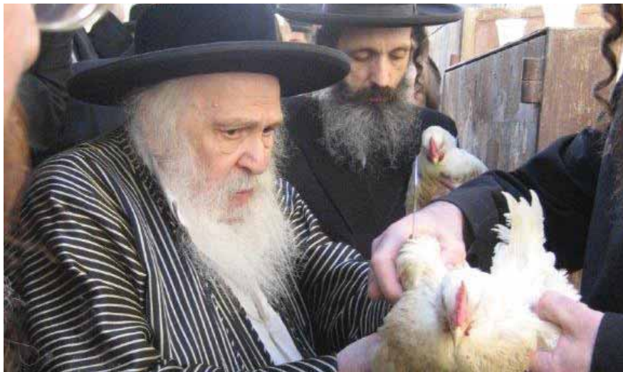
כ"ק מרן אדמו"ר ה"חוקי חיים" משומרי אמונים זצ"ל בעשיית כפרות

"ריבוננו של עולם. לא יקומו רשעים במשפט רשעים ומזידים שבבני ישראל לא יעמדו כלל למשפט למעלה. ואילו וחטאים אלה שחטאו בשוגג בלבד, אף ייחשבו בעדת צדיקים להיכתב