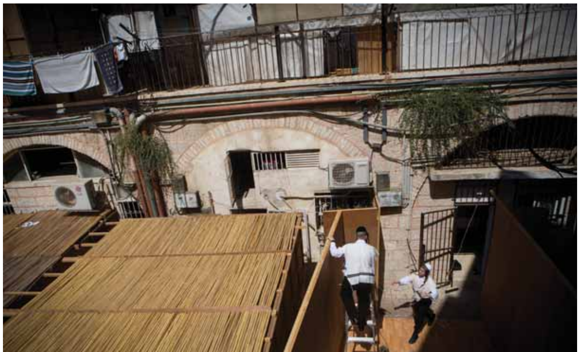
קדושת הימים שבין בין עשור לסוכות. בניית סוכה (אילוסטרציה, למצולמים אין כל קשר לכתבה)

תחושה עילאית זו מקבלת ביטוי בדבריו של החת"ס עצמו ('דרשות חתם סופר', לשבת הגדול) שהטעים את קריאת יום הכיפורים בשם 'יום הגדול יומא צומא רבא'; "כי כל מצוה בעידנא