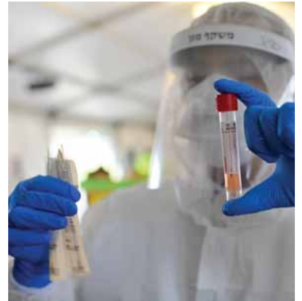
בתקופה בה שכיחי היזקי יש להיזהר במשנה זהירות שלא להיכנס לידי סכנתא החמורה מאיסור. בדיקת קרונה

אחי ורעי! רייסט איין וועלטן! לא כדאי להתפלפל בדברי הבאי וסרק האם המצב הנוכחי נקרא מגפה, בשביל הספק המנקר בראשם של רבים וטובים, האם יש לכוון זאת בתפילת 'אבינו מלכנו מנע מגפה מנחלתך'... זה מעשה יצר מכוון לכתחילה להסיט את הראש ואת המחשבות מהמצב הכאוב והנורא. בלי שום קשר למגפה, גם עשרות אלפי החולים שכבר החלימו בס"ד, שאלו אותם אם הם רוצים לחזור לשבועיים האלה בהם הרגישו כי הם הולכים מהעולם? כמה מאלו סובלים עדיין מהשלכותיו של הנגיף בתחושות חולשה ובקשיי נשימה? בתפילת נעילה של יום הכיפורים העומד בפתחנו, תחשבו ותכוונו בפיט האחרון של י"ג מידות: "יהי רצון מלפניך שומע קול בכיות וכו' ותצילנו מכל גזירות קשות ואכזריות". כן, תחשבו במפורש על נגיף הקורונה ותאמרו בפה: ריבונו של עולם! כל כך הרבה משפחות נהרסו, כל כך הרבה אלמנות ויתומים נוספו בשנה האחרונה למעגל הלבבות הנשברים, כל כך הרבה אנשים הצטערו וסבלו השנה מאימת הנגיף, צדיקים ואדמו"רים רצו בכל מאודם לעשות שמחות ומעמדי קודש רבוב עם הדרת מלך, דחו ודחו ושוב דחו את המועד עד שכשל כוח הסבל. ומי מדבר על התקופה הארוכה בה בתי כנסיות ובתי מדרשות היו נעולים על מסגר ובריח, לא יאומן כי יוספר למפרע.