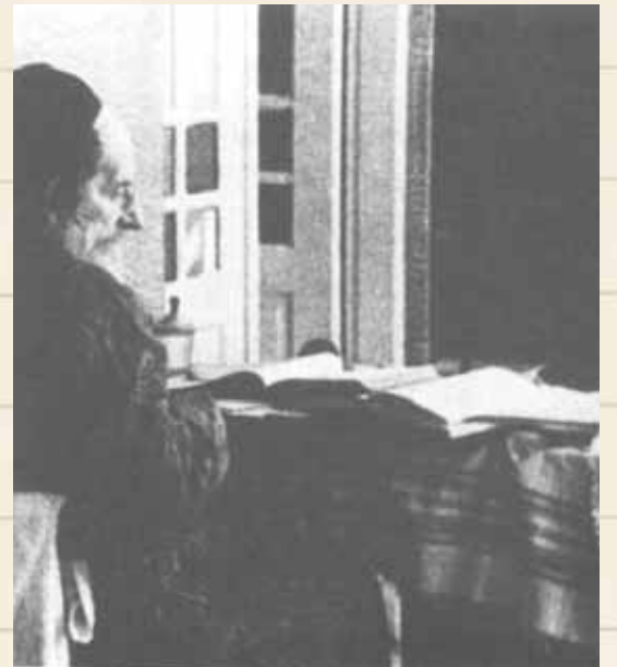
נקראתי הביאור בשם 'הסולם', להורות שתפקיד ביאורי הוא בתפקיד כל סולם. רבנו יושב בביתו בערוב ימיו וכותב את חיבורו על הזוהר

ממשיך מרן באגרת: "הנלמד מהאמור, שאין דבר קטן או גדול מושג אלא בכח התפילה". נשאלת השאלה: העבודה והיגיעה - לשם מה? התשובה לכך: ההקדם של העבודה והיגיעה, תפקידו הוא אך ורק לגלות את מיעוט כוחותינו ושפלותנו, שאין אנו ראויים לכלום מכם עצמנו, ורק אז אנו מוכשרים לשפוך תפילה שלימה לפניו יתברך.