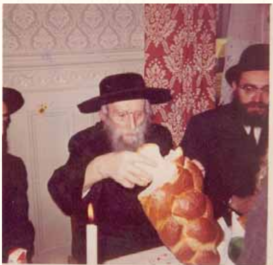
ע"י מתיקות הדבש שטובלים בחלה ממתקים את הדינים. רבינו בוצע חלה