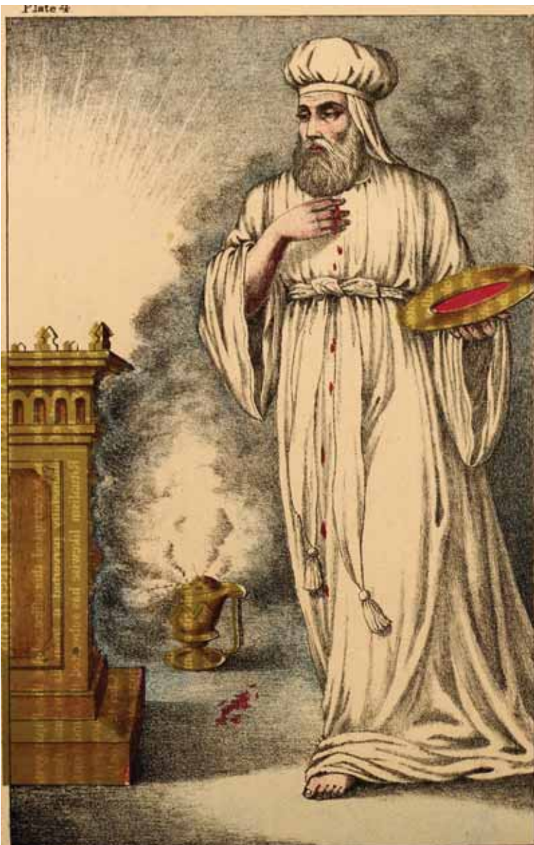
המחשה של הזאת הדם בבגדי לבן