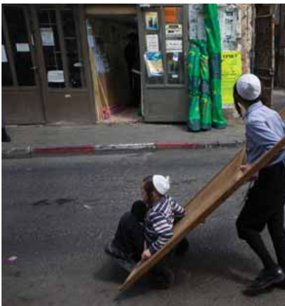
המהפך מיום חלילה ורעדה לימי שמחה וגילה. בניית סוכה (אילוסטרציה, למצולמים אין כל קשר לכתבה)