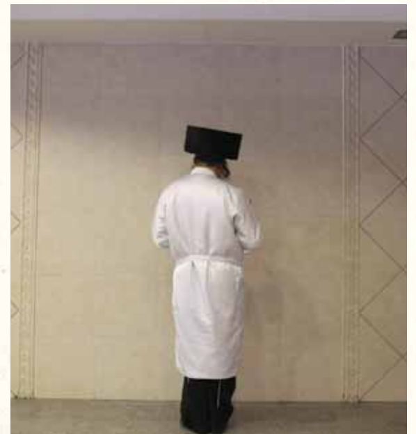
להיות זכאי בדיון. יהודי בתפילה בערב יום הק' (אילוסטרציה)

"לכן היו מתקבצים בכל שנה ושנה במסדרות נפש נפלאה בליל יום הכיפורים, והיו מתירים נדריהם ושבוועתיהם שנדרו ונשבעו למלכות, והיו עושים זאת בשיברון לב ובחרטה אמיתית מתוך כמיהה וערגה להש"ת. והיו שרים את ה'כל נדרי' בניגון זה המקובל, ומזה נקבע הדבר לדורות שכל בית ישראל שרים את ה'כל נדרי' בניגון מעורר זה, ומכאן גם נגזרת ההתעוררות העצומה השוררת בעת אמירת 'כל נדרי'."