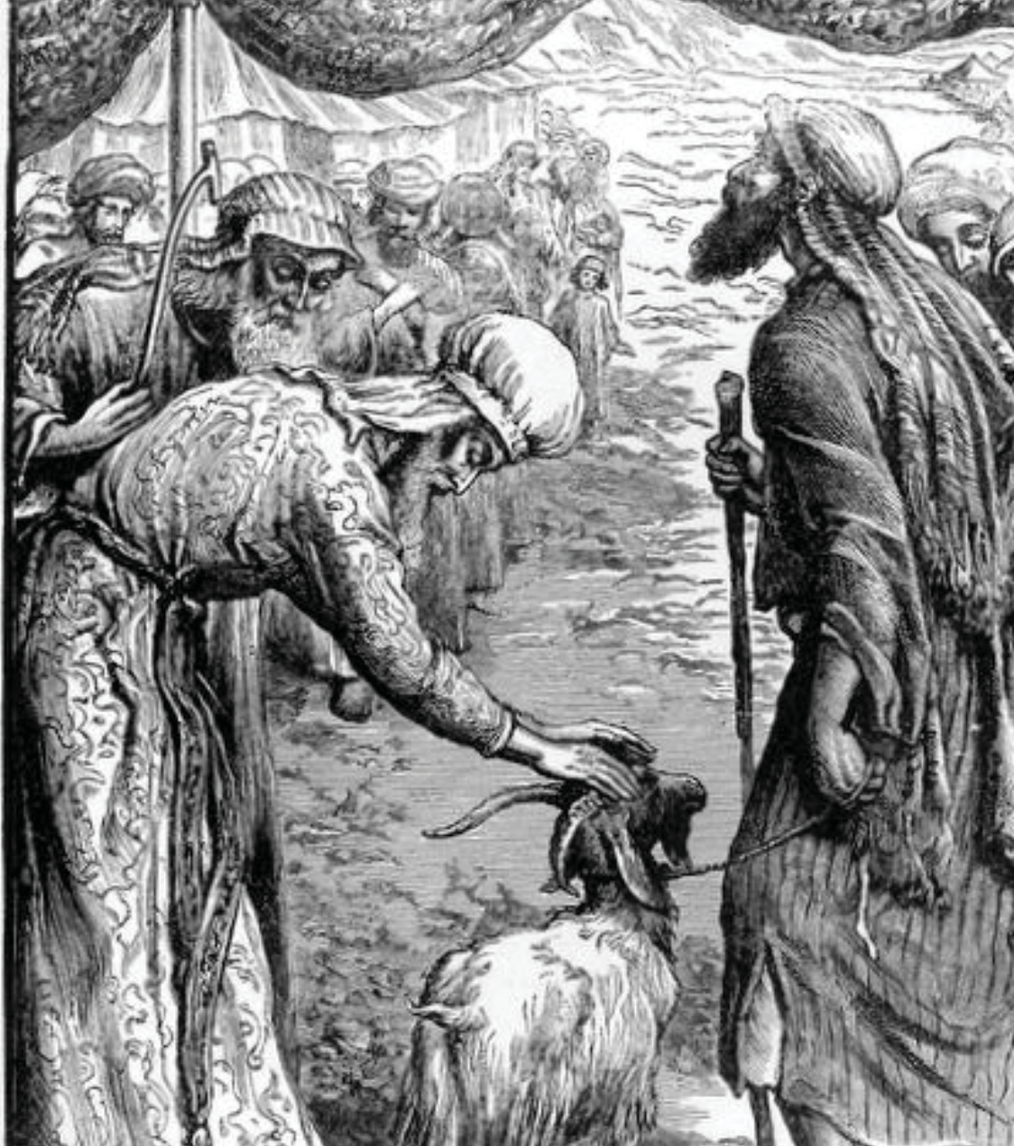
המחשה של הגרלת השעירים

חטאת. ואני בינותי בספרים ומצאתי שהאמת כדברי הסברא השנית שיש לאומרו עד בשכמל"ו (ונציין שאכן כך היא הנוסחה שלפנינו).