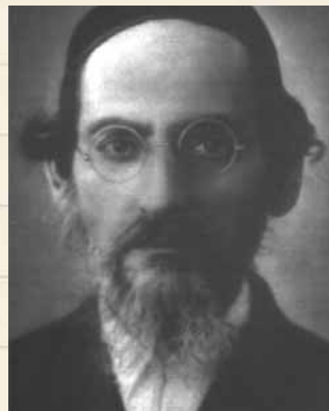
בגיל י"ט הוסמך להוראה על ידי רבני וורשה. רבנו בצעירותו