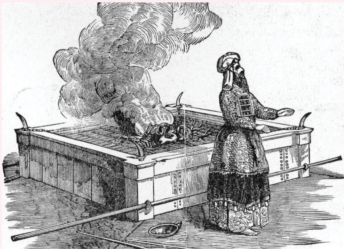
המחשה של הקרבת קרבן ביום כיפור

אם כן צריכין לידע היאך הכהן הגדול היה מזכיר אותו ביום הכיפורים. ולכן צריכין אנו לקבל האמת באופן ההזכרה הזאת, שלא הייתה בפועל, אלא בכוח, ובאותו יום המיוחד בשעת העבודה שהייתה בבית קודש הקדשים היה כהן גדול מקדש