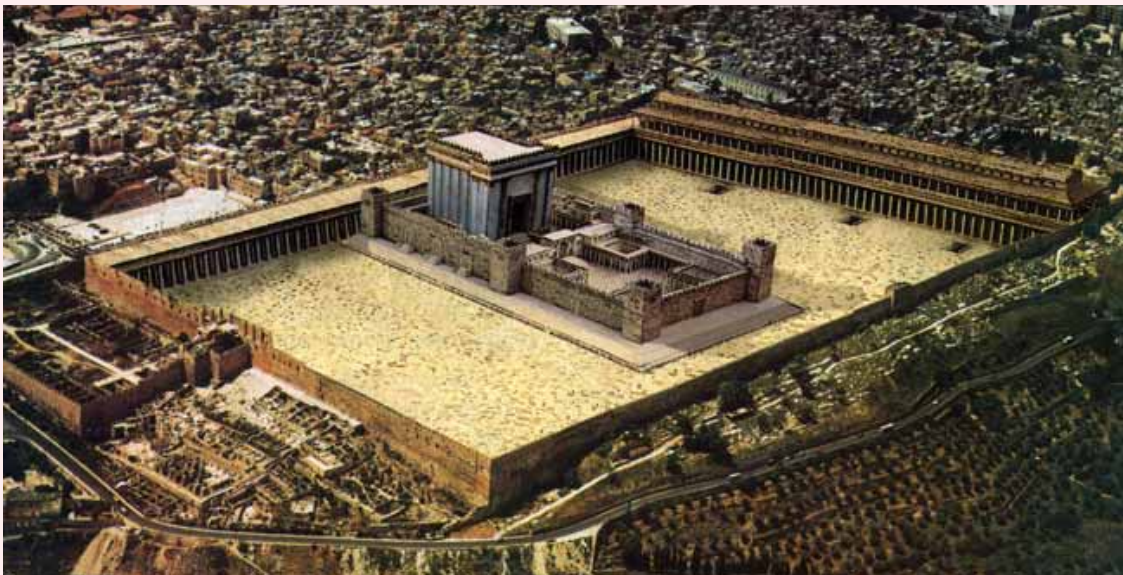
המחשה של בית המקדש

על מעלת הכריעה וההשתחויה ביום הכיפורים אשרי עין ראתה כל אלה השב שכינתך לציון וסדר העבודה לירושלים