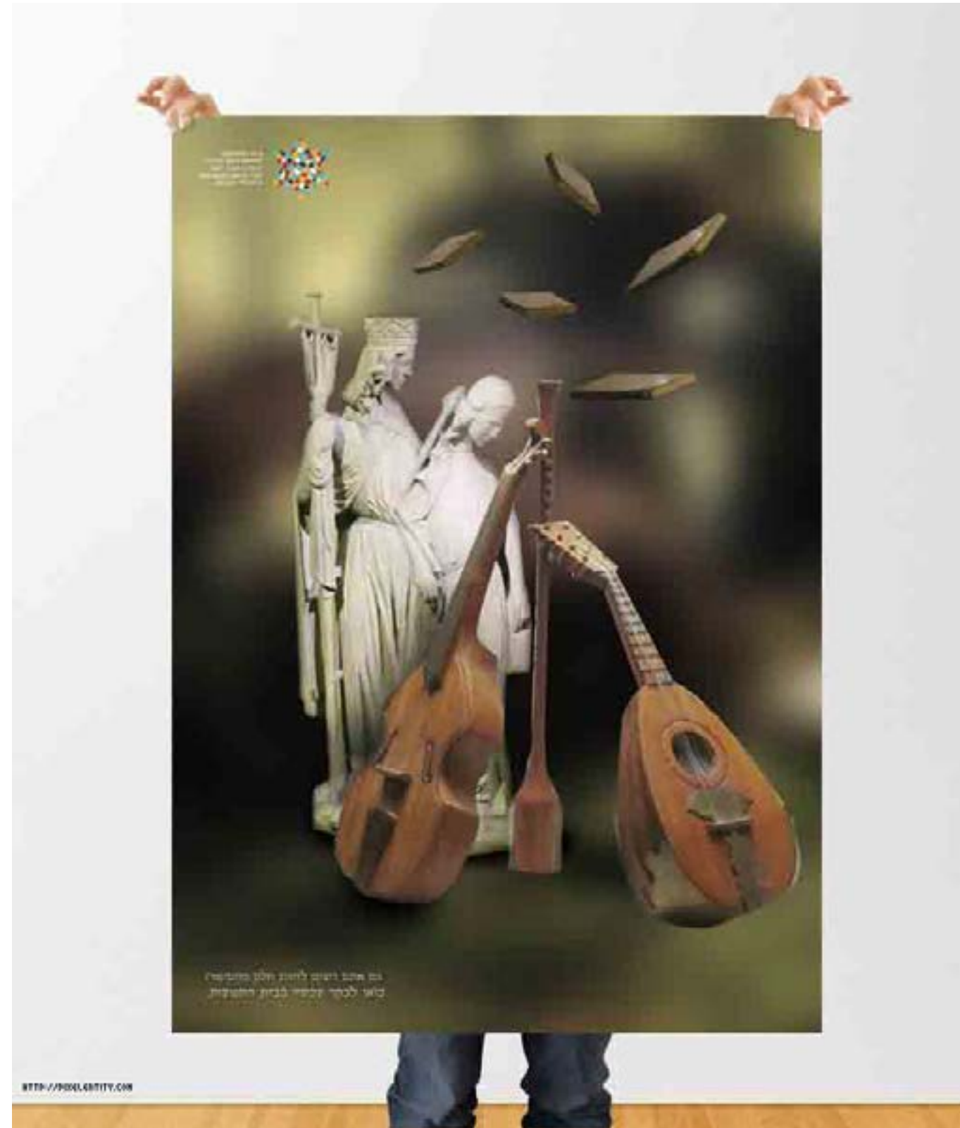
גם שנים רבות ליוזם חלם מנבטיה כאז לכתב ידיו בנות המשיח

פוטומונטאז' לבית התפוצות תוך שמוש בשכבות עריכה וקומפוזיציה מעניינת ליצירת מראה עתיק.