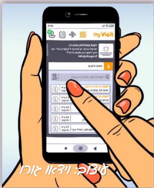
עצוב: וידאו גורו

תעודת הזהות הישראלית הינה מסמך רשמי שהמדינה מנפיקה לכל תושב ישראלי בהגיעו לגיל 16 לצורך זיהוי. עפ"י חוק, את התעודה יש לשאת באופן קבוע והיא כוללת תמונה ופרטי זיהוי כלליים. חשוב לזכור שכל שינוי בפרטים מחייב הוצאת ספח / תעודה חדשה. התעודה מהווה אמצעי זיהוי לקבלת מסמכים שונים כמו דרכון, קבלת שירותים ממוסדות ממשלתיים כגון הוצאת רישיון נהיגה וכן להצדהות בבנק, כניסה למקומות תרבות ובילוי ועוד.