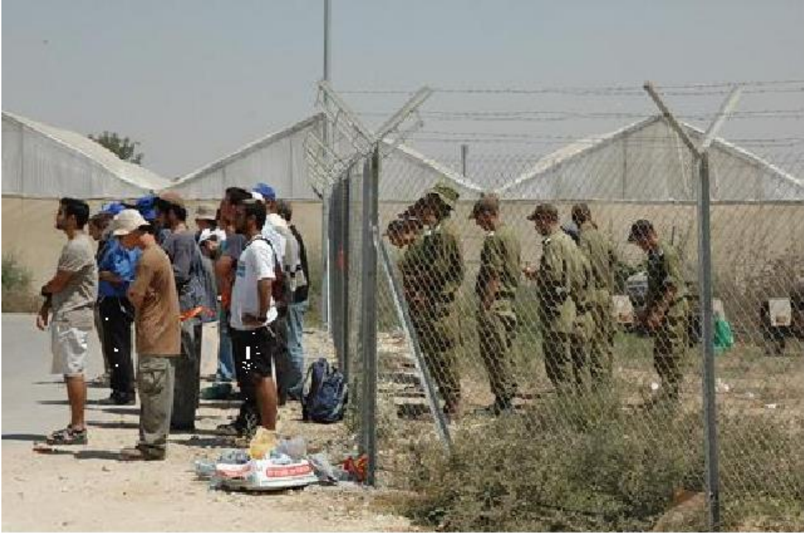
מתנחלים וחיילים בתפילה בזמן ההתנתקות (תשס"ה - 2005)

לכל שאלה אודות הערות אלו שלחו מייל לכתובת oldhebrewbooks@aol.com For any questions about these haarot, please email oldhebrewbooks@aol.com