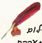
עט מלפ הפתח