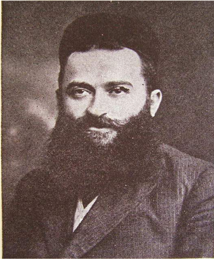
יוסל'ה רוזנבלט מיוחד עבור חוברת התווים שהוקדשה ליתומי המלחמה

דומה כי אין מתאים יותר מאשר להעניק את הבמה הזאת ל'מלך החזנים' שבכל הזמנים. ר' יוסל'ה רוזנבלט ז"ל. שיום פטירתו חל בימים אלו. הוא האיש שפתח את סידור התפילה בפני המון העם, והוא החזן שהשפיע יותר מכולם על עולם החזנות והשירה היהודית מימיו ועד עתה.