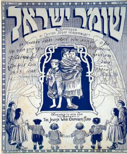
שאר החוברת עם ההקדשה לזכר האפרה פתח ידו יוסל'ה

בראש-חודש ניסן תרצ"ג יוסל'ה מגיע לביקורו המפורסם בארץ ישראל, עם אשתו ובנו הנרי, האוניה עוגנת בנמל חיפה, שם הוא פוגש מספר אנשים וידידים. ביניהם הוא פוגש את מר אריה פרידמן-לבוב, שהיה זמר אופרה ברוסיה ומחלוצי הזמרה העממית היהודית. לאחר עלייתו ארצה עסק בתחום המוזיקה והיה מחנך ועסקן ישראלי, מראשוני הזמרים ברמה אמנותית אירופית בארץ, מחלוצי הזמרה העברית העממית והשירה בציבור בארץ, מורה לזמרה ומנצח מקהלות בחיפה, ממייסדי המכון למוזיקה בחיפה וחבר הנהלתו וגיסו של דוד בן-גוריון. את האיש המרתק הזה פוגש יוסל'ה בחיפה, ומעניק לו את חוברת התווים של היצירה 'שומר ישראל' עם הקדשה אישית בכתב ידו המסולסל: "מתנה למזכרת עולם להמשורר הגדול והמפורסם מר פריעדמאן לוואו החונה עיה"ק חיפה יע"א. מאת המחבר יוסף ראזענבלאט. חיפה חודש ניסן תרצ"ג. ולמספרם אפריל 1933".