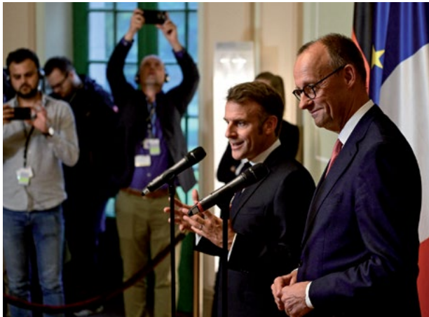
סיוע שיער לטורד ופרס לארגונים האסלאמיסטיים והאנטישמיים הקיצוניים. קנצלר גרמניה ונשיא צרפת בהצהרה

המצב בו מוריד את החוץ הצרפתי את סיכת החטופים הצהובה מדש בגדו ברמלה מחשש לתגובה פלסטינית, אבל מרשה לעצמו לעורר פרובוקציה נגד ישראל בהר חשש מכל תגובה הזיתים ללא שום חשש מכל תגובה ישראלית, אינו מצב שמדינת ישראל צריכה לקבל