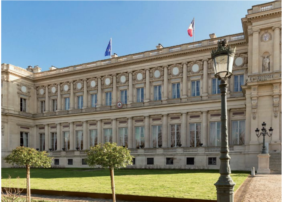
אנטישמיות מסורתית של מדינות החוץ הצרפתית ממנה הוא מושפע. משרד החוץ הצרפתי

סקר חדש בצרפת שפורסם רק לפני שבוע הראה, כי 78 אחוז מהנשאלים מתנגדים להחלטתו של מקרון. גורם נוסף רלוונטי הוא כמובן אישיותו הנרקסיסטית והיומרתית. ועדיין, יש לראות את הדברים גם בפרספקטיבה יותר רחבה