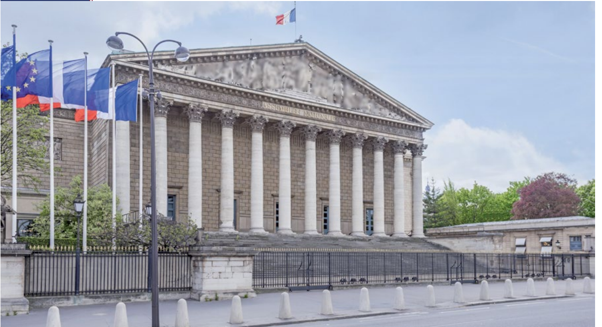
שפל חדש אליו הגיעה אחת המדינות המובילות באירופה. הפרלמנט הצרפתי נקי

ב-1926 הציעו הצרפתים חוקה ללבנון והכריזו על הקמת הרפובליקה של לבנון, ובאותה שנה נבחר נשיאה הראשון של לבנון, אולם כמו בסוריה התחזקו בלבנון הלכית הרוח הלאומיים אשר לא ראו בחוקה צעד מהותי לקראת עצמאות. במהלך מלחמת העולם השנייה נכבשה לבנון על ידי כוחות בריטניה וכוחות צרפת החופשית, ולאחר המלחמה הוכרזה עצמאותה של לבנון, וסמכויות השלטון במדינה