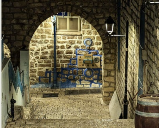
ומופעים לנשים, ירידי בין הזמנים לבחורי ישיבה, קומזיצים

"אני מודה לכל השותפים", מסכם ראש העיר קקון. "העיר צפת מוכיחה שוב, גם בקיץ, גם בבין הזמנים, שהיא קהילה אחת גדולה, מלאת חום, ערבות הדדית ומקום עם שפע תוכן וחוויות בין הזמנים".