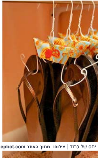
יחס של כבוד