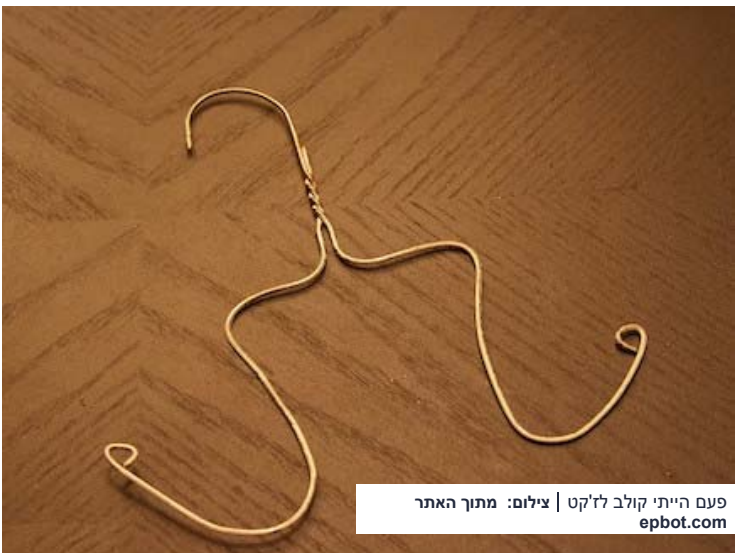
פעם הייתי קולב לז'קט