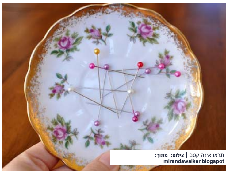
תראו איזה קסם

הטריק הממגנט שהוא חצי קסם, מתאים לאחסון מחטים וסיכות תפירה. אבל יכול לשמש גם כקישוט לשולחן המשרדי, וגם כבית מוגן לסיכות ולאטבים המפוזרים. כל מה שצריך זו צלחת, המשמשת כתחתית יפה ומעוטרת של ספל תה . מאחור מדביקים מגנטים קטנים והם ידאגו לשמור על כל מה שתשימו בצלחת. את הרעיון המקסים מצאנו ב- mirandawalkert