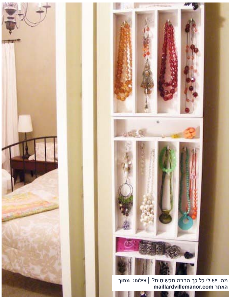
מה, יש לי כל כך הרבה תכשיטים?

שלם לאחסון התכשיטים בצורה חכמה ומרהיבה: קחו מגשי סכו"ם מעץ, מסמרו אותם לקיר ברצף והבריגו ברגי וו קטנים לתליית השרשרות והצמידים. מה קיבלתם? פינה מושלמת שמוסיפה גם אלמנט דקורטיבי לחדר. ב-maillardvillemanor המציאו את זה.