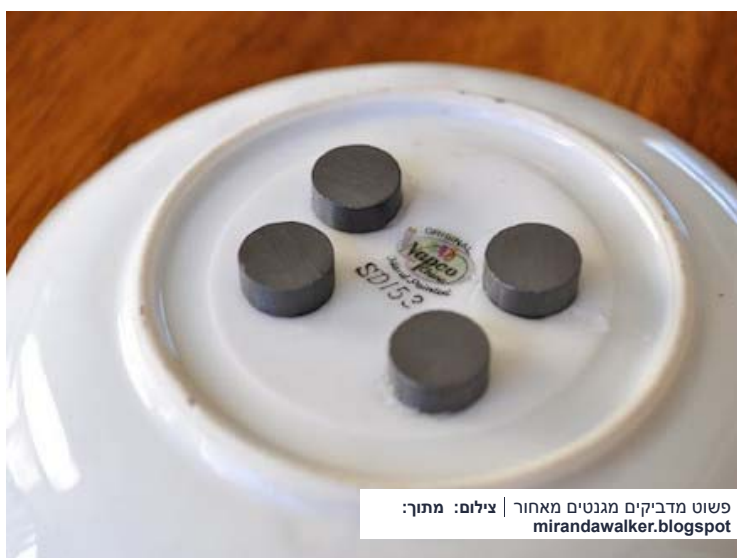
פשוט מדביקים מגנטים מאחור