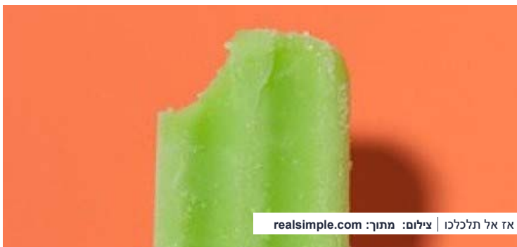
אז אל תלכלכו

החופש בשיאו, וההנאות הקטנות של הקיץ הן בדרך כלל המלכלכות ביותר. אבל למי יש לב להתחיל להציק לזאטוט שלו על הקרטיב המטפטף שבין כה וכה הכל כאן נמס גם ככה. אז במקום להעיר ולשבת דרוכים, פשוט השחילו מנז'ט על המקל' שיתפקד כמו מטרייה הפוכה וימנע טפטופים. ב- realsimple.com מצאנו את התגלית.