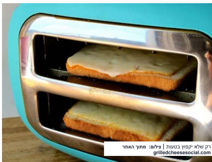
רק שלא יקפוז בטעות

רציתם להכין פיצה לילדים או טוסט על פרוסה אחת (GRILLED CHESSE) מבלי להפעיל את התנור? חשבתם לקנות טוסטר אבל אין לכם מקום לעוד מכשיר חשמלי? פשוט תשכיבו את המצנם על השיש, הכניסו את הפרוסות במאונך וצאו לדרך - כמה פשוט ככה טעים. את הפטנט מצאנו באתר: grilledcheesesocial .