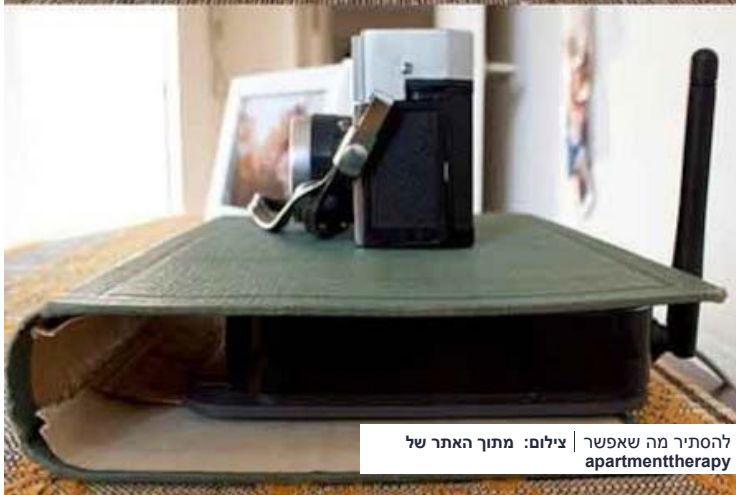
להסתיר מה שאפשר