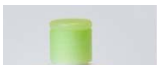
מתקן מונע התרסקות

בימים שבהם שקע פנוי ליד שולחן או שידה הוא מצרך נדיר וטריטוריאלי, כמעט כמו צד במיטה, מגיע הפטנט האדיר הזה, שגם מעלים את החוטים שנמתחים מכל עבר וגם מונע את אותם מצבים אובדניים, שבו המכשיר פשוט מתרסק אל הרצפה. כל מה שצריך זה בקבוק ריק של סבון או שמפו נוזלי ומספריים והרי לכם מתקן שימש כבית חם למכשיר הטלפון האהוב. למראה מעוצב יותר ניתן לצפות בנייר או טפט שאהבתם, או לצבוע בצבע אקרילי או בספרי צבע. באתר של makeit-loveit תוכלו לראות איך עושים את זה.