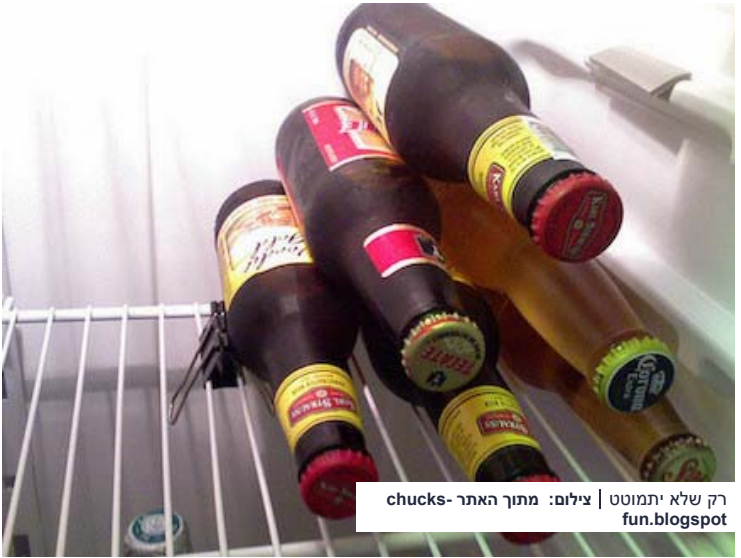
רק שלא יתמוטט