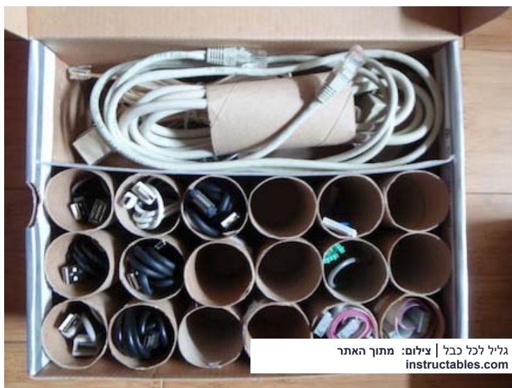
גליל לכל כבל

מכירים את מגירת הכבלים? בכל בית יש את מגירת הפלונטר שמכילה כבלים, מטענים, מאריכים וכל מיני חוטים שאגרתם אבל לא העזתם לזרוק למקרה ותצטרכו להשתמש בהם. בואו תסדרו את הצרה הזו אחת ולתמיד, בארגז שלעולם לא יתבלגן. פשוט הכניסו כל כבל בתוך גליל נייר טואלט, כשהקצוות שלו נגלים והניחו את הגלילים בתוך הארגז. ככה בדיוק עושים את זה: instructables .