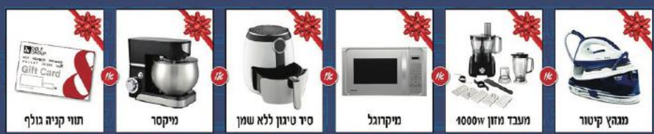
תווי קניה גולף