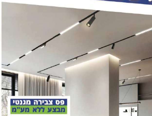
פס צבירה מגנטי מבצע ללא מע"מ