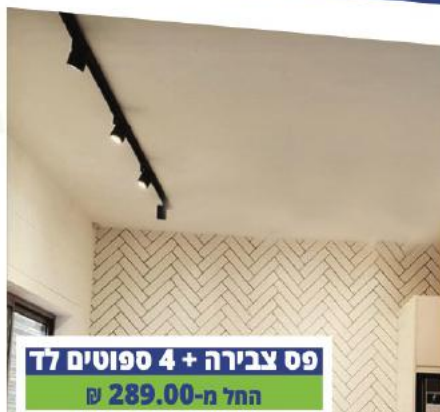
פס צבירה + 4 ספוטים לד החל מ-289.00 ₪