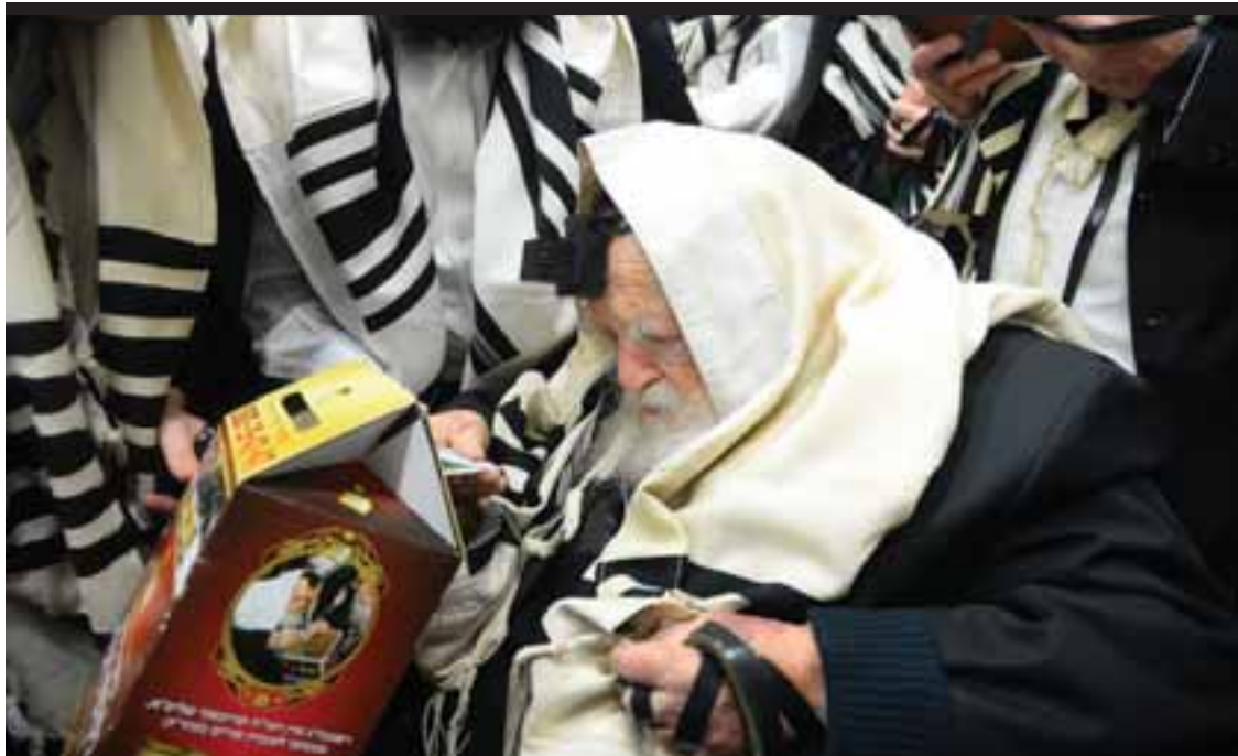
התמונה האחרונה - רשכבה"ג מרן שה"ת רבנו הגר"ח קניבסקי זצ"ל תורם לקופת העיר בפורים האחרון