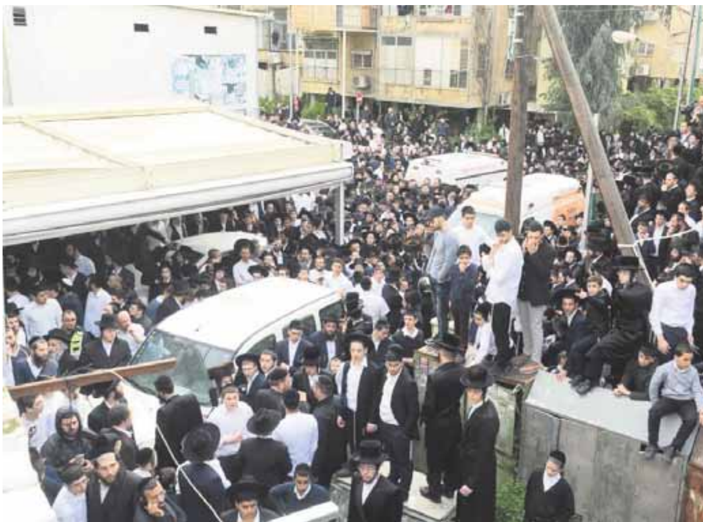
המונים למרגלות בית מן זצוק"ל ביום שישי.

הבית ברחוב רשב"ם היווה תל תלפיות בכל ימות השנה וביום הפורים, כאשר רבנות בני ישראל נכנסו להתברך, ברגע שנודע שמרן כבר הגביה את ראשו המונח בין דפי הגמרא משעות הבוקר המוקדמות - אחרי שחרית כוונתיקין ועד שעת מנחה. השנה נודע כי בעקבות חולשה גדולה של מרן יכנסו רק מעטים. בפורים דפרזים קיים מרן בחולשתו את מצוות היום קריאת המגילה ומתנות לאביונים ורק יחידים זכו להתברך. אך איש לא תיאר כי מאחורי הדלת ממתינה הגזירה הנוראה.