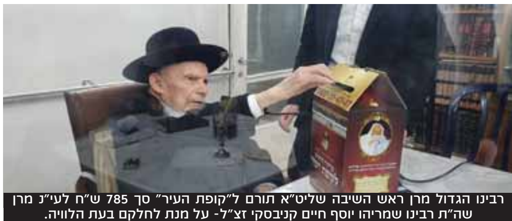
רבנו הגדול מרן ראש הישיבה שליט"א תורם לקופת העיר סך 785 ש"ח לעי"נ מרן שה"ת רבינו שמריהו יוסף חיים קניבסקי זצ"ל- על מנת לחלקם בעת הלוויה.