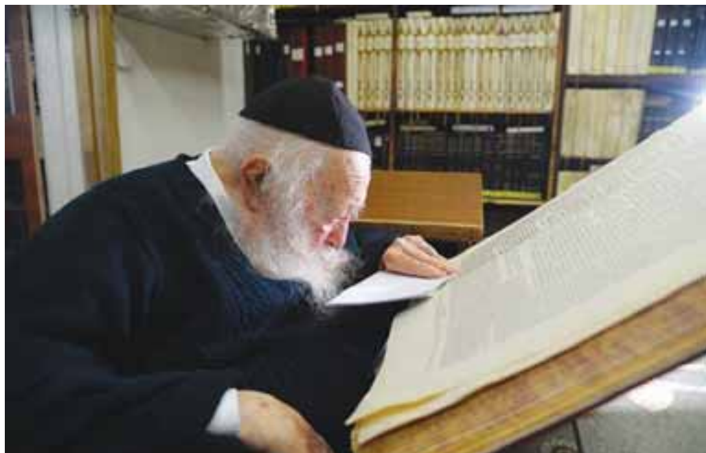
תורתו שהחזיקה את העולם

דקדוקו בהלכה היה אף הוא לשם דבר שלא מן הנמצא, כמי שרזי ההלכות נהירין לו כשבילי אורייתא, היה מחשב כל סדר יומו בכל דבר וענין אך ורק לפי ההלכה הצרופה, בתפילת הנץ החמה בשביעות מאז נישואיו, וכך במשך כל ימי