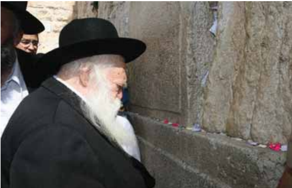
תפילתו שבקעה רקיעים

כאיש האלוקים, שדיבורו וברכותיו היו מתקיימות, ולכן אף נודע כבעל מופת מופלא שעוד חזון למועד לשמוע היקפם ועוצמתם שאינה ניתנים לתיאור.