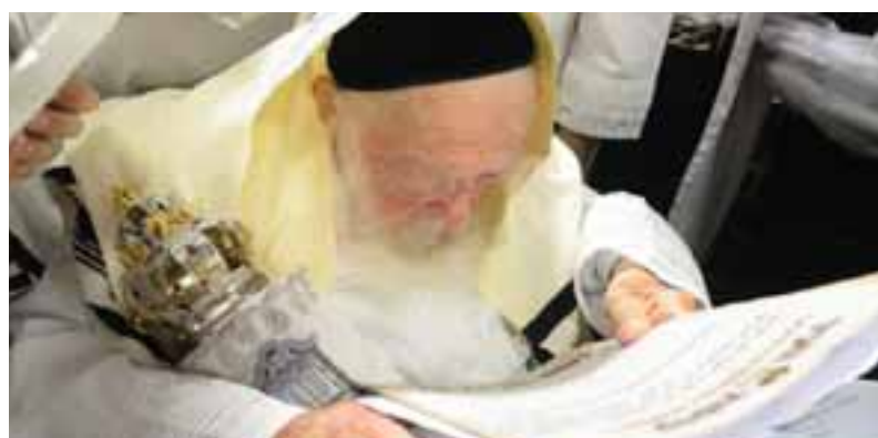
רשכבה"ג מרן שה"ת רבנו הגר"ח קניבסקי זצ"ל מעתיר על תורמי קופת העיר בכל נדרי השנה, עם ספר התורה בידו

יחד עם כל בית ישראל בכל רחבי תבל הושברנו בהלקח אדוננו מעל ראשו ופלאו, רבן של כל בני הגולה, האורים והתומים אשר אמרנו בצלו נחיה עד האש הקדוש והטהור ההולך לפני המחנה אשר כל בית ישראל נשען עלי אשר תשעים שנה יגע בתורה כ"ד שעות מעל"ע והיא היתה משוש חייו, באופן שנשגב מכל שכל אנוש, ולחבר ספרים בכל ענייני ומקצועות התורה ובהלכה לכל שואל קטן כגדול, תל תלפיות לרבבות בני ישראל בכל מקו מקויימת מלשכת הגזית, חרדו לראותו ולכל מוצא פיו, ולא עשו דבר קטון את משא כל בית ישראל כאשר ישא האומן את היונק, להיות להם למליץ יו בשעת שמחה, עמוד הצדק