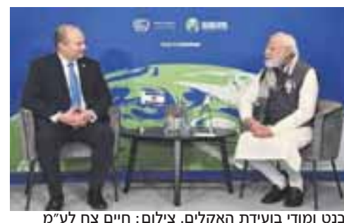
בנט ומודי בוועידת האקלים.

ראש הממשלה נפתלי בנט ייצא בקרוב לביקור רשמי ראשון בהודו בהזמנתו של ראש הממשלה נרנדרה רה מודי, כך נמסר מלשכתו, זאת על רקע 30 שנים לכינון היחסים בין שתי המדינות.