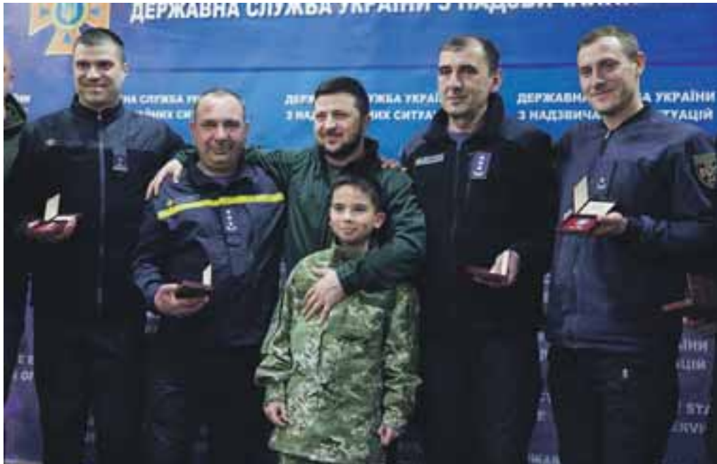
נשיא אוקראינה זלנסקי מעניק צל"שים לאנשי כוחות ההגנה האזרחית בקייב על הצלת חי"אדם תחת אש

נשיא אוקראינה, וולודימיר זלנסקי, אמר שהמצור על מריופול ייזכר בספרי ההיסטוריה בעקבות פשעי המלחמה שרוסיה ביצעה נגד תושביה. "מה שהכובשים עשו לעיר השלווה הזו הוא טרור, שייזכר מאות שנים", אמר. במקביל, הכריז הנשיא האוקראיני כי 11 מפלגות פוליטיות בארצו הושעו מכל פעילות בשל קשריהן עם רוסיה. המפלגה הגדולה ביותר היא מפלגת האופוזיציה OPZZh, המחזיקה ב-44 מושבים בפרלמנט, כמעט כחמישית מסך המושבים בפרלמנט האוקראיני.