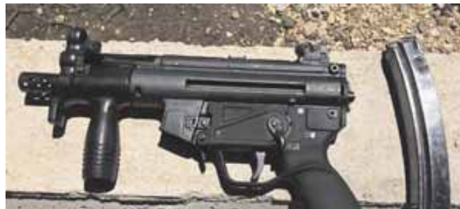
אמצעי הלחימה שנתפסו בידי החשודים וכן צילום הגבול (מימין)

■ הארבעה ביצעו הברחות נשק וכן העבירו מידע ביטחוני רגיש לארגון הטרור הלבנוני ■ במערכת הביטחון מזהים ניסיונות של חיזבאללה בהכוונת איראן לגייס ערבים ישראלים לפעילות טרור ■