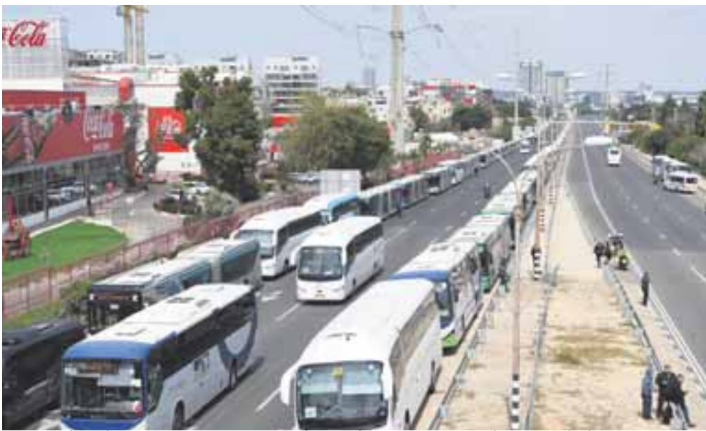
המדינה עצרה אתמול מלכת בשעת הלוויה. כביש 4 היה חסום לתנועת כלי רכב משעות הבוקר המוקדמות.

טרמינל ענק של תחבורה הופעל על כביש 4 ביציאה מבני ברק, אופנועני המשטרה פטרלו לאורכו ושמרו כי הציבור לא יכנס לנתיב התחבורה של האוטובוסים. ואלה מילאו נוסעים ויצאו לדרך.