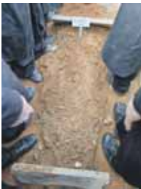
בוודאי רשכבה"ג מן שר התורה זצוק"ל יהיה מליץ יושר על הלומדים לעילוי נשמתו

ניתן להשתתף בלימודי 'שיח התורה' בטלמסר של מכוני 'שיח אמונה' 03-308-5000 בשלוחת 'שיח התורה' שלוחה 2, וכן בעמדות 'נדרים פלוס' בכפתור 'שיח התורה'.