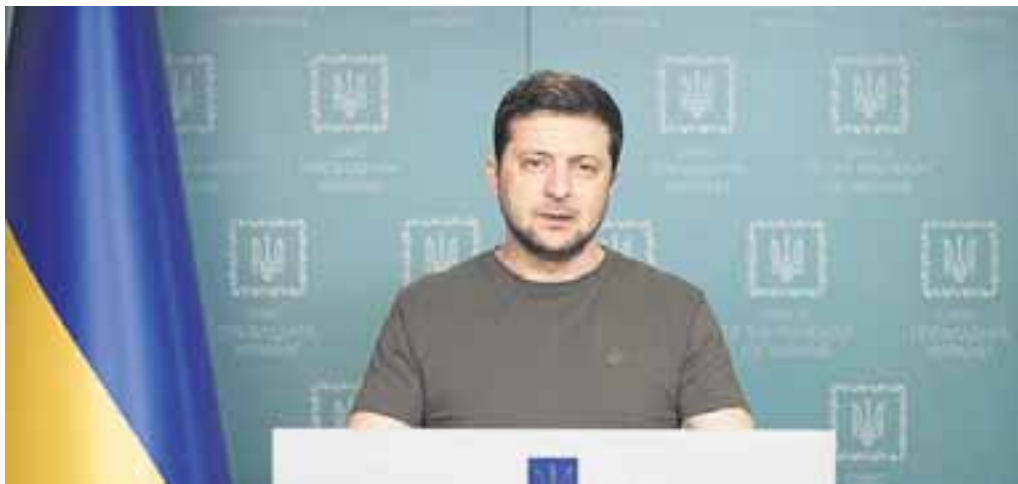
זלנסקי נואם אתמול מרחוק בפני הח"כים

אמר בתגובה כי "ליבנו עם העם האוקראיני, אבל הנשיא זלנסקי לא היה צריך לעשות את ההשוואה לשואה האיומה, ועוד מול הכנסת".