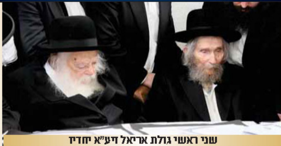
שני ראשי גולת אריאל דיע"א יחדיו

מפעלי תורה לע"ג רשכבה"ג מרן רבנו אהרן יהודה לייב שטיינמן זצוק"ל בהכוונת מרן רשכבה"ג רבנו חיים קניבסקי זצוק"ל ובנשיאות מרן הגר"ש שטיינמן שליט"א