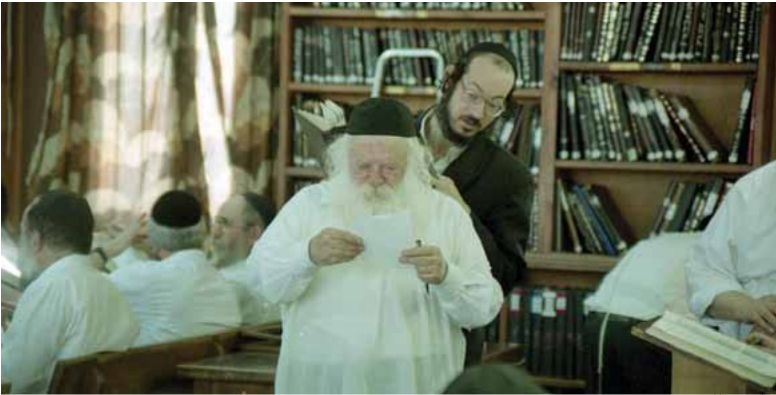
בלימוד בכולל חזון איש

כל טרדות הציבור המוטלות עליו, להתמצא בכל מרחבי ים התלמוד עד כדי זכירת מיקומו של סעיף קטן נידח אי שם באחד הפוסקים. הרים מרן ראש הישיבה את עינו והבהיר לשואל: 'ראית פעם בעל חנות גדולה, שיש בה מאות מדפים עמוסי סחורה, ובהם אלפים רבים של מוצרים, הוא מתמצא וזוכר בדיוק רב מה מונח בכל מדף ומדף, ומה מחירו המדויק של כל פריט. והתשובה לכך היא שזאת פרנסתו היחידה, וזה מה שעומד בראש מעייניו כל העת. כך, להבדיל, אצל מרן התורה היא הדבר היחיד שמעניין אותו, זה ה'עסק' שלו ומקור חיותו, ואיך ישכח ולו פרט קטן ממנה'. ועוד הוסיף בחיוך: "אני בקושי יודע מה קורה כאן בארץ, רבי חיים, יודע 'מה קורה בשמים'".