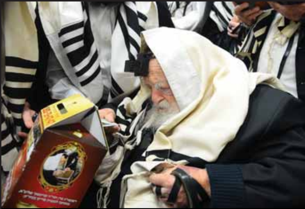
התמונה האחרונה - רשכבה"ג מרן שה"ת רבנו הגר"ח קניבסקי זצ"ל תורם לקופת העיר בפורים האחרון