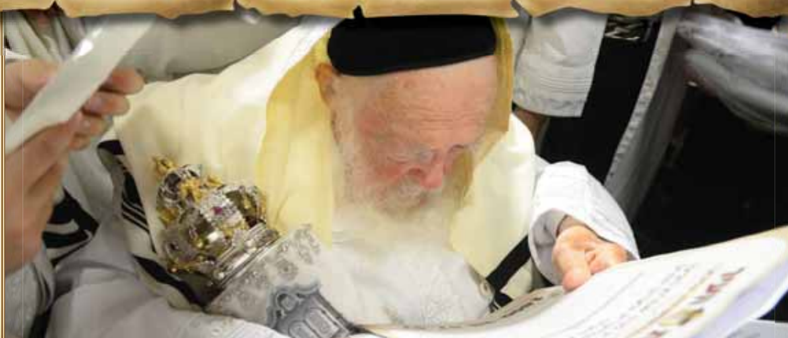
רשכבה"ג מרן שה"ת רבנו הגר"ח קניבסקי זצ"ל מעתיר על תורמי קופת העיר בכל נדרי השנה, עם ספר התורה בידו

על פי הוראת רבנו הגדול מרן ראש הישיבה הגר"ג אדלשטיין שליט"א -