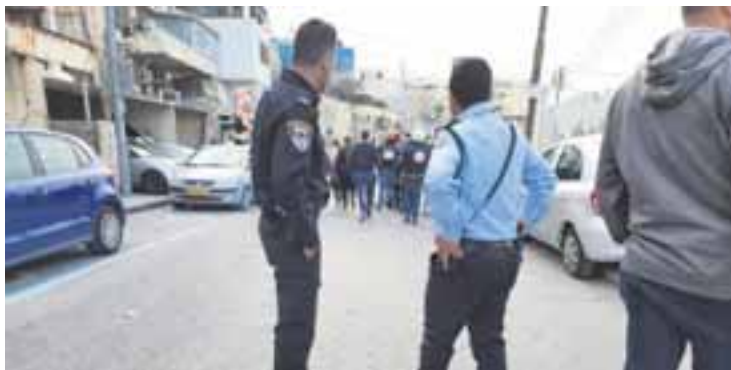
זירת הפיגוע בשכונת ראס אל עמוד.

■ מחבל ערבי דקר שוטר בשכונת ראס אל עמוד במזרח ירושלים ונמלט ■ כוחות משטרה רבים כולל יחידות מיוחדות ללוחמה בטרור נמצאים במקום ופתחו בסריקות לאיתור החשוד ■