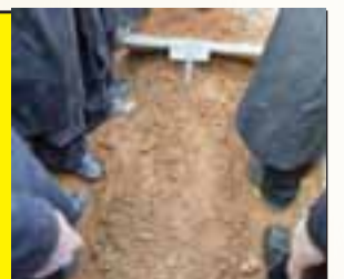
ציון קודש הקדשים זיע"א בבית החיים זכרון מאיר

שליח נאמן יעתיר במשך שנים עשר חדשים, יום יום על התורמים בציון מרן זצוקללה"ה כל שם ושם בפרטות, שימשיך להשפיע עליו משמי מעלה ולהיות לו למליץ יושר לפני בורא עולם, כאשר היתה באמנה אתו בחיים חיותו.