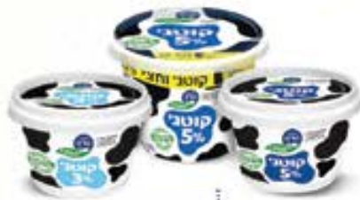
קוטג' של טרה

הסדרה היחידה מ-100% רכיבים טבעיים, ללא חומרים משמרים ובטעם נפלא