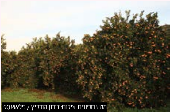
טטע תפחים.

נגד אחד החשודים הוגש בתחילת השנה כתב אישום בגין גניבת חצי טון אבוקדו ♦ באמצע ההליך המשפטי נעצר בחשד לגניבת התוצרת החקלאית