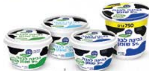
גבינה לבנה של טרה

הסדרה היחידה מ-100% רכיבים טבעיים וללא חומרים משמרים