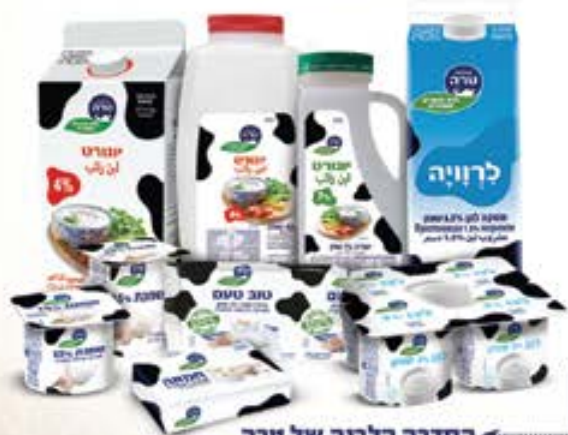
הסדרה הלבנה של טרה

הסדרה היחידה מ-100% רכיבים טבעיים וללא חומרים משמרים