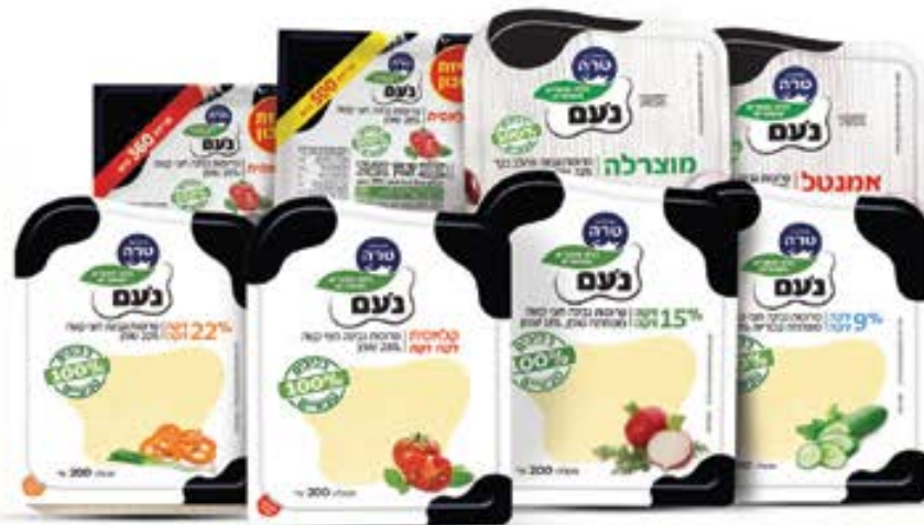
גבינה צהובה נעם

הסדרה היחידה מ-100% רכיבים טבעיים, ללא חומרים משמרים ובטעם נפלא