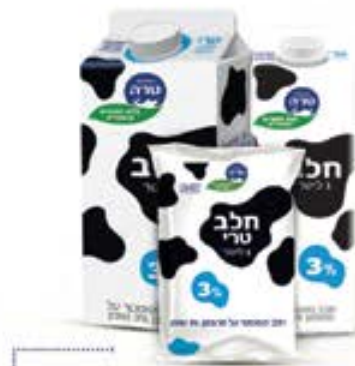
חלב של טרה