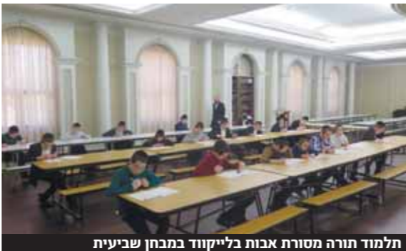
תלמוד תורה מסורת אבות בלייקוד במבחן שביעית