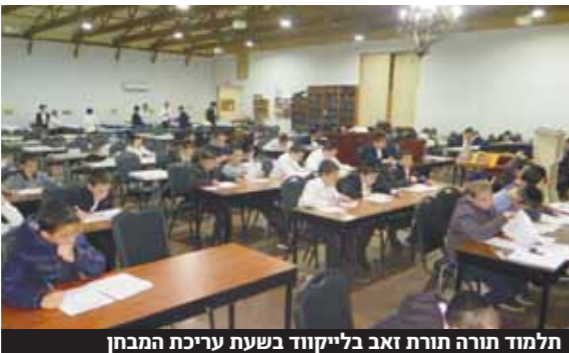
תלמוד תורה תורת זאב בלייקוד בשעת עריכת המבחן