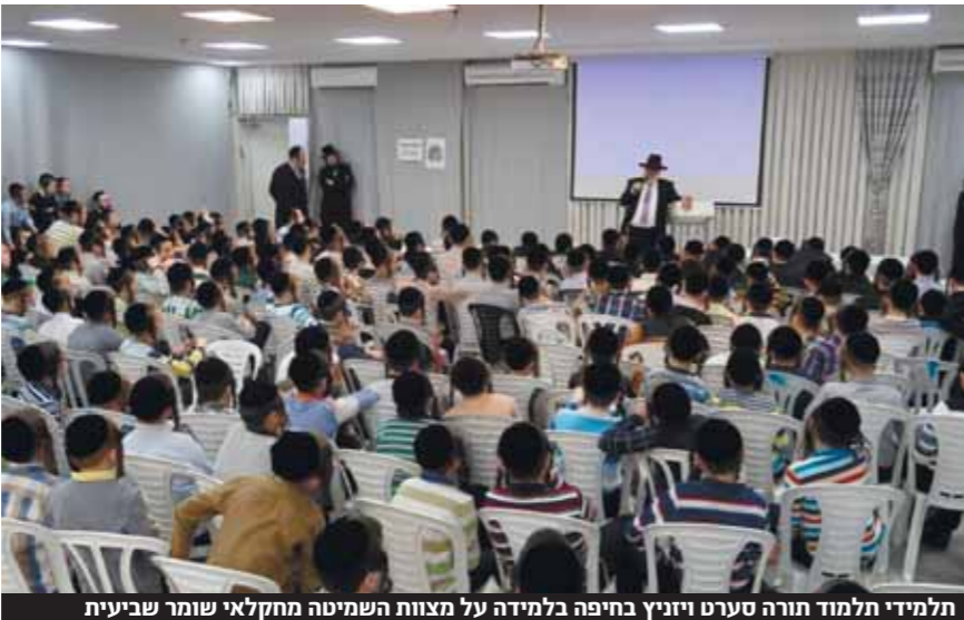
תלמידי תלמוד תורה טעירו ויניץ בחיפה בלימדה על מצוות השמיטה מחקלאי שומר שביעית

מבחן אחד תלוי בעמיתו, אבל, בעל התלמידים החדשים, כאמור, להירשם בחליך המקובל, ולוודא שפטייהם הונו ונרשמו במערכת.