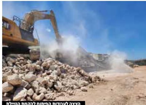
הצצה לעבודות הפיתוח לתקמת הטיילת

פיתוח < טיילת חתם סופר עולה ופורחת. התחילו בהקמת מעקה הגדר ובריצוף המדרכה החיצונית. ברוך השם כבר רואים את ההתקדמות בעיניים, ולמרות העיכובים המסוימים - במועצה רצים קדימה. במקביל הציר הבטחוני מתקדם יפה, וכבר התחילו להדק שכבה ראשונה לקראת סלילת אספלט בשבועות הקרובים.