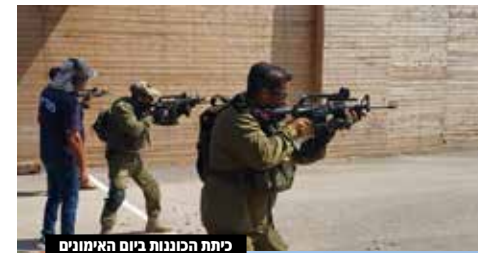
כיתת הכוננות ביום האימונים