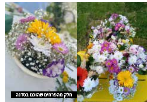
חלק מהפרחים שהוכנו בסדנה