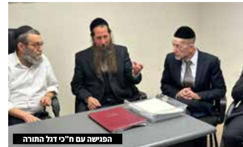
הפגישה עם ח"כ דגל התורה