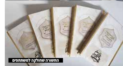
התשורה שחולקה למשתתפים

ניקיון < המועצה הביאה צוות שטיפת פחים לפני חג השבועות, לרענן את מראה היישוב ולנקות את הפחים שמראיהם בולט במרחב הציבורי. הצוות ביצע עבודה טובה ועבר על כל הפחים לשביעות רצון.