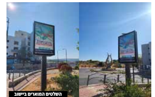
השלטים המוארים ביישוב

שילוט < החברה הכלכלית השלימה את התקנת שלטי הפרסום ברחבי היישוב, עם התקנת השלט המואר ברחוב חתם סופר מול נתיב החסד והשלט המואר בכיכר דוד המלך. בעזרת השם הצעד יניב רווח כלכלי נאה לחברה - דבר שבסופו של יום יגיע לתושבים כולם, שיהנו מכך בשלל פרויקטים חשובים.