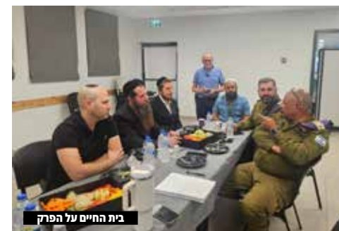
בית החיים על הפרק