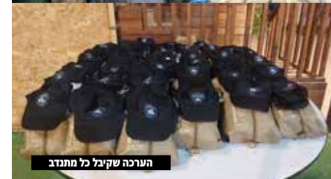
הערכה שקיבל כל מתנדב