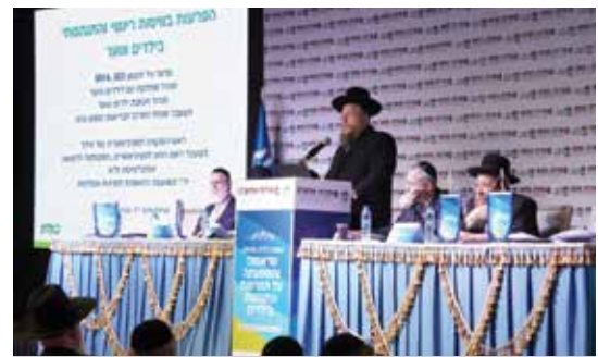
פרופ' גיל זלצמן עם הרב אברהם קונסקי בוועידת החינוך

4 יציירת מחויבות ושיח תומאם לילדים להורים ישנה חשיבות משמעותית ליצור מחויבות כלפי הילדים, להרגיע אותם ולשרד להם תחושה של ביטחון: "אנחנו כאן, כדי להיות איתכם, לשמור עליכם ולהגן עליכם בעזרת ד". מותר להורים להביע דאגה, אך חשוב שלא לשתף את