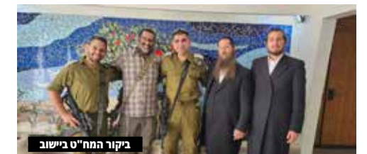
ביקור המח"ט ביישוב

עוד ביטחון < מח"ט חטיבת אפרים, אל"מ פאיון פארס, שבימים אלה נכנס לתפקידו הבכיר בצה"ל, הגיע לסיור היכרות חשוב ביישוב. נציגי המועצה סקרו בפניו את היישוב והתפתחותו ואת הפערים הביטחוניים הקיימים, בצד ההתקדמות הגדולה בחיזוק המערכים בשנים האחרונות. בס"ד הוא גילה אוזן קשבת ורצון לסייע. המח"ט שיבח את קב"ט היישוב המסור על עבודתו המעולה, ובמועצה מצאו הזדמנות טובה להביע בפני המח"ט הערכה על גבורתו העילאית בטבח שמחת תורה תשפ"ד. יש עם מי לעבוד.