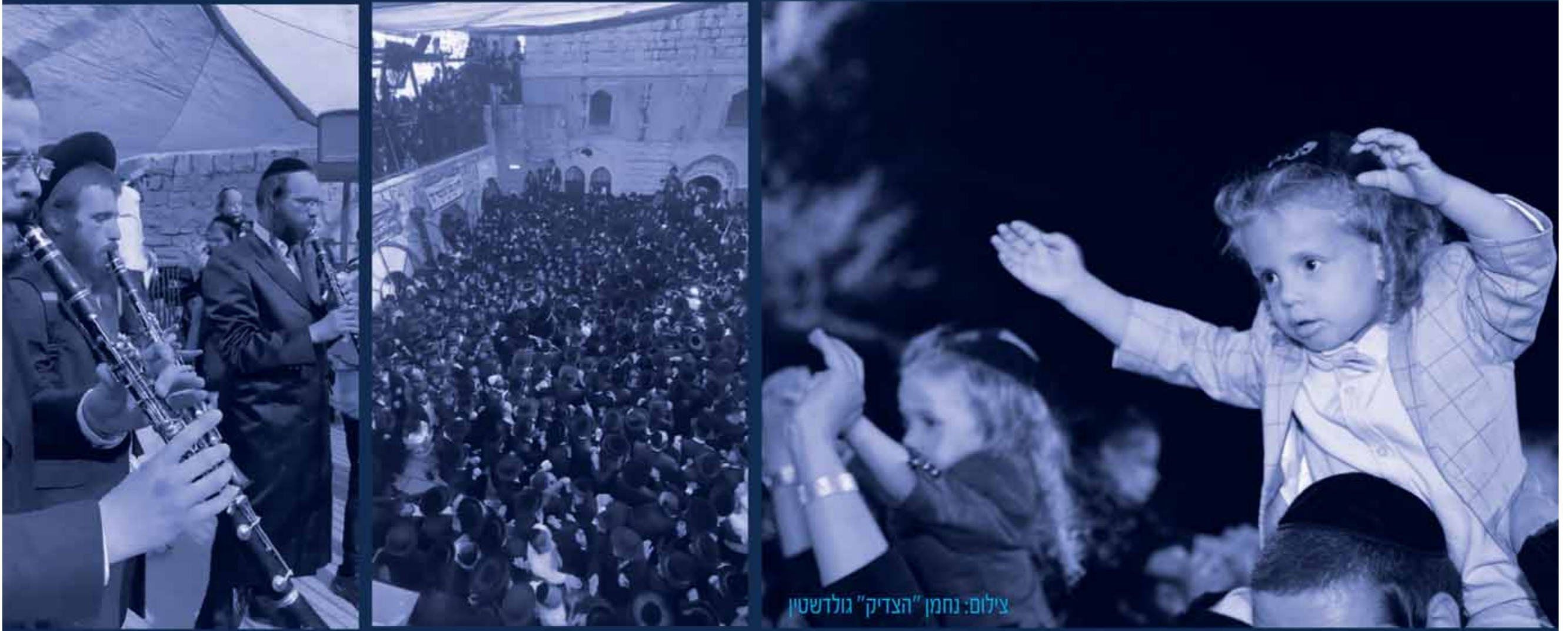
צילום: נחמן "הצדיק" גולדשטיין