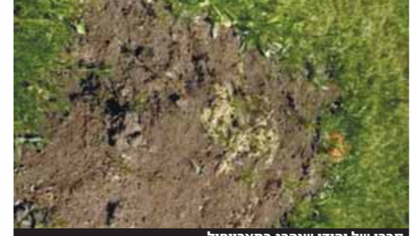
קברו של יהודי שנהרג במאריפול ובלית ברירה נקבר על ידי בני משפחתו בפארק ציבורי בעיר

מאת א. למל שלשה חודשים חלפו מאז פרוץ המלחמה באוקראינה והסוף לא נראה באופק. בפדרציות הקהילות היהודיות באוקראינה הוחלט אתמול כי כל משפחה של הרוג יהודי תקבל מלגת קיום חר' דשית קבועה בסך 12,000 גריבנה למשך שנה, זאת נוסף לסלי מזון ועזרה נוספת. 12,000 גריבנה הם סכום השווה למשכורת חודשית ממוצעת באוקראינה והמלגות יועברו בהתאם לרשימות שיע' ביורובני הערים - שלוחי חב"ד. במקביל, יהודים המתגוררים