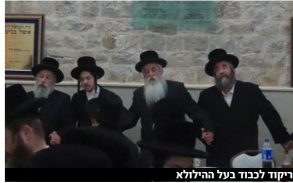
ריקוד לכבוד בעל הילולא