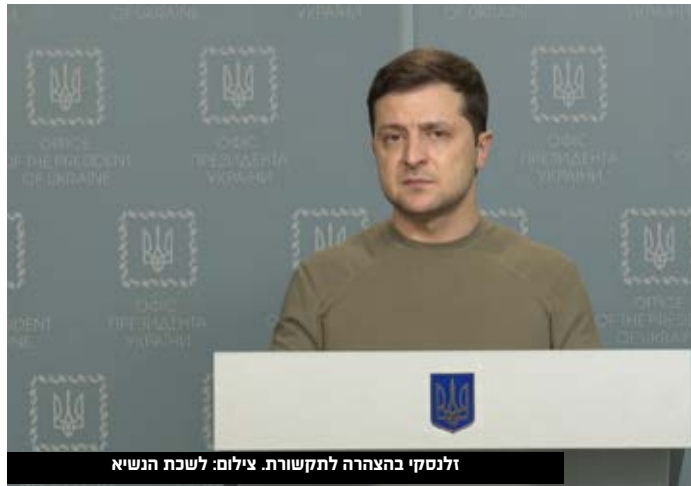
זלנסקי בהצהרה לתקשורת.

21:40 - משרד הבריאות האוקראיני מדווח כי נהרגו 57 בני אדם ו-169 נוספים נפצעו. 21:41 - משרד האוצר האמריקאי מטיל סנקציות על בנקים בלארוסים, על תעשיית הביטחון ובכירים במשרד ההגנה במדינה, בעקבות התמיכה הבלארוסית בפלישה הרוסית לאוקראינה. 21:42 - שר החוץ הצרפתי, לה דריאן באיום מרומז לרוסיה: "פוטין צריך להבין שגם נאט"ו היא ברית גרעינית". 21:43 - ראש ממשלת לטביה, ארתורס קרישיאנס קרינש, אמר לפני פגישת המנהיגים של האיחוד האירופי כי "האיחוד חייב להטיל סנקציות שיבודדו את פוטין ומשטרו משאר העולם". לדבריו, "אנחנו צריכים להבהיר לפוטין שזה לא מתקבל על הדעת. הוא נלחם נגד הדמוקרטיה, ואם הוא יכול לתקוף את אוקראינה, תיאורטית הוא יכול לתקוף כל מדינה אחרת". 21:46 - אוקראינה ביקשה לקיים דיון דחוף במועצת זכויות האדם של האו"ם בעקבות "התוקפנות הרוסית" בשטחה. "זו צריכה להיות התגובה להידרדרות החמורה ביותר במצב זכויות האדם באוקראינה כתוצאה מפעולות האיבה של רוסיה בשטחנו", אמרה שגרירת אוקראינה באו"ם. 22:08 - אוקראינה מדווחת כי כוחותיה הצליחו להשתלט מחדש על מספר שטחים ולהדוף משם את כוחות צבא רוסיה. 22:11 - שר ההגנה האוקראיני אמר כי הוא צופה גל נוסף של תקיפות מצד רוסיה, בהן תקיפות מהאוויר. 22:12 - שר החוץ של אוקראינה דמיטרו קולבה שוחח עם מקבילו האמריקאי, מזכיר המדינה אנתוני בלינקן. הוא אמר כי הם דנו בתוכניות לשלוח "נשק הגנתי חדש שיעזור לאוקראינה להגן על עצמה". לדבריו, "אוקראינה מחזיקה בקרקע, אך אנחנו צריכים שהעולם יעזור לנו".