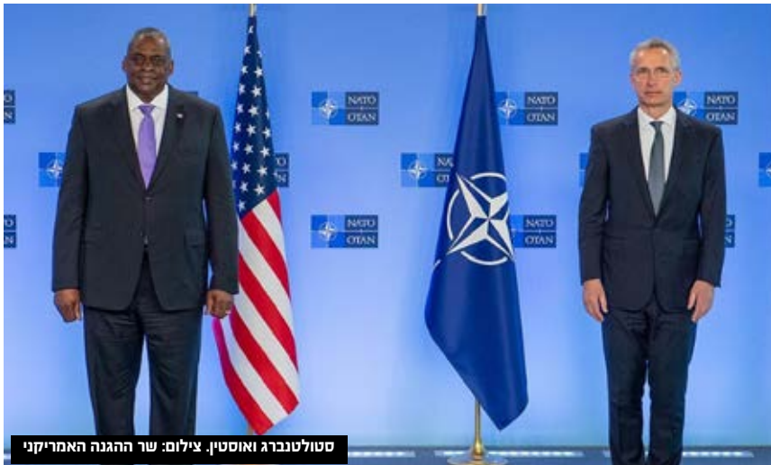
סטולטנברג ואוסטין.

ביידן שוחח עם זלנסקי, כפי שכבר עשה עשרות פעמים לאחרונה, ואמר כי ארה"ב עומדת לצד אוקראינה ותשלח לה סיוע צבאי נוסף