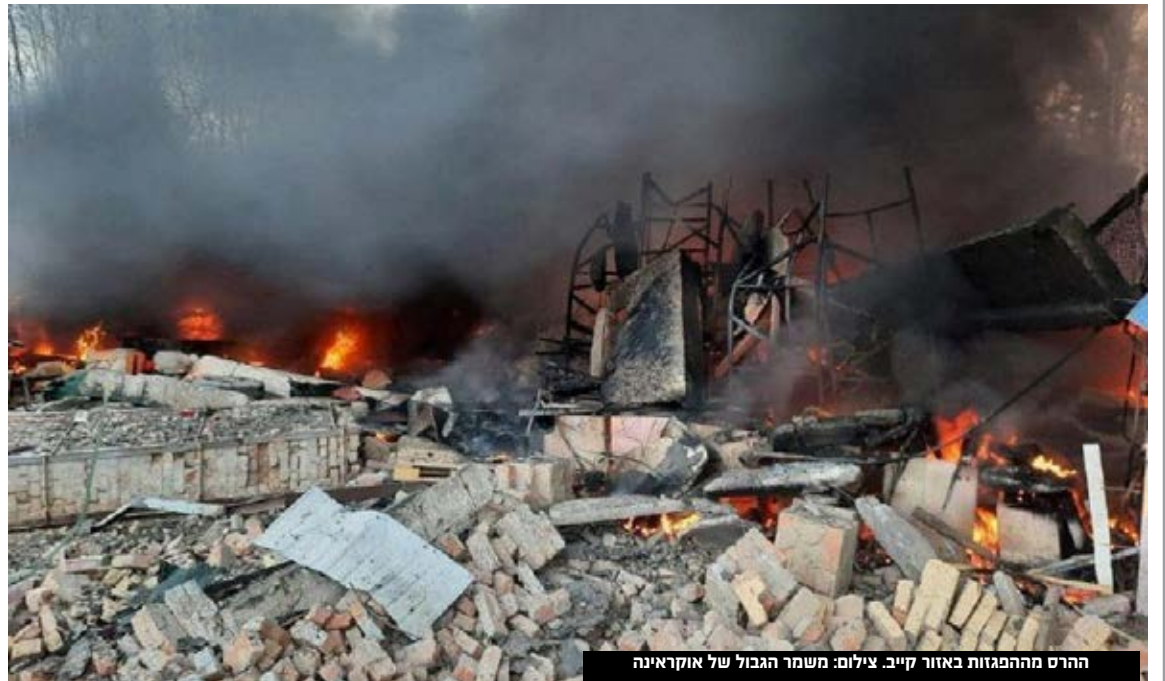
הרס מההפגזות באזור קייב.

08:41 - גורם אוקראיני בכיר טוען כי מאות חיילים אוקראינים נהרגו במתקפה הרוסית במהלך הלילה.