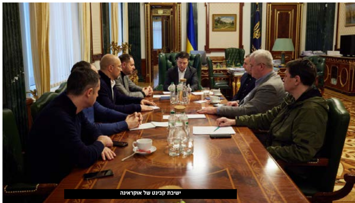
ישיבת קבינט של אוקראינה