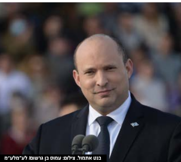
בנט אתמול.