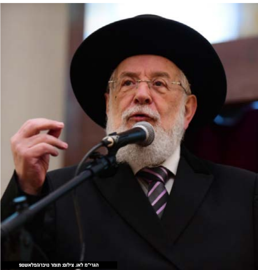
הגר"מ לאו.

מרבית בשמחה. אמר רב פפא: לפיכך יהודי שיש לו דין עם גוי, ישתמש ממנו בחודש אב שרע מזלו ויפגוש בו בחודש אדר שמזלו טוב".