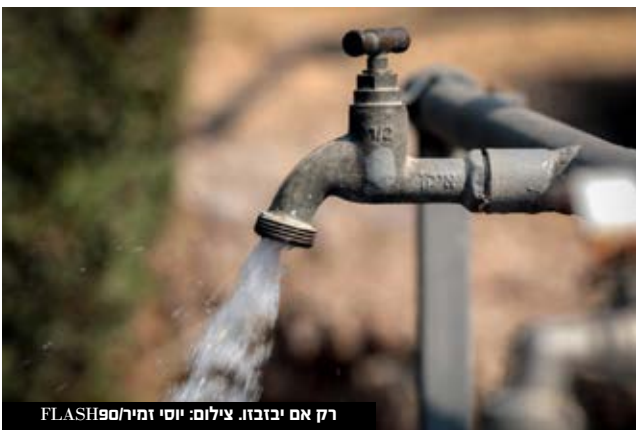
רק אם יבזבו.

"בוועדת הכספים הוצע להעניק הנחה מהמ"ק הראשון שהזכאי צורך, בדומה לנעשה בחשבון החשמל. רשות המים העבירה ב-2017 הצעת תקנות, אך עד היום משרד האוצר לא פעל בנושא. למרות עלייה באיתור שיעור הזכאים, עדיין 80 אלף איש לא אותרו נכון לדצמבר 2020... המבקר הציע לפנות לרשויות הרווחה לשם כך. בנוסף מעוטי יכולת שלפני גיל פרישה לא נכללים בהטבה, ממליצים להכליל".