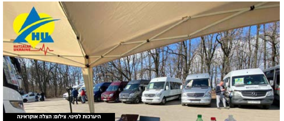
היערכות לפינוי.