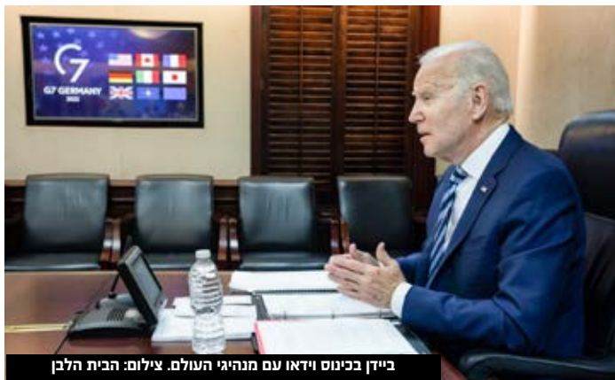
ביידן בכינוס וידאו עם מנהיגי העולם.

"פוטין גורם לעם האוקראיני סבל רב, אבל האוקראינים לא יוותרו על החופש שלהם", אמר ביידן. "כל העולם רואה מי זה פוטין, כולם רואים שפוטין רוצה אימפריה. המציאות של פוטין עצובה, הוא מאמין בכוח, ארה"ב ובנות בריתה קוצות חופש והתוקפנות הזו תעלה לו ביוקר. התוקפנות הזו תהפוך את העולם חזק יותר ואת פוטין חלש יותר".