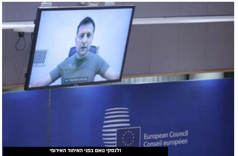
זלנסקי נואם בפני האיחוד האירופי

10:30 - פוטין שוחח עם נשיא בלארוס אלכסנדר לוקשנקו: "מטרת המבצע - הפסקת רצח העם בדונייצק ולוגאנסק". 10:34 - פעילת האופוזיציה הרוסית מרינה ליטבינוביץ' קראה לקיים הפגנות "נגד המלחמה" בערים רוסיות, לאחר המבצע הצבאי הנרחב שבו פתחה מוסקבה באוקראינה. 10:38 - עיריית אומן הודיעה שאדם אחד נהרג בשטחה מנפילה של פגז רוסים. 10:40 - נשיא בלארוס, אלכסנדר לוקשנקו, הכחיש את הדיווחים של משמר הגבול האוקראיני על השתתפות של כוחות בלארוסיים בלחימה באוקראינה. עם זאת, הוא הבהיר שחייליו יהיו זמינים אם יהיה בכך צורך. 10:45 - נשיא ליטא הכריז על מצב חירום במדינה בשל הפלישה הרוסית 10:46 - התקשורת הממלכתית ברוסיה משבחת את "המבצע הצבאי" באוקראינה, וכינתה אותו "התערבות צבאית בדונבאס". כמו כן, כלי התקשורת במוסקבה בחרו להתעלם מהתקפות הטילים על התשתיות ועל הערים ברחבי אוקראינה. לדוגמה, ערוץ החדשות "רוסיה-24" דיווח ש"הניאו-לאומנים האוקראינים מחכים לרגע הנכון להכות ברוסיה". 10:56 - אזעקות גם בפולין - אזעקות נשמעו בעיירה הפולנית מדיקה, שנמצאת על הגבול עם אוקראינה. 11:10 - נשיא המדינה יצחק הרצוג ביוון: "זהו ללא ספק רגע היסטורי מורכב מאוד. גם אני חש הבוקר עצב רב וחושש לטרגדיה הומניטרית. אני מתפלל כמו רבים בכל העולם שהשלוש יחזור לאוקראינה ורוסיה. ישראל, כפי שנמסר על ידי ממשלתנו, תומכת בשלמות הטריטוריאלית של אוקראינה". (ראה ידיעה מורחבת על ההתייחסות הישראלית). 11:11 - מנהיג האופוזיציה הרוסי, נבלני, בהודעה מהכלא: "מתנגד למלחמה, נועדה להסיט את תשומת הלב מהבעיות האמיתיות של רוסיה, יהיו הרבה קורבנות מיותרים" 11:13 - גורם בארמון הנשיאותי באוקראינה