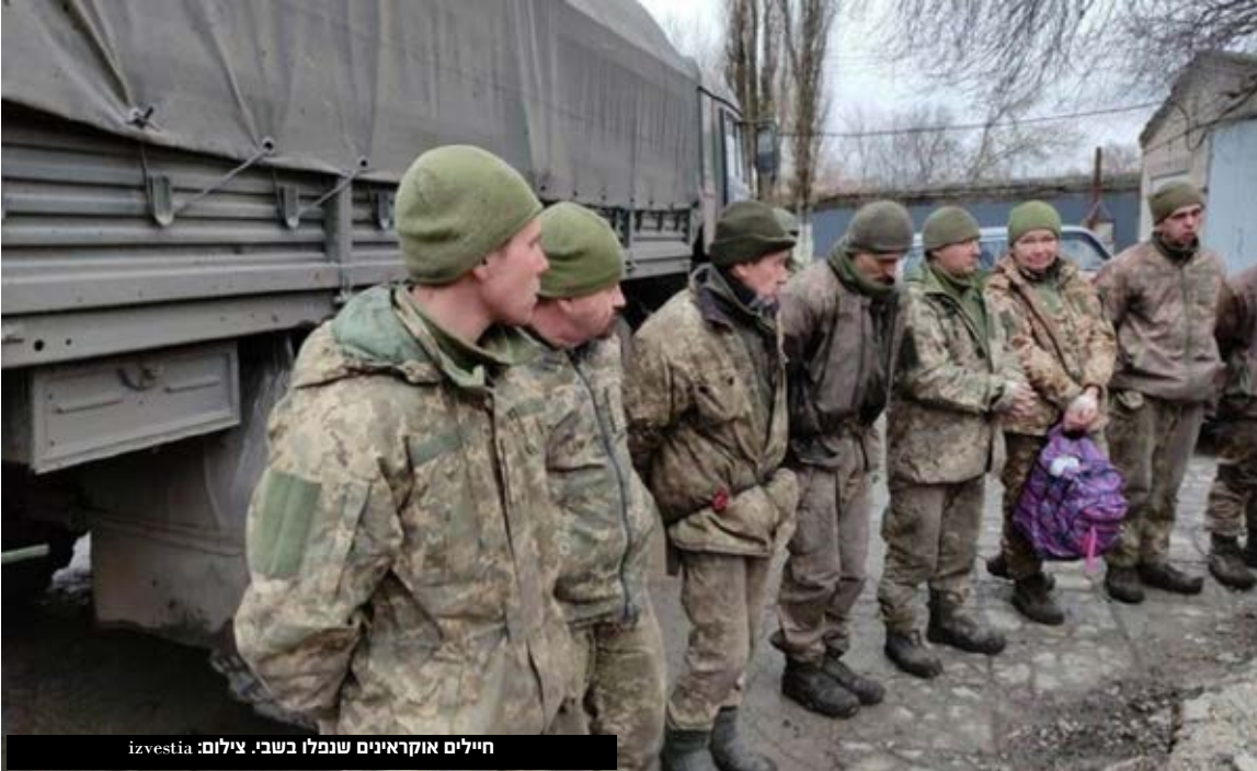
חיילים אוקראינים שנפלו בשבי.

07:47 - בהודעה שפרסם הצבא האוקראיני נמסר כי ההתקפה