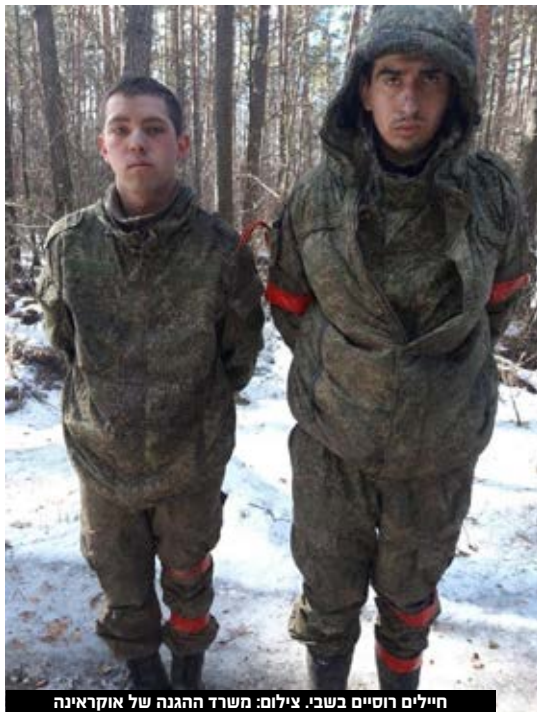
חיילים רוסיים בשב.

17:40 - משרד הפנים האוקראיני דיווח על "עלייה בתנועה" בגבולה המערבי של אוקראינה. בהודעת המשרד צוין כי "המצב במחסומים נותר יציב ולא התפתחו עימותים". 17:45 - גורם בכיר במשרד הגנה האמריקאי אמר כי וושינגטון מאמינה שהפלישה של רוסיה נועדה "לערוף את ראשה" של ממשלת אוקראינה. לדבריו, "אחד משלושת צירי התקיפה העיקריים מופנה לעיר הבירה קייב". הוא העריך כי הרוסים מעוניינים "לקיים באוקראינה שיחת ממשל משלהם". 17:52 - זלנסקי: "מה ששמענו היום אלה לא רק פיצוצים, לחימה ורחש של מטוסים. זהו קולו של מסך ברזל חדש, שירד וסוגר את רוסיה. המשימה הלאומית שלנו היא לוודא שהמסך הזה לא יפול על פני ארצנו". 17:53 - גורם רשמי בארצות הברית: רוסיה פלשה קרקעית מבלארוס לצפון-מערב קייב. 18:00 - סגן הקנצלר הגרמני רוברט האבק אמר שמדינתו לא תספק נשק לאוקראינה. 18:02 - אתרי האינטרנט של נשיא רוסיה ולדימיר פוטיין, הקרמלין, ממשלת רוסיה ואתרי ממשלה נוספים נפלו ולא היו זמינים לסירוגין למשתמשים ברוסיה ובקזחסטן. 18:06 - בכיר אמריקאי מאשר: כוחות צבא שפלשו לאוקראינה מבלארוס נעים לכיוון קייב. משרד ההגנה באוקראינה מזהיר מפני הנחתת כוחות בבירה קייב והשתלטות על מוסדות שלטון.