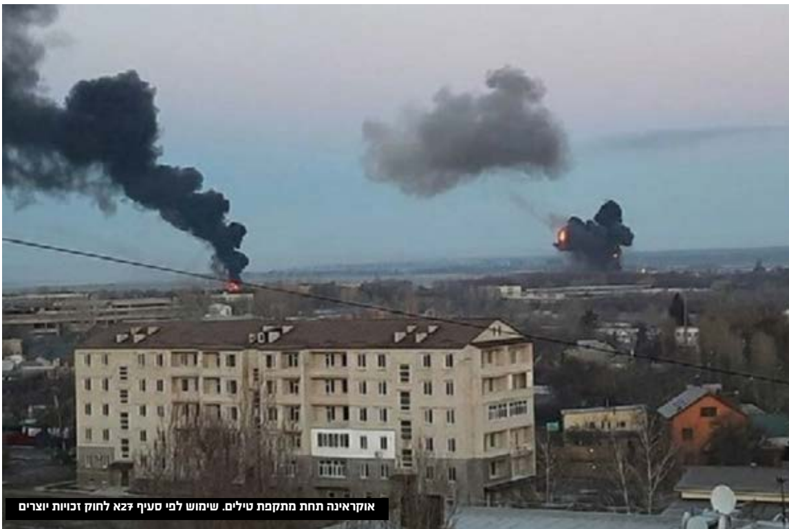
אוקראינה תחת מתקפת טילים. שימוש לפי סעיף 72א לחוק זכויות יוצרים