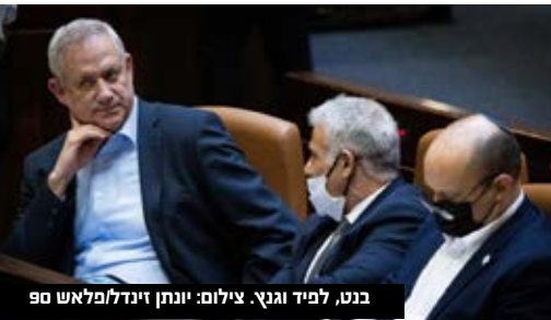
בנט, לפיד וגנץ.

את המצב הנוכחי לתחילת סוף הקדנציה הקודמת בממשלת נתניהו-גנץ, ואמרו כי ברגע שהכנסת מתחילה להיות לעומתית ולא מגובשת אחרי הממשלה, ההתפוררות עשויה להיות מהירה. בישיבת הסיעה של כחול לבן ביום שני אמר גנץ: "צר לי שגורמים פוליטיים ופופוליסטיים, חלקם פוסט-ציונים ממש, החליטו לפגוע בביטחון המדינה במודע, בחיילי החובה, במשרתי הקבע ובאנשי המילואים ששומרים על המדינה, והם יותר חשובים למאבק באיראן לא פחות מכל מטוס או מערכת מתוחכמת. אי אפשר שפעם אחר פעם הקצוות ימשכו את המרכז בממשלה. מי שלא מצביע בעד החלטות הממשלה מסכן את המשך קיומה".