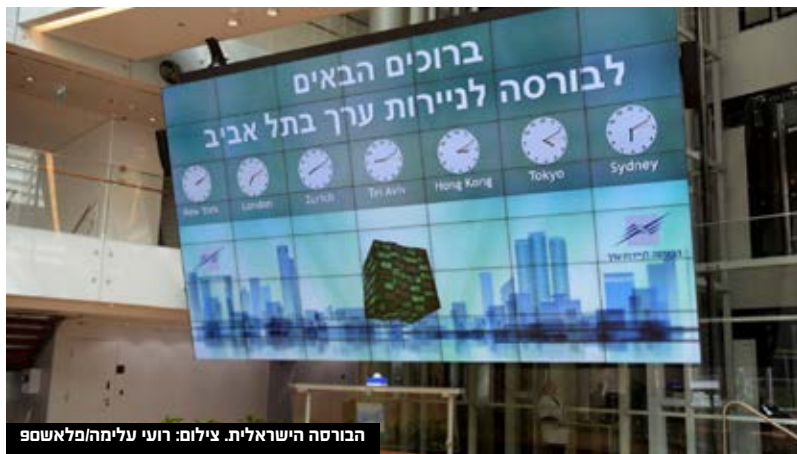
הבורסה הישראלית.