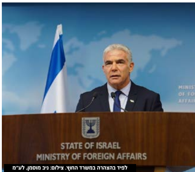
לפיד בהצהרה במשרד החוץ.

שר החוץ יאיר לפיד אמר בהצהרה לתקשורת שקיים בעקבות ההתקפה הרוסית על אוקראינה, כי "ההתקפה הרוסית על אוקראינה היא הפרה חמורה של הסדר הבינלאומי, ישראל מגנה את ההתקפה, מוכנה ונערכת לסייע הומניטרית לאזרחי אוקראינה. ישראל היא מדינה למודת מלחמות, מלחמה אינה הדרך לפתור סכסוכים". לדבריו, "השעות והימים הראשונים של כל מלחמה, הם גם הזמן האחרון שבו אפשר עדיין לעזור. לחזור לשולחן הדיונים, בתיווך המעצמות, ליישב את המחלוקות בדרכי שלום". "לישראל יש יחסים עמוקים, ארוכים וטובים עם רוסיה ועם אוקראינה. יש עשרות אלפי ישראלים בשתי המדינות, יש מאות אלפי יהודים בשתי המדינות, שמירה על בטחונם ושלומם הם בראש מערכת השיקולים שלנו". "בנוסף עלינו לשמור על בטחונם ושלומם של אנשי משרד החוץ, אנשי נתיב ואנשי הסוכנות הממוקמים באוקראינה. בשעות אלה, הם מסכנים את חייהם כדי להמשיך לתת סיוע ועזרה לכל ישראלי ולכל יהודי". "בתחילת השבוע הוריתי לפנות את השגרירות שלנו בקייב, להעביר אותה למשרדים בעיר לבוב, סמוך לגבול הפולני. אני קורא לכל אזרחי ישראל לצאת מיד מאוקראינה ולהגיע למעברי הגבול כל עוד הדרכים פתוחות. קחו בחשבון שכבר עשוי יש נהירת פליטים לכיוון הגבולות המערביים של אוקראינה". "כרגע המרחב האווירי של אוקראינה סגור, ואין תנועת רכבות. נציגים קונסולריים של משרד החוץ הוצבו כבר בכל מעברי הגבול הסמוכים ללבוב, כדי לסייע לישראלים לצאת. מעברי הגבול בהם מוצבים אנשינו, הם מעבר מדינה גבול הפולני, מעבר וישנה נמצקה בגבול הסלובקי, מעבר ז'הון להונגריה ומעבר סירט לרומניה". "תיאמנו מראש עם כל המדינות האלה - פולין, הונגריה, רומניה, סלובקיה ומולדובה - יציאת