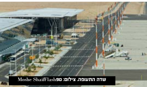
שדה התעופה.

מה עשתה שרת התחבורה בנדון? ובכן, היא אפילו לא טרחה לענות למכתב והמחירים עלו. מיכאלי גם לא הגיבה לשאלה מדוע לא פעלה לעצור את עליית המחירים, או לכל הפחות השיבה למכתב, למרות בקשות חוזרות ונשנות למתן תגובה.