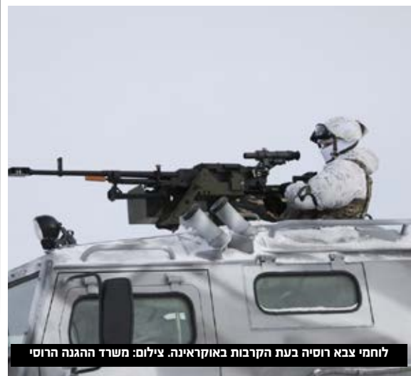
לוחמי צבא רוסיה בעת הקרבות באוקראינה.

השבועון לבית היהודי מרוה לצמא למשפחות צממאות לאיכות