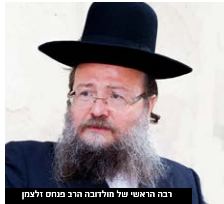
רבה הראשי של מולדובה הרב פנחס זלצמן