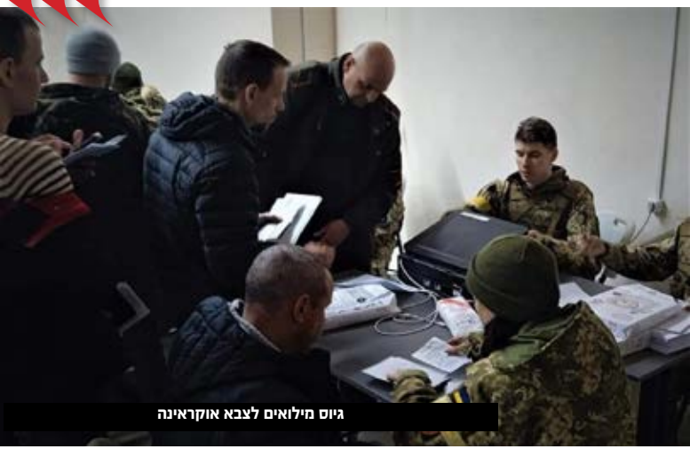
גיוס מילואים לצבא אוקראינה

19:44 - נשיא ארה"ב ג'ו ביידן אמר כי מנהיגי מדינות ה-G7 "הסכימו להתקדם עם