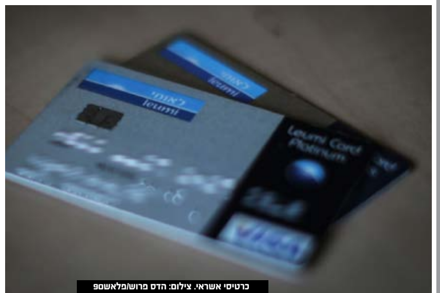
כרטיסי אשראי.

מהנתונים עולה כי במהלך המחצית הראשונה לשנת 2021 נמשכה מגמת הירידה ביחס סך ההכנסות מעמלות לנכסי המערכת הבנקאית. מגמת ירידה זו החלה לאחר הרפורמה בשנת 2008, ועד היום נרשמה ירידה בשיעור מצטבר של כ-45%.