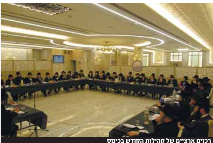
רכיזי משכני בכינוס