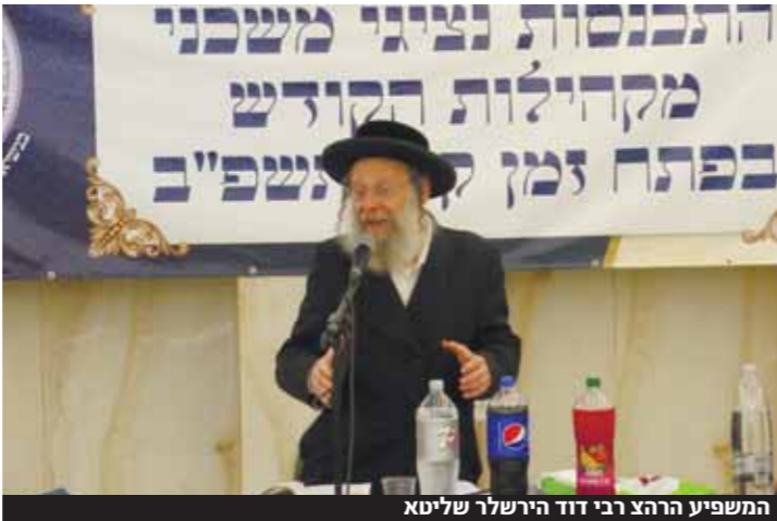
המשפיע הרצה רבי זוד הירשעל שליטא

במושב המיוחד סיכמו הנציגים את השוטפת שנעשתה בימי בין הזמנים החולפים • קווי חשיבה ודפוסי פעולה מחודשים לובנו יחדיו לקראת חודשי הקיץ הבעל"ט • דגש עיקרי הונח על הקמת מסגרות וסדרי לימודים בשטיבלאך בימי שישי ושבת הארוכים