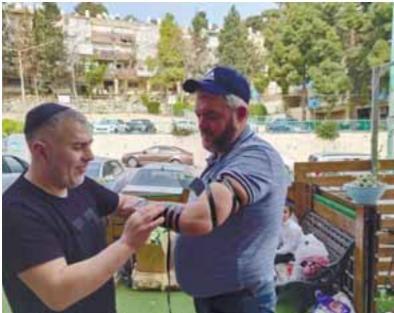
אנשי 'יד לאחים' בפעילות יהודית עם העולים מאוקראינה ביריותיהם החדשות

בשיתוף פעולה מפעים ופורץ דרך עם הוועד להצלת יהדות אוקראינה שע"י חסידות סאטמאר בקרית יואל, הצליחו אנשי המחלקה המיוחדת שהוקמה לשם כך במהירות בזק ב'יד לאחים' לקלוט באופן מושלם את מאות המשפחות, לדאוג לרישום הילדים למוסדות חינוך תורניים ולהצטייד את ההורים בבטחה בדרך החדשה שהם עושים בחייהם