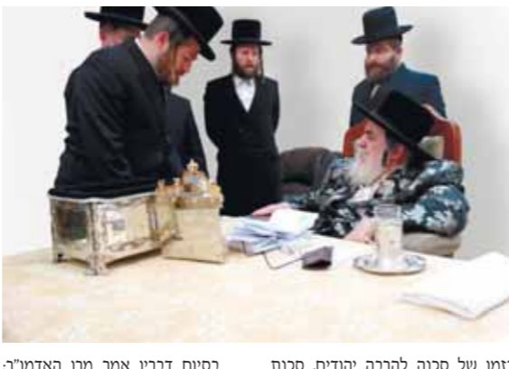
לאור מצב החירום הקיים בתקופה זו, קוראים מרון ורבני גדולי ישראל לכל אחב"י להירתם ולסייע להצלחת היחידים באמצעות התחמתות מגבית החירום של 'ד לאחים'.

נוכח מצב החירום, ראשי 'ד לאחים' נכנסו למעון הקודש של מרון האדמו"ר מוויז'ניץ, שקרא לאחב"י להירתם ולסייע להצלחת מגבית החירום • 'כל התורמים לצדקה נשגבה זו יעלו ויעלילו בכל מעשי ידיהם'