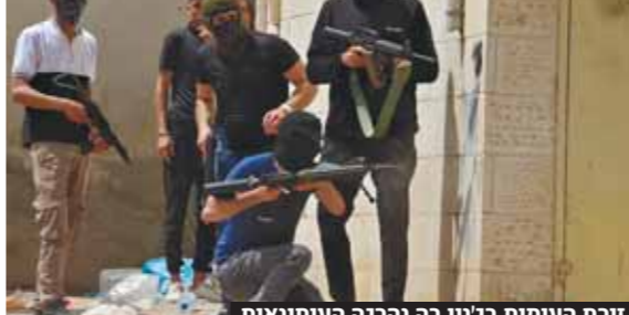
זירת העימות בג'ין בה נהרגה העיתונאית קליע חדר שריון. סיבת המות חיה כי הקליע שהרג את שריון הוא

התובע הפלסטיני: החקירה העלתה שעיתונאית אל'ג'זירה נורתה על ידי לוחמי צה"ל ■ שר הבטחון בני גנץ: "כל טענה שצה"ל פוגע בכוונה בעיתונאים או בבלתי מעורבים היא שקר גם ובוטה"