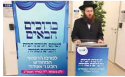
הטקס נפתח בקביעת מזווה בפתח המבנה - בקומתו הראשונה ע"י ל"ק האדמ"ר מטאלנא שליט"א שברך את הנהלת המחוז על המרכז החדש שהוקם מתוך הבנה ורגישות לצורכי החברים והתאמה מדויקת של השירותים הרפואיים והמקצועיים לקהילה ובידך שהה המקום יהווה בית רק לכושרות טובות ועזרה וסיוע לחברים.