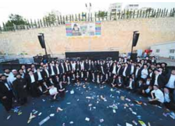
אלפי ילדי ביתר התכנסו ברחבת הענק של חברת 'קווים' בביתר במעמד ראשון מסוגו והיקפו בעיר, חשקו פסוקי תורה ואהבת ישראל

אלפי ילדי ביתר התכנסו ברחבת הענק של חברת 'קווים' בביתר. במעמד ראשון מסוגו והיקפו בעיר, חשקו פסוקי תורה ואהבת ישראל • רגע מצמרר: אלפי ילדי ביתר שרו בדבקות 'אני מאמין' לע"ג ולזכרם של 45 קדושי מירון, במלאת שנה בדיוק לאסון הנורא