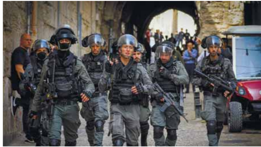
אומרים שזו אולי הדרך שלהם מצד אחד לאיים, ומצד שני לר-מאס, איריסאלה, דיווח כי

מערך ההגנה האווירית וכיפת ברזל תוגבר מחשש לירי מרצועת עזה וגם מדרום לבנון של ארגונים פלסטיניים – כך מורסם באנן במשרטה עניינים עם אלפי שוטרים בירושלים וגייסו שלוש פלוגות מנ"ב במילואים לאבטח את הצועדים. אחת ההחלטות שנתנו לשוטרים: להביל אירועים נקודתיים ולא לאפשר פרובו קציות, מתוך הבנה שאירועים כאלה עלולים להבעיר את יו"ש לים וממנה גם להסלים את המצב בגזרות האחרות.