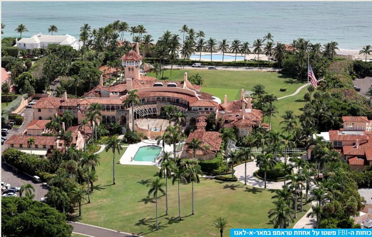
כוחות ה-FBI פשטו על אחוזת טראמפ בתא-א-לאגו

של טראמפ – ביניהם היועץ קארטר פייג'. בדיעבד, ועדות הקונגרס והיועצים המשפטיים קבעו כי הדו"ח המודיעיני המרכזי – המכונה 'דוח סטיל' – היה חסר בסיס, וכי לא היתה הוכחה לקשר ממשי בין טראמפ לקרמלין.