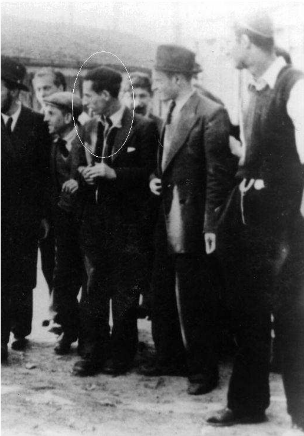
לא ברור מי מהתמונה הוא הגראי"ל