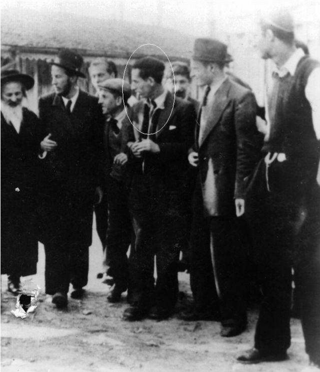
לא ברור מי מהתמונה הוא הגראי"ל