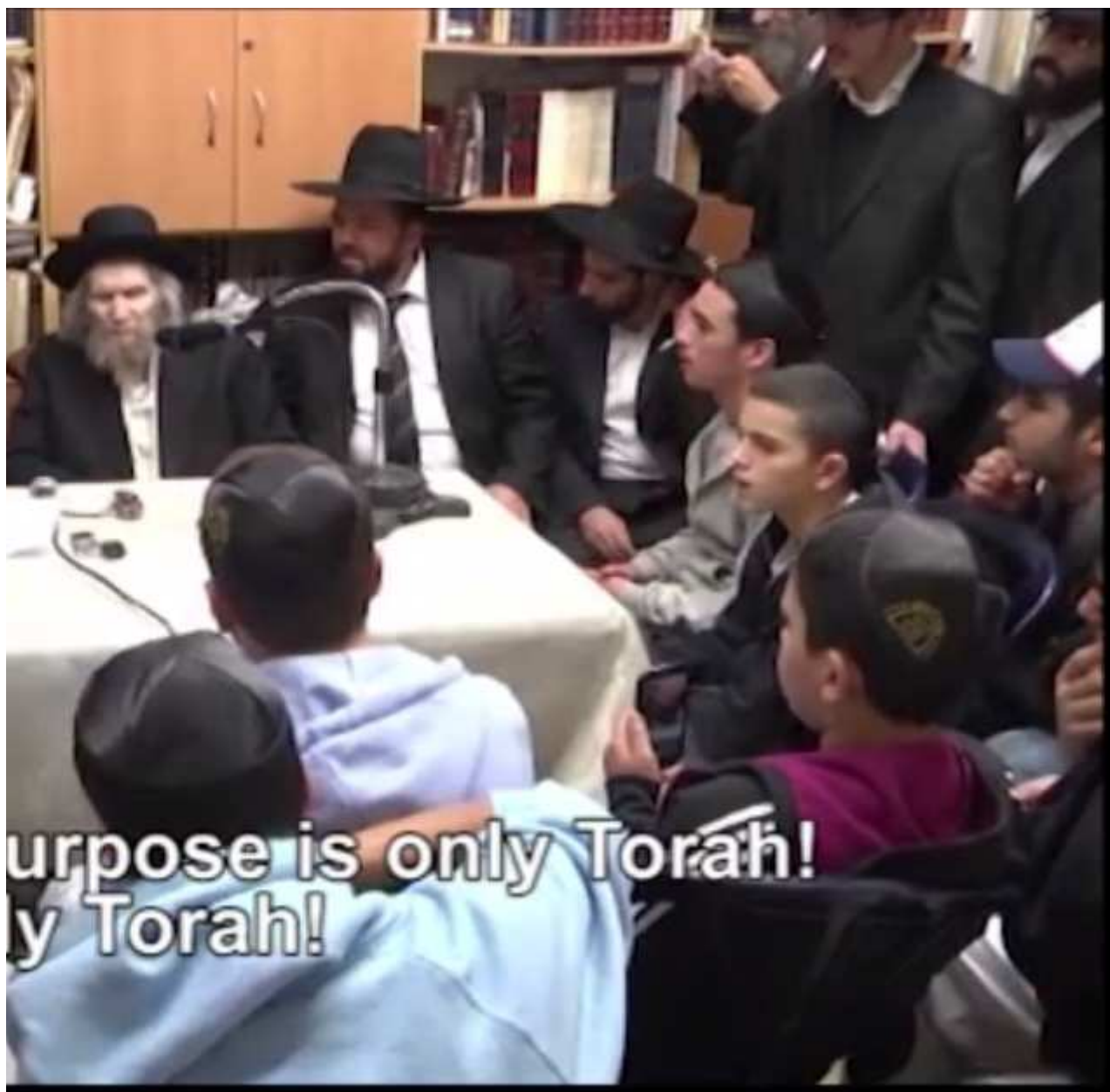
חיזוק נערים 2. PNG נצפה 1046 פעמים (1.46 MiB)