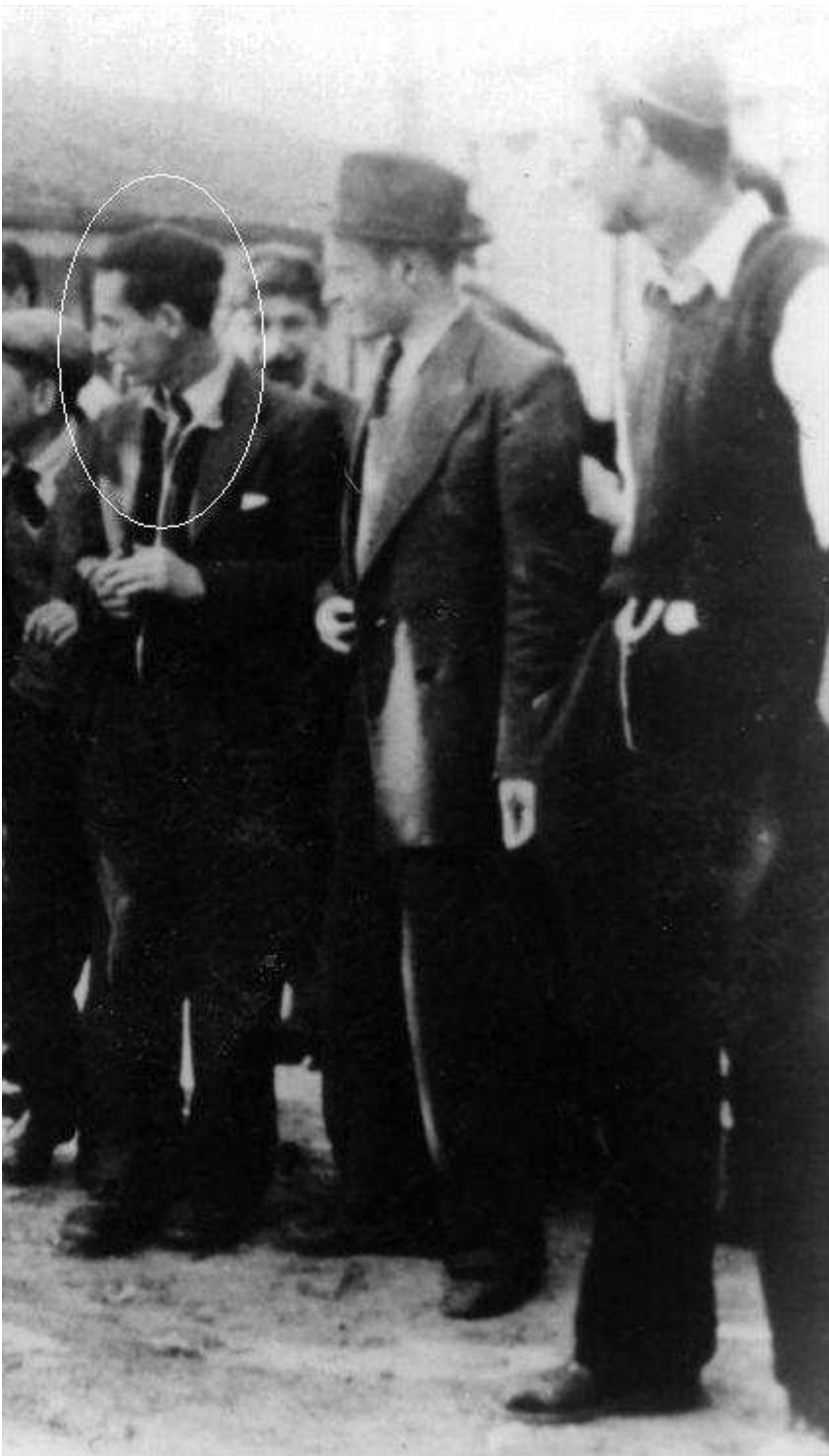
לא ברור מי מהתמונה הוא הגראי"ל