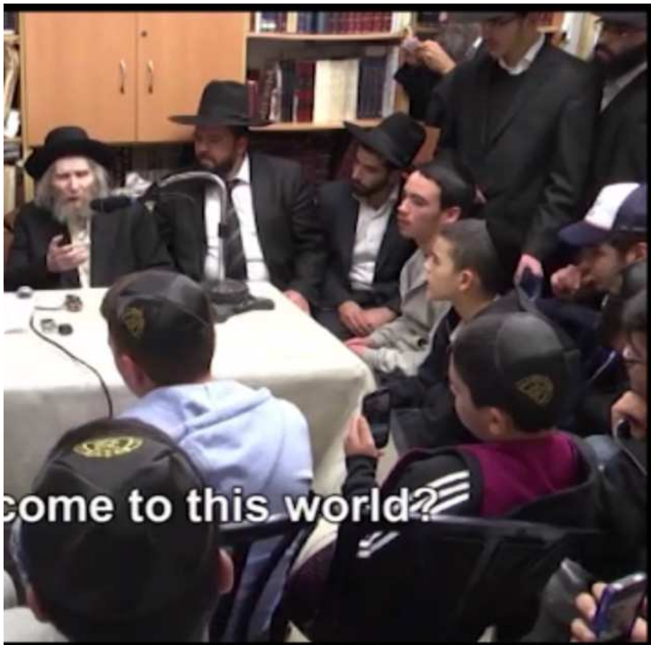
בחיזוק נערים. (1.49 MiB) PNG נצפה 1046 פעמים