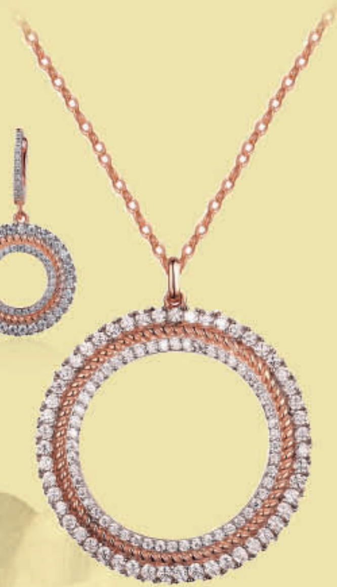
שרשרת כסף 925 בציפוי רוזגולד 295 ש"ח