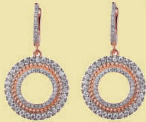
עגילים כסף 925 בציפוי רוזגולד 250 ש"ח