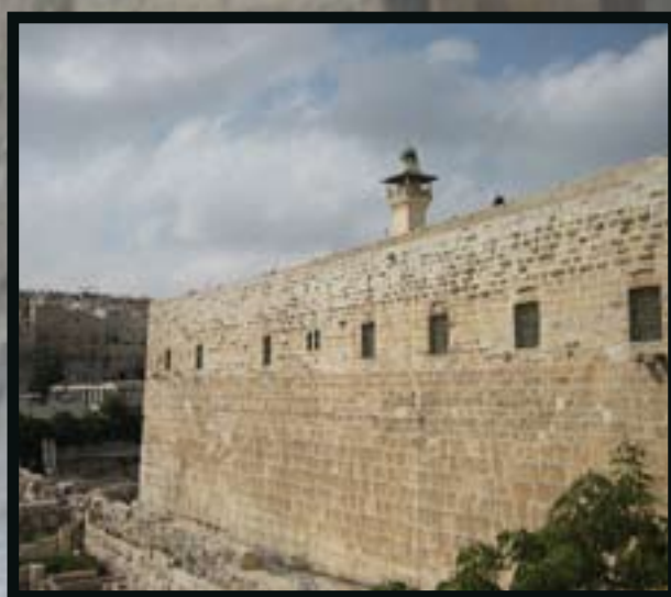
מדור אירוח של צלמים ישראלים מהארץ ועולם. ניתן לשלוח תמונות לאימל של המערכת: