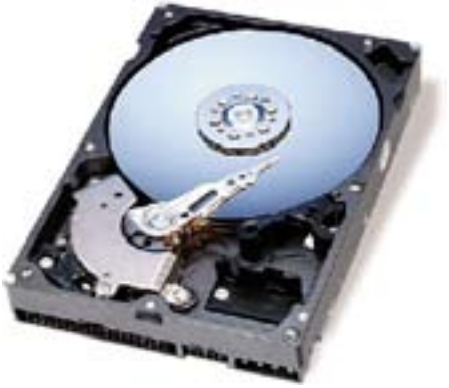
לקבלתם (פתיחת הקובץ). בממוצע מדובר בפרק זמן הנע בין 8 ל-12 מ"ש.

זמן חיפוש ממוצע ( ) - בודק כמה זמן נדרש לראש הקריאה לאתר את גזרת הנתונים המבוקשת. זהו גם פרק הזמן העובר בין הקריאה לנתונים (למשל, הקשה כפולה על אייקון של קובץ) ועד