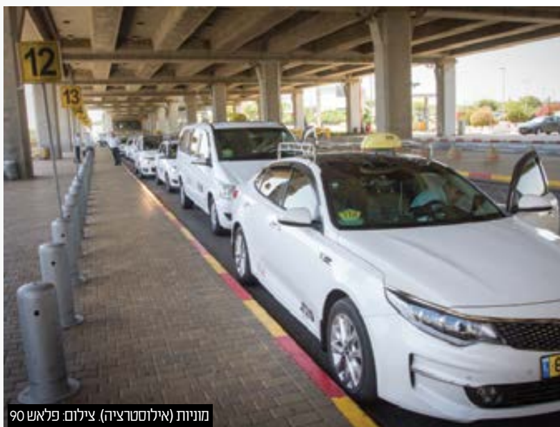
מוניות (אילוסטרציה)