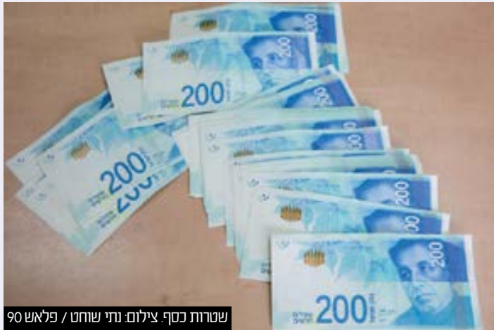
שטרות כסף

האזרחית". עוד נכתב בכתב התביעה כי: "תביעה זו עוסקת במקרה חמור בו הנתבעים קשרו קשר לבצע סדרת פשעים שעניינה יצור זיוף של שטרי כסף בשווי עשרות אלפי שקלים. הנתבעים קשרו קשר זה במטרה למכור לאחרים, המעוניינים בכך, את תוצרי הזיוף על מנת שאחרים יקברו באמצעותם סחורות ושירותים שונים. בכך, למעשה, הפכו הנתבעים ל"ספקים" של כסף מזויף לצורכי מרמה שונים תוך שהם מפריים את זכויות היוצרים של הבנק בשטרי הכסף וזאת כדי להפיק רווח כספי עבור עצמם".