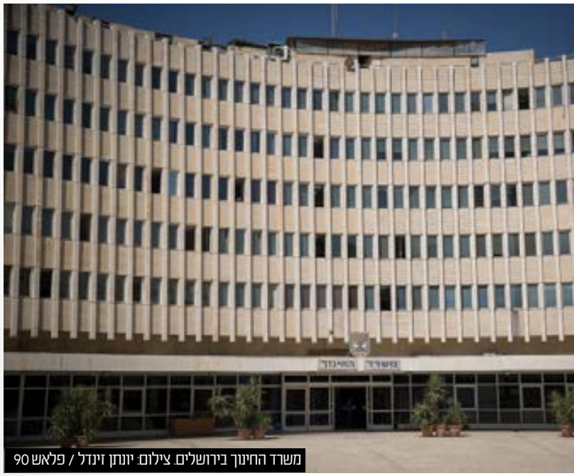
משרד החינוך בירושלים

אולי משרד החינוך רוצה לחייב אותי ללכת ללמוד במכללות שנאסרו ע"י גדולי ישראל. (חיי נוך העצמאי אינו מקבל תואר אקדמאי). וכן אין באפשרותי לקבל דרגת BA אק