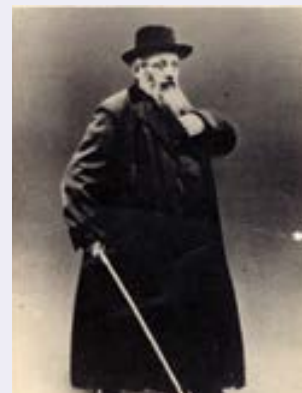
הופיעו בספר 'נפש יש"י'.

כ"ק אדמו"ר מאטניא שליט"א מגיע היום להשתתף על ציון קדשו שבסטאניסלוב • האדמו"ר יערוך את שולחנו בביהמ"ד של הרה"ק מאטניא