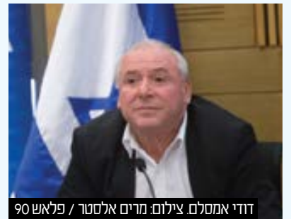
יודי אמסלם.

לאחר התלבטות ממושכת שכללה גם התייעצות עם ראש הממשלה, הודיע יו"ר הקואליציה על רצונו להישאר בזירה הארצית. המשמעות: זאב אלקין יהיה ככל הנראה מועמד הליכוד בבחירות