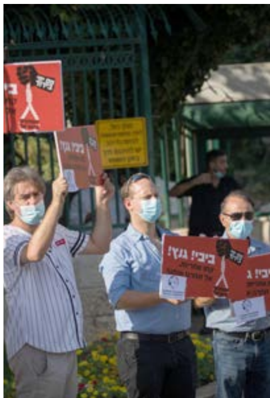
▲ פיצוי בהתאם לגובה הפגיעה. מחאת בעלי עסקים

החוק שאושר בקריאה שנייה ושלישית, קובע כי עסקים ימשיכו להיות זכאים למענק הסיוע בעד השתתפות בהוצאות קבועות הדרושות להפעלת עסקיהם בתקופת הקורונה, בגין ירידה של 25% ומעלה במחזור עסקיהם גם בחודשים ינואר ופברואר 2021, ובנוסף קובע פיצוי חד פעמי לעסקים שסובלים מפגיעה ממושכת בגין המשבר. מענק הוצאות קבועות משולם בעד תקופות זכאות של חודשיים, והתנאי הבסיסי לזכאות הוא ירידה במחזוריים של פעילות העסק. על רקע