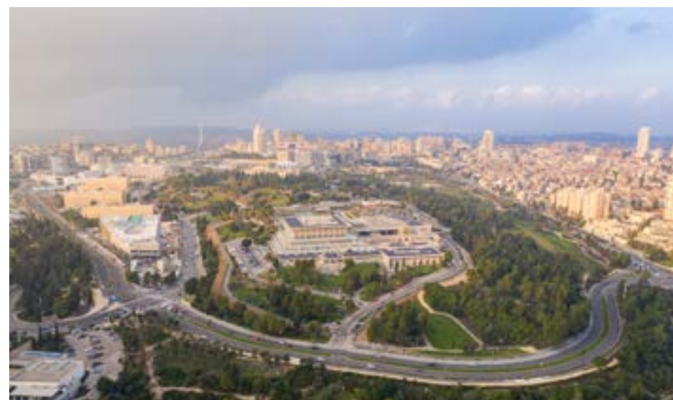
▲ האם ישראל היא מקום טוב לחיות בו? ביהמ"ש על רקע הרי ירושלים

נתוני 'מדד הדמוקרטיה' של המכון הישראלי לדמוקרטיה מעלים תמונת מצב עגומה אליה הדרדר בית המשפט העליון בהתנהלותו כאשר מרבית הציבור בישראל, מכל המגזרים, כבר אינו נותן אמון בבג"ץ ובחודשים האחרונים אף נרשמה ירידה חדה במדד האמון ■ לא אמון במ