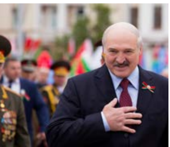
▲ העם יכריע במשאל עם. לוקשנקו

גם כשגריר ארה"ב ברוסיה, המתמחה בענייני רוסיה והמזרח התיכון. בהודעת המינוי אמר ביידן: "ברנס הוא דיפלומט למופת עם ניסיון של עשרות שנים בשמירה על עמנו ועל ארצנו בטוחים בזירה הבינלאומית."