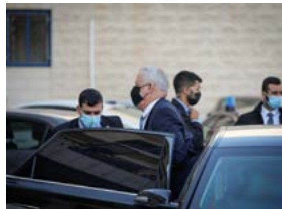
▲ מי יוותר על האגו. יו"ר כחול לבן בני גנץ

גנץ קרא: "זוהי שעת חירום. אסור לתת לו לפרק אותנו לרסיסי מפלגות. יש סכנה גדולה שההזדמנות תחלוף אם נישאר מפוזרים על פני כל