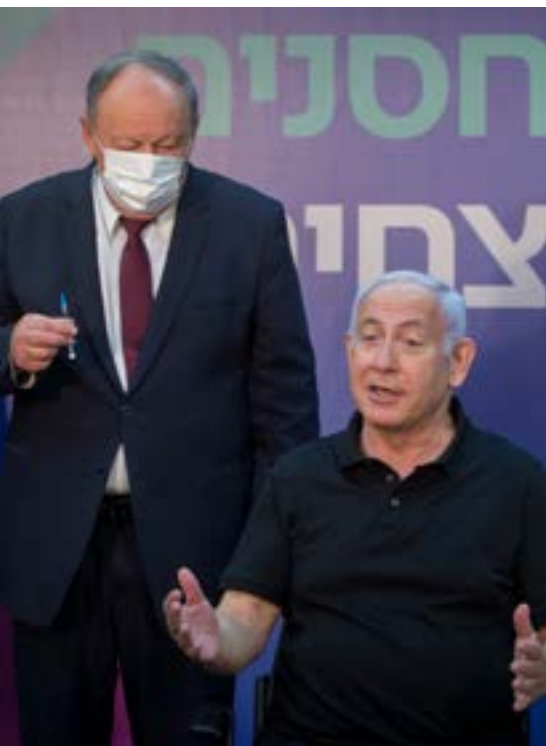
▲ 5 מיליון חיסונים בחודשיים. ראה'מ נתניהו מתחסן

כזכור, במוצאי שבת החל מתן המנה השנייה של החיסון, כאשר ראש הממשלה נתניהו שהיה המחוסן הראשון במנה הראשונה, קיבל את המנה השנייה, ובימים האחרונים חוסנו רבים ממקבלי המנה הראשונה, אולם עד כה במשרד הבריאות לא פרסמו נתון רשמי על מספר המתחסנים גם במנה השנייה. המתחסנים בחיסוני חברת פיזר, מקבלים את המנה השנייה לאחר 21 יום מהמנה הראשונה, ובחלוף שבוע נוסף נחשבים למחוסנים ותונפק עבורם 'תעודת מתחסן' שתכלול הקלות שונות כמו אי חובת בידוד במגע עם חולה.