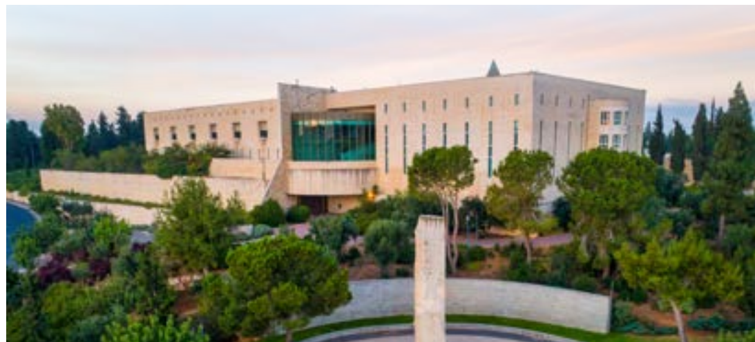
▲ חמסים את יסודות הקיום היהודי. בית המשפט העליון

בין הדברים טוענת חיות כי למרות שהובהר שצעד שעורורייתי שכזה יפגע בכל החולים ובני משפחותיהם המקפידים שלא להיכשל באיסור