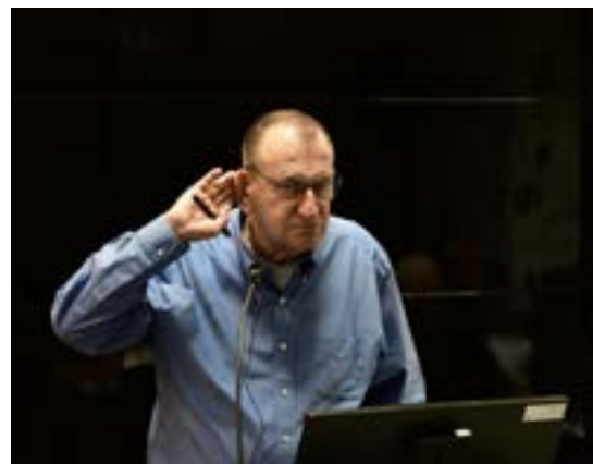
▲ לא מהמר. חולדאי

כך הרבה סיעות. ולכן, אני קורא לכל מי שישאר חשובה לו, כל מי שלא ילך עם ביבי: לוותר על האגו ולהתאחד. לפיד, חולדאי, בוגי, שלח, ליברמן, הורוביץ, שמולי, זליכה. כל אלו שבאמת לא ישבו עם ביבי. בואו. בואו וניפגש. נמצא את השיטה. נמצא את הדרך. נמצא את המשותף כולנו. בואו כבר מחר. ניכנס לחדר. נמצא פתרונות". לסער ובנט, הוא אף לא טרח לפנות. ביש עתיד הגיבו: "נעשה כל מאמץ להוביל לחיבורים שיובילו לממשלה שפויה וליברלית שתשנה את המדינה". ליברמן היה תוקפני יותר: "גנץ כבר הייתה לנו הזדמנות להחליף את ביבי אבל בחרת להיות ראש ממשלה רזרבי. הדבר היחיד שאתה יכול לעשות עכשיו למען המדינה זה להודיע שאתה לא מתמודד בכנסת הבאה".