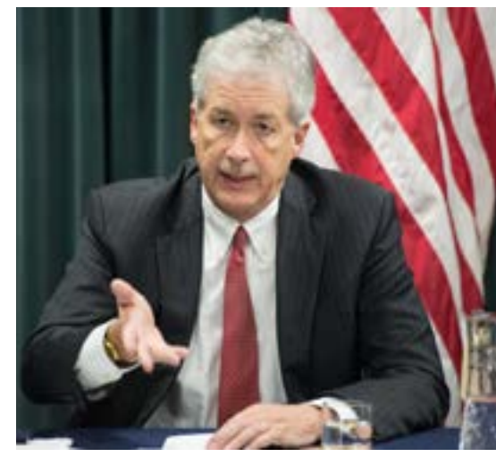
▲ יחזור להסכם מחודש. ברנס

על רקע הדרמה בגבעת הקפיטול, וכמה ימים לפני שיושע לתפקיד, נשיא ארצות הברית הנבחר ג'ו ביידן, ממשיך באיוש התפקידים הבכירים בממשל החדש ואתמול הודיע כי החליט למנות לראש ה-CIA, את ויליאם ברנס. ברנס, בן 64, מחזיק בניסיון ארוך בדיפלומטיה האמריקנית, הוא תת מזכיר המדינה לשעבר, וכיהן