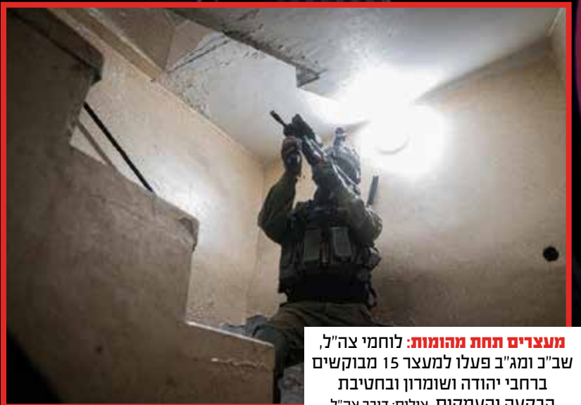
מעצרים תחת מהומות: לוחמי צה"ל, שב"כ ומג"ב פעלו למעצר 15 מבוקשים ברחבי יהודה ושומרון ובחטיבת הבקעה והעמקים.