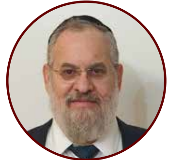
הרב חגי ולוסקי

ככל שאדם יעשה ויפעל ביתר התאמצות וביתר ניצול כוחות נפשו - יותר יסייעוהו בכך