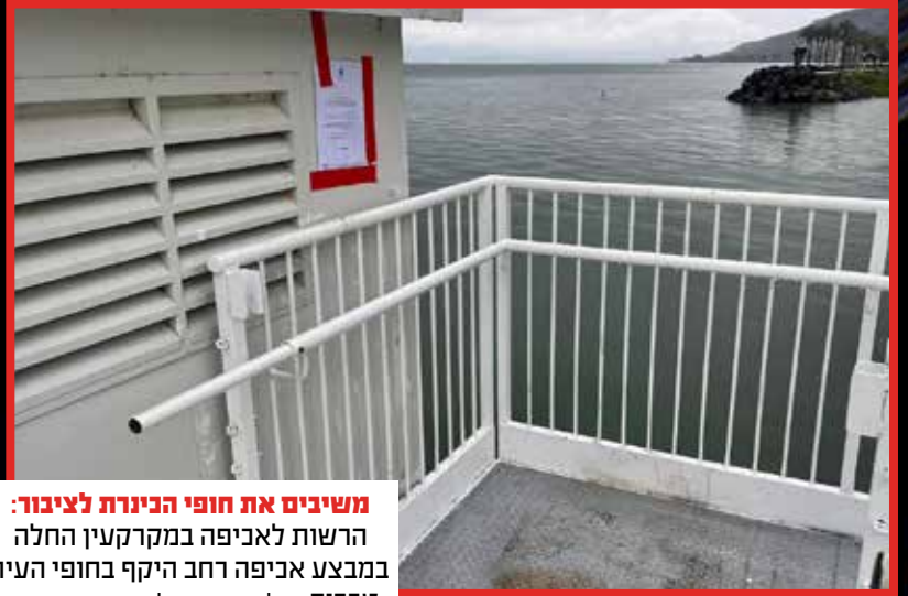
משיבים את חופי הכינרת לציבור: הרשות לאכיפה במקרקעין החלה במבצע אכיפה רחב היקף בחופי העיר טבריה.