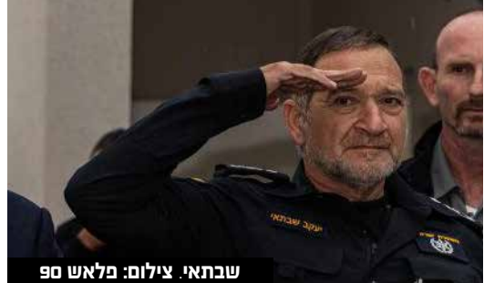
שבתאי.