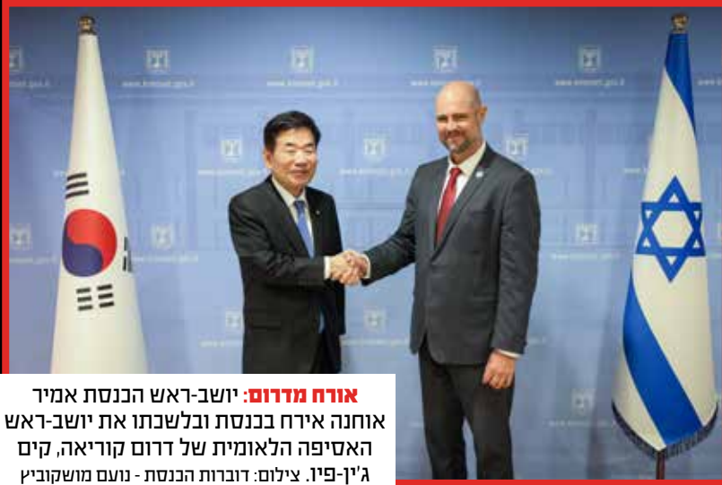
אורח מדרום: יושב-ראש הכנסת אמיר אוחנה אירח בכנסת ובלשכתו את יושב-ראש האסיפה הלאומית של דרום קוריא, קים ג'ין-פיו.