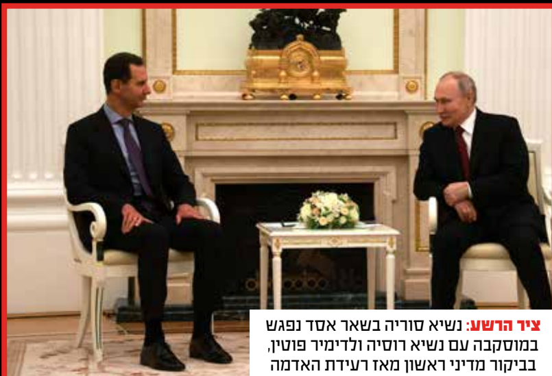
ציר הרשע: נשיא סוריה בשאר אסד נפגש במוסקבה עם נשיא רוסיה ולדימיר פוטין, בביקור מדיני ראשון מאז רעידת האדמה ההרסנית שפקדה את המדינה.