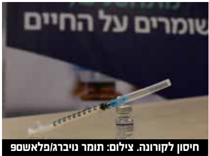
חיסון לקורונה.

ישראל עם פנדמיה בעתיד, זאת בהתייחס לשלבים השונים של פיתוח תכשירים רפואיים, ובכלל זה הייצור והרגולציה המתחייבת במסגרתם.