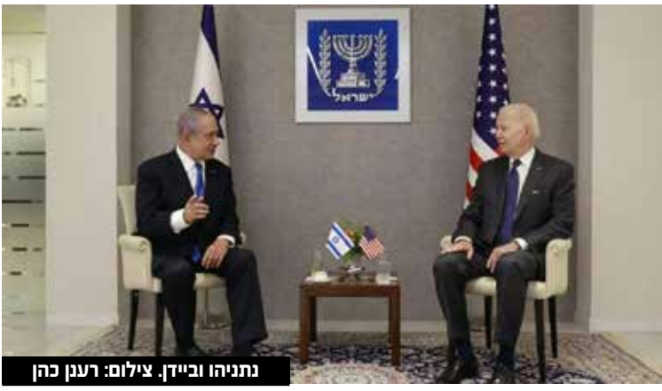
נתניהו וביידן.

ניסים מזרחי הברקס של נתניהו לשרים: ב'חדשות 12' דווח כי שרים בממשלה, שהביעו עניין בנסיעות מדיניות לארצות הברית כחלק מפעילותם השוטפת, קיבלו הנחיה מראש הממשלה בנימין נתניהו, שלא לנסוע לווישינגטון או לארה"ב בכלל, כל עוד הוא עצמו לא נוסע. קרוב לשלושה חודשים מאז הוקמה הממשלה, ונתניהו לא זומן לפגישה עם הנשיא האמריקני ג'ו ביידן. נתניהו הוסיף והנחה את השרים, שמי שכבר יטוס לא ייפגש עם גורמי ממשל אמריקנים, ממש כפי שקרה לשר האוצר ח"כ בצלאל סמוטריץ' בימים אלו, עוד לפני שהממשל עצמו התנער ממנו. לשכתו של סמוטריץ' ניסתה לתאם פגישות עם גורמים בממשל ביידן, אך אלו סירבו בכל תוקף בשל אמירותיו השונות - כולל זאת מלפני שבועיים ש"צריך למחוק את חווארה". לפי הדיווח, מספר גורמים שבקיאים בעניין ששוחחו איתם, אומרים כי "הגעה של מי מהשרים תדגיש את חוסר ההגעה שלו, ולכן זו ההנחיה שעברה אליהם מטעם נתניהו, זולת רון דרמר שמשמש כסוג של שליח מטעמו". אלא שהמבוכה המדינית של נתניהו לא מסתיימת כאן. עוד דווח כי היו מגעים בשבועות האחרונים לגבי ביקור של נתניהו באיחוד האמירויות, מה שלא יצא לפועל. הדיבורים סביב ביקור נתניהו באמירויות כללו אפילו תאריך ספציפי שאותו רצו