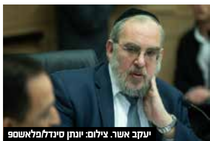
יעקב אשר.

יו"ר הוועדה ח"כ יעקב אשר אמר: "המטרה היא להתקדם מהר, צריך לפנות את המפעלים מסכני החיים ולקדם במקביל את הפיתוח הכלכלי, ואם המטרה היא ליצור שם מטרופולין, שזה יהיה הגוש דן של הצפון - תתכננו שם כבר מראש מטרות". הוא הודיע כי מדובר בישיבה ראשונה מתוך מספר ישיבות שיתקיימו ומטרתן לפקח על עבודת הממשלה ולבדוק שהתוכנית מתקדמת על פי התכנון ושהמזהמים לא יעברו לאזורים אחרים בארץ וייצרו שם מפרץ מסוכן חדש.