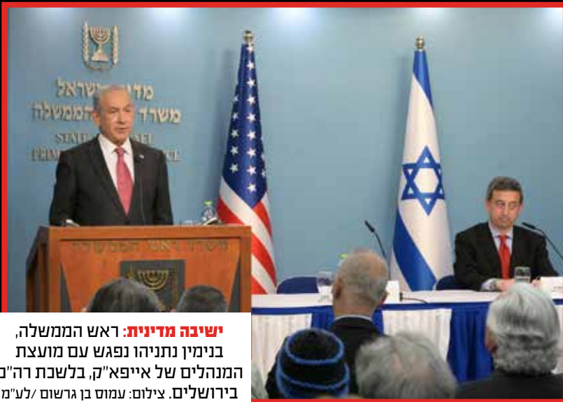
ישיבה מדינית: ראש הממשלה, בנימין נתניהו נפגש עם מועצת המנהלים של אייפא"ק, בלשכת רה"מ בירושלים.