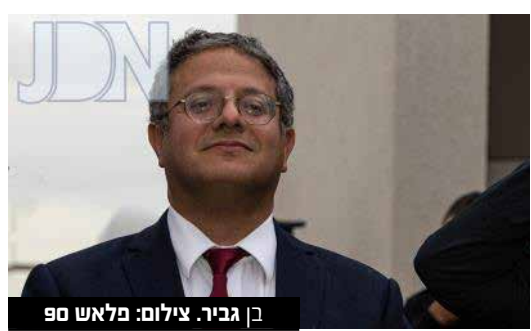
בן גביר.