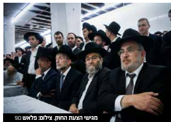
מגישי הצעת החוק.

לסיום נכתב בהצעת החוק, כי "כך גם בחברות הממשלתיות ובתאגידים שהוקמו בחוק, דוגמת בנק ישראל, חברת הדואר, חברת החשמל, חברות נמל אשדוד וחיפה, רכבת ישראל, חברת דירה להשכיר, קופות החולים, תאגידי מים ועוד, בהם אחוז העובדים מבני המגזר החרדי נמוך ביותר, ובחלק מהחברות אין כלל ייצוג לעובדים הנמנים עם המגזר החרדי".