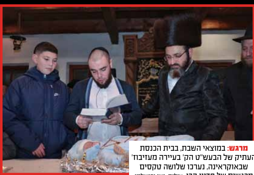
מרגש: במוצאי השבת, בבית הכנסת העתיק של הבעש"ט הק' בעיירה מעזיבוד' שבאוקראינה, נערכו שלושה טקסים מרגשים של פדיון הבן.