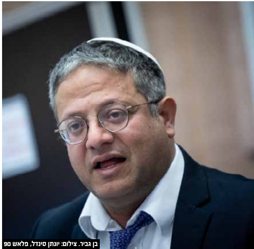
בן גביר.

לפגוע במדינת ישראל כמדינת העם היהודי ועל מנת להכריע תודעתית את המפגעים, סיעות הקואליציה יחוקקו טרם העברת התקציב לשנת 2023 חוק עונש למחבלים. השר לביטחון לאומי איתמר בן גביר: "יש לנו סיכום מפורש בהסכם הקואליציוני עם הליכוד שהצעת החוק תעלה, מתקשה להאמין שהליכוד לא יקיים את ההסכם. אין לי בעיה כמובן לקיים דיון גם בישיבת קבינט, אבל ההצעה צריכה לעלות היום בוועדת שרים".