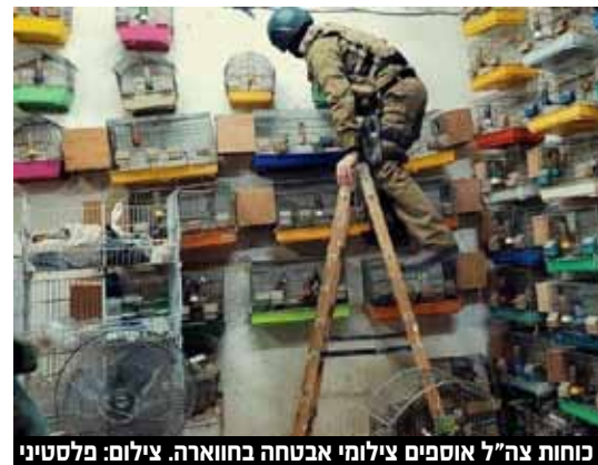
כוחות צה"ל אוספים צילומי אבטחה בחווארה.

המפכ"ל קובי שבתאי הביע את צער, והוסיף: "אני סומך את ידי על השב"כ והמודיעין של צה"ל שידעו לסגור מעגל ולהגיע למחבל. אנחנו במצב מאוד רגיש וזה מחייב את כולנו לכוננות מבצעית, ולכן אני מבקש מכל קציני האג"מ לבדוק מוכנות ביחידות, לוודא שכל השוטרים במוכנות. משטרת ישראל נכנסת לכוננות מקסימלית במטרה להיות ברמת דריכות מבצעית מלאה."