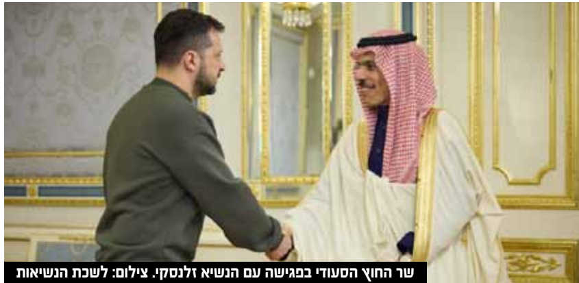
שר החוץ הסעודי במגישה עם הנשיא זלנסקי.

"מאז שנה שעברה, אותם מל"טים איראניים מחזיקים ברשותם של טרוריסטים רוסים ותוקפים את תשתית האנרגיה של אוקראינה".