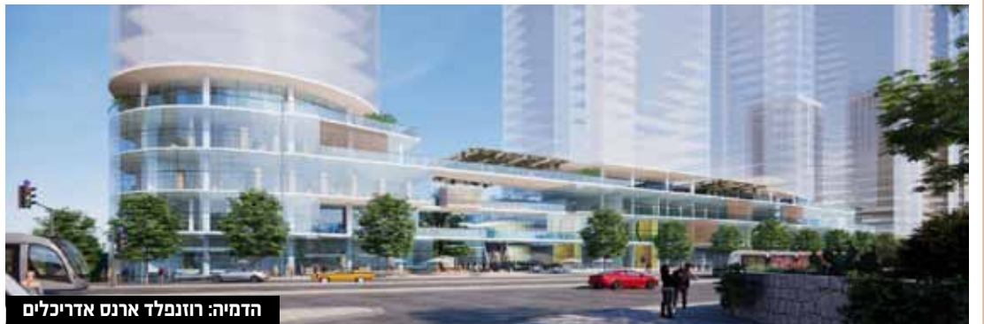
הדמיה: רוזנפלד ארנס אדריכלים

יחיאל שוחט הוועדה המחוזית לתכנון ולבניה ירושלים, בראשות שירה תלמי באבאי, אישרה להפקדה תוכנית להתחדשות עירונית בשכונת תלפיות בעיר. התוכנית הינה על שטח כולל של כ-16 דונם, והיא ממוקמת בפנינת הרחובות דרך חברון - האומן. התוכנית כוללת כ-1,500 יחידות דיור שיוקמו בשבעה מגדלים בני 34-42. המגדלים ייבנו בקומת הקרקע שטחים לטובת מסחר ותעסוקה, מבני ציבור בהם אשכול מעונות, תשע כיתות גן ושני בתי כנסת. מתוך כלל היחידות בתוכנית כ-300 יחידות דיור יוקצו עבור דירות קטנות של עד 55 מ"ר. בנוסף למבני הציבור שישולבו בקומת הקרקע של מגדלי המגורים, התוכנית מקצה כ-3 דונם לטובת מבני ציבור, וכ-3 דונם