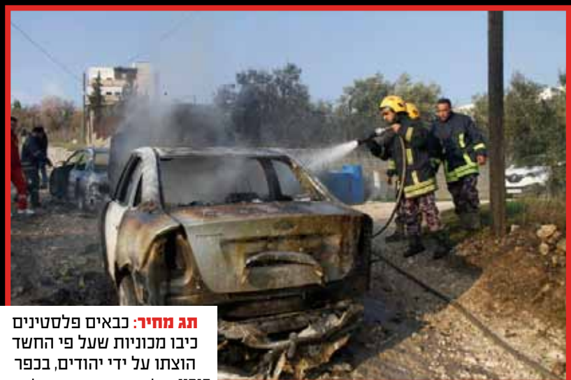
תג מחיר: כבאים פלסטינים כיבו מכוניות שעל פי החשד הוצתו על ידי יהודים, בכפר בורין.