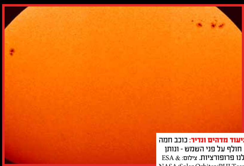
תיעוד מדהים ונדיר: כוכב חמה חולף על פני השמש - ונותן לנו פרופורציות.