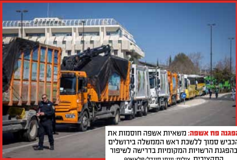
הפגנה פח אשפה: משאיות אשפה חוסמות את הכביש סמוך ללשכת ראש הממשלה בירושלים בהפגנת הרשויות המקומיות בדרישה לשיפור התקציבים.