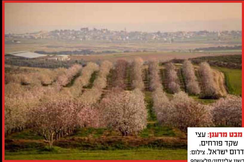
מבט מרענן: עצי שקד פורחים, בדרום ישראל.