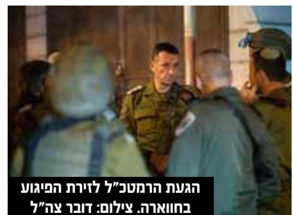
הגעת הרמטכ"ל לזירת הפיגוע בחווארה.

שר האוצר וחבר הקבינט המדיני בטחוני בצלאל