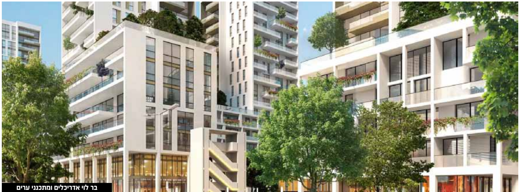
בר לוי אדריכלים ומתכנני ערים

תהליך התכנון המורכב הושלם בתוך כשנתיים בזכות התגייסות של גורמי העירייה ולשכת התכנון. התוכנית שאושרה להפקדה מצליחה לחבר את השכונה לסביבתה, לייצר פתרונות דיור מגוונים, להתחשב בסביבה הטבעית ולתת מענה לצרכי הציבור הקיימים והעתידיים".