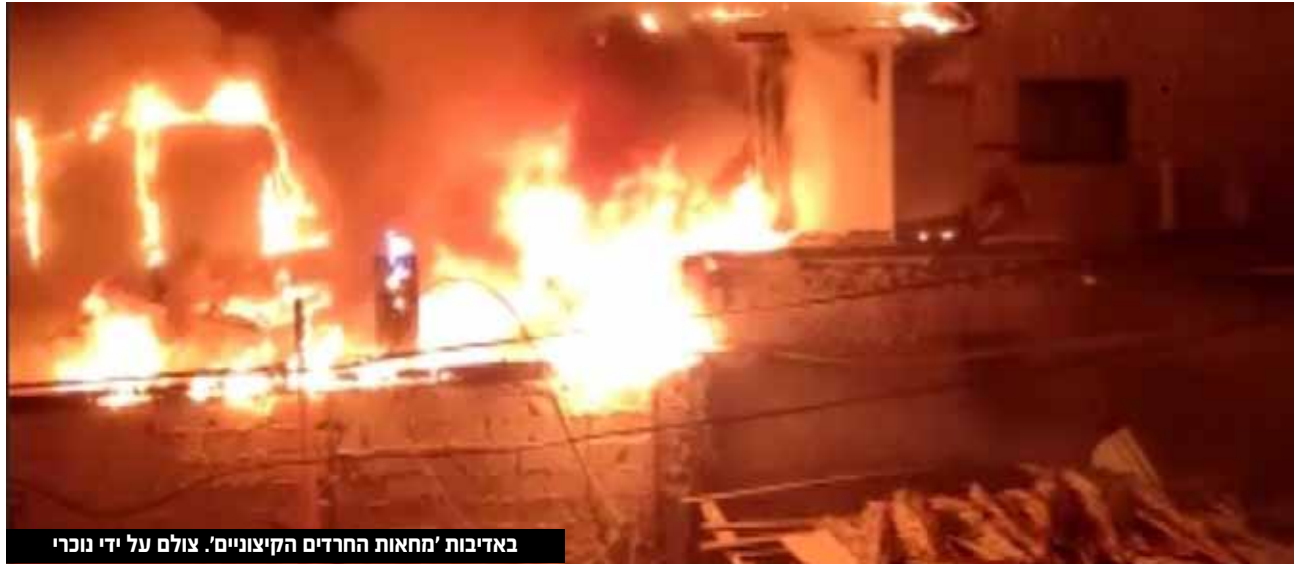
באדיבות 'מחאות החרדים הקיצוניים'. צולם על ידי נוכרי