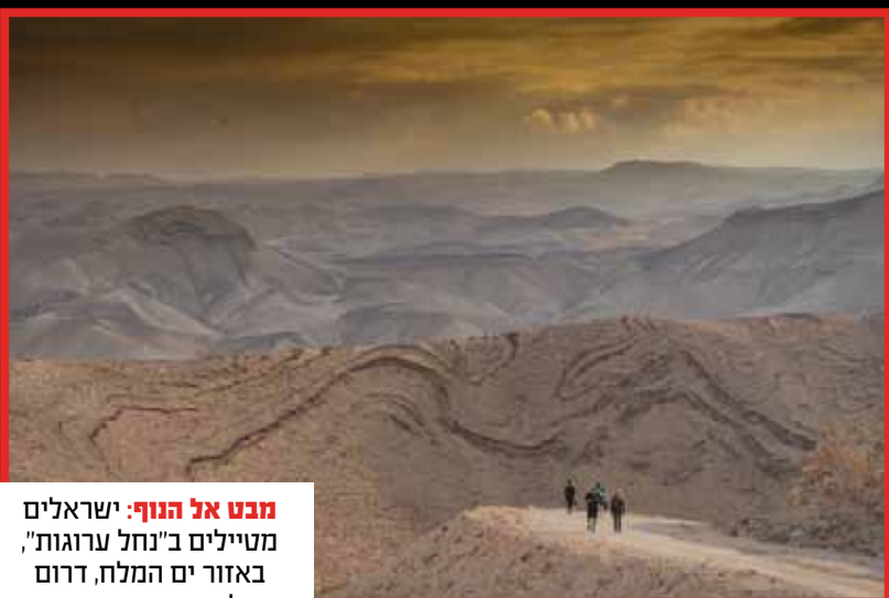
מבט אל הנוף: ישראלים מטיילים ב"נחל ערוגות", באזור ים המלח, דרום ישראל.