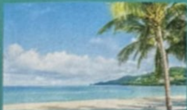
קרוב לחוף הכינרת