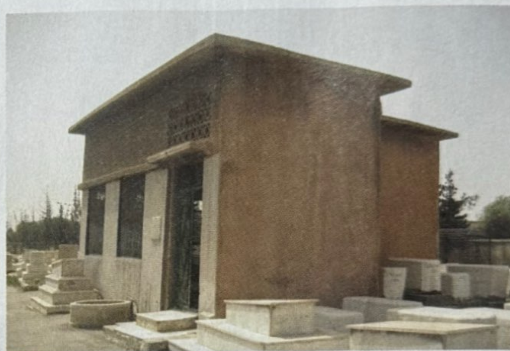
המצבה והאווהל שהוקמו בבית העלמין החדש בדמשק, לאחר הריסת בית העלמין הישן