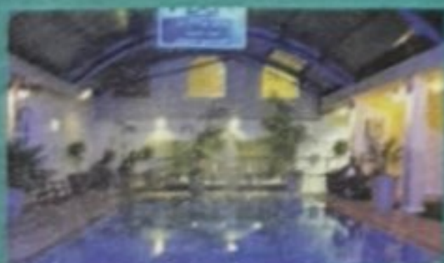
בריכה מקורה מחוממת