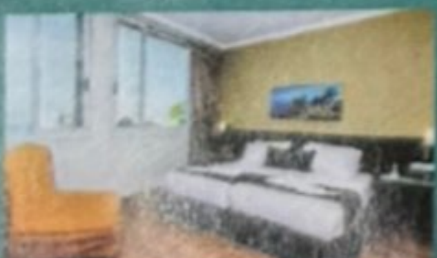
חדרים מפוארים ומפנקים