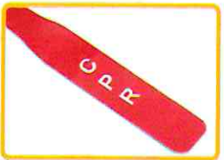
הוצאת אוויר מהירה למקרי החייאה