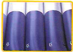
תאי אוויר מיקרו-מאוררים

כיסוי רחיץ ונושם. עמיד לחלוטין למים ולחות, מאפשר בקרת אקלים מצוינת.