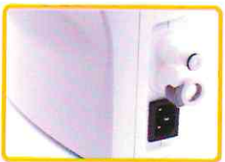
מחברים לניתוק מהיר