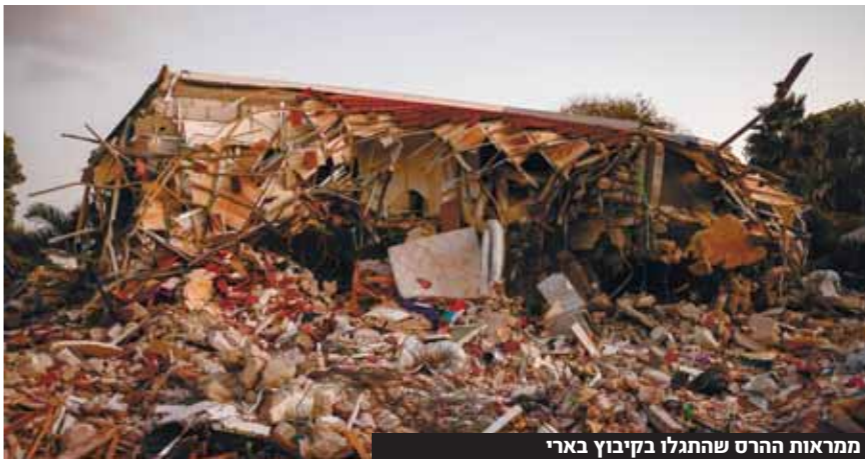
ממראה ההרס שהתגלו בקיבוץ בארי

בגבול הצפון נורו אתמול שני מטחים לעבר שלומי וכמה יישרים בגליל המערבי. כל הנפילות היו בשטחים פתוחים. צה"ל הגיב בירי ארטילרי. בתגובה חיובללה ירה טיל קורנט לעבר רכב צבאי