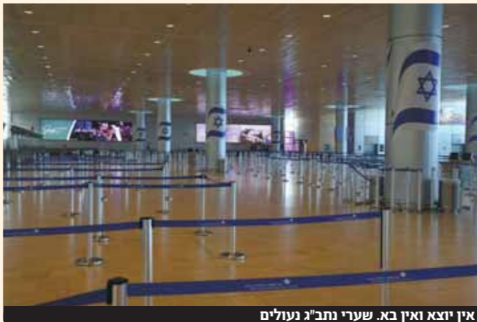
אין יוצא ואין בא. שערי נתב"ג נעולים

מאת שלמה גרין הממתקפה הישראלית באיראן מטלטלת את השווקים סביב העולם: המדיים בבורסות אירופה והחוזים העתידיים בארה"ב נפתחו היום בירידות של עד שני אחוזים, ותנודתיות נרשמה בשי וקיי המטבעות והסחורות. בשוק המטבע, בעקבות המר תקפה הישראלית הדולר התחזק ב־2.3% לרמה של 3.63 שקלים