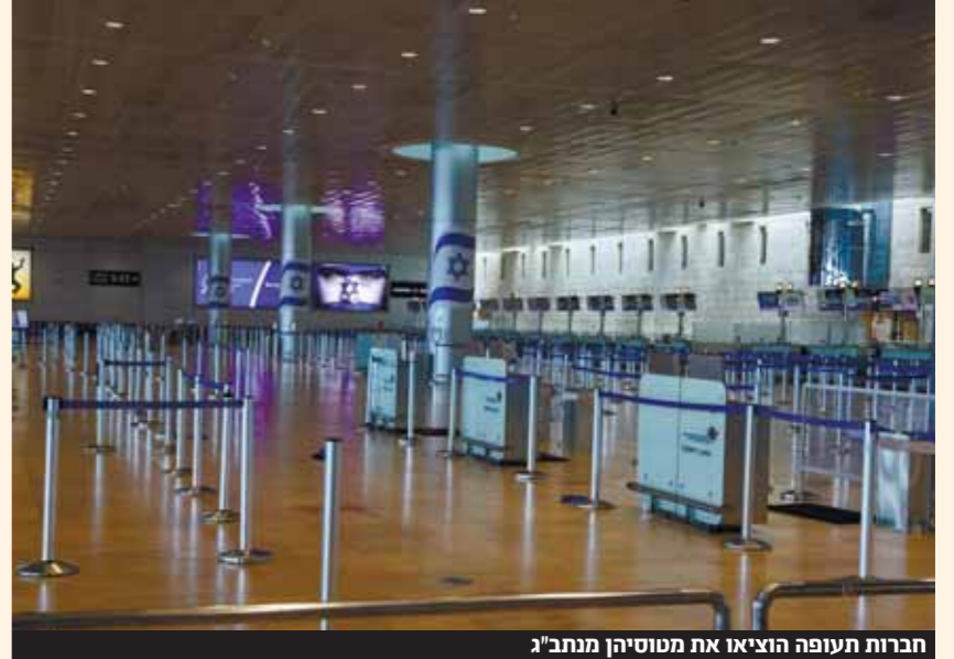
חברות תעופה הוציאו את מטוסייהן מנתב"ג

הפצצות הראשונות הוטלו על טהרן בשעה בה מרבית השווקים בעולם סגורים, אך הטלתה המהירה בשוק הנפט העידה על פוטנציאל ההשלכות של מלחמה בין ישראל לאיראן על הכלכלה הגלובלית. מחיר הנפט שיווד כבר שבועות ארוכים יונק בחדות בתוך זמן קצר, ובהמשך היענה ההשפעה גם לשוק המטבע, ולשוק ההון שנפתח אתמול בירידות סביב העולם. בשעה בה עדיין לא ידוע מה יהיה משך המלחמה וכיצד היא תתנהל, אין טעם לנסות להעריך מה יהיה היקף ההשפעה על כלכלת ישראל והעולם. אך כבר עתה ניתן להעריך שכאב הראש העיקרי במישור הכלכלי יורגש בהשפעה על המחירים. בניגוד לעלויות המלחמה אותן ניתן לגלגל לטווח הארוך, עלויות מחירים הן בעיה שצריך לטפל בה כאן ועכשיו. בישראל, פיתוח מתמשך בשער השקל מול המטבעות הזרים יגרום עלויות מחירים ויחייב צעדים מהירים של בנק ישראל. בעולם, עליה במחיר הנפט תחזיר את האינפלציה שנדרש זמן רב כל כך כדי למתן אותה, ותרחיב את ההשפעה הכלכלית למגזרים רבים נוספים.