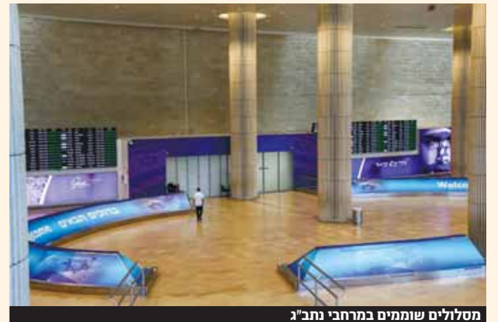
מסלולים שוממים במרחבי נתב"ג