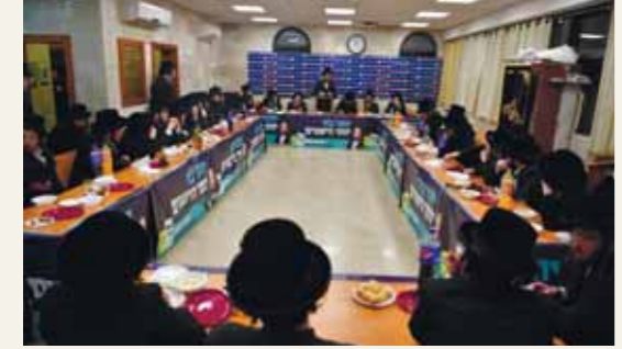
מחזיקי הדת' השיקה מטה מיוחד

זאת לאחר שכ"ק מרן אדמו"ר מבעלזא שליט"א, נדהם ממהלך של הצבת מועמד קש ממניעי נקמה