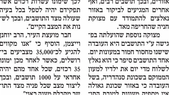
מחזיקי הדת' השיקה מטה מיוחד

זאת לאחר שכ"ק מרן אדמו"ר מבעלזא שליט"א, נדהם ממהלך של הצבת מועמד קש ממניעי נקמה