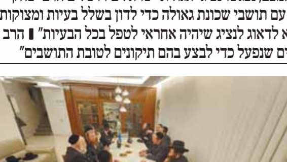
מחזיקי הדת' השיקה מטה מיוחד

זאת לאחר שכ"ק מרן אדמו"ר מבעלזא שליט"א, נדהם ממהלך של הצבת מועמד קש ממניעי נקמה