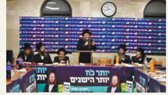
מחזיקי הדת' השיקה מטה מיוחד