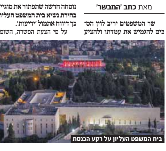
בית המשפט העליון על רקע הכנסת

מאת כתב 'המבשר' שר המשפטים יריב לוין הסיק להגמיש את עמדתו ולהציע יצחק עמית ייחבר לתפקיד הנשיא, למרות התנגדות השר לעקרון ה'סניוריטי'. בתמורה לוין יוכל לה זייע ולבחור שני שופטים עילונים שמורים וממלא מקום הנשיא, השר פט עוזי פוגלמן, זייע שופט ליברלי שימונה במקומו לאחר פרישתו הצפויה בעוד מספר חודשים. עוד דווח כי במערכת הפוליטית מעריכים שפוגלמן מעוניין להרוויח זמן בידוע שללא הרי פורמה המשפטית ומתוך הערכה שתקיימו בחירות חדשות בשנה הקרובה – ייתכן שהועדה הבאה למינוי שופטים ושר המשפטים הבא יתמכו בקו שהוא מוביל. פוגלמן מכהן בתפקיד ממלא