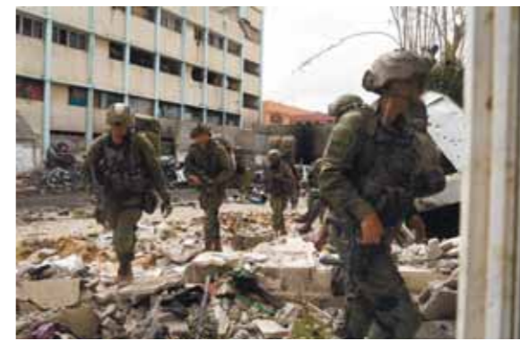
מאת אליעזר שולמן הצבא המשיך גם אתמול בפי עולת הפשיטה על בית החולים שיפא בעזה. לפי דובר צה"ל, עד כה חוסלו בפעילות שהחלה בלילה שבין ראשון לשני למעלה מ-80 מחבלים. בין המחוסלים יש לפחות כמרי אחד בארגון הטרור שהותו טרם הותרה לפסיים. כמו כן נעצרו כ-350 חשודים במערב רבות בטרור. במהלך החיפושים נמצאו אמצעי לחימה ובכללם טיל RPG, רובה קלציניקוב, מחסניות וקדורים בלשמה שסמוכה למנהל בית החולים.

ביום השני למבצע הלוחמים עצרו כ-350 חשודים בטרור וחיסלו עשרות מחבלים, חלקם עסקו בהכוונת טרור ליר"ש. נמצאו אמצעי לחימה שהוטמנו בחומרי הקריה של מפקד גדוד סג'עיה שנתפס - סייעו לפעולת הלוחמים בשטח