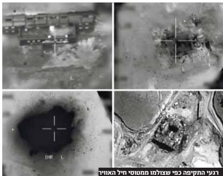
רעני התקיפה כפי שצולמו ממטוסי חיל האוויר