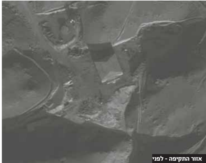
אזור התקיפה - לפני