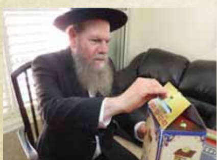
מרן הגר"ש אדלשטיין שליט"א