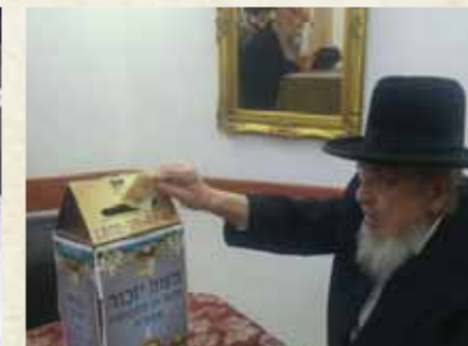
מרן זקן ראשי הישיבות הגר"מ אורחי שליט"א