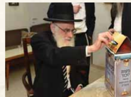
מרן הגר"י שלזינגר שליט"א