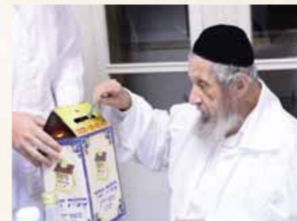
מרן גאון ישראל הגר"ד לנדו שליט"א