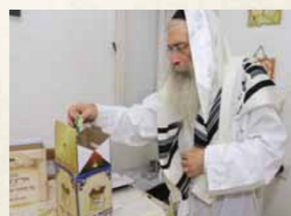
מרן הגר"ש שטינמן שליט"א