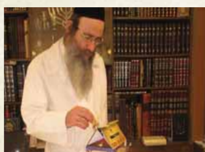
מרן הגר"ב פינקל שליט"א