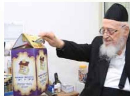
מרן ראש הישיבה הגר"צ ברנמן שליט"א