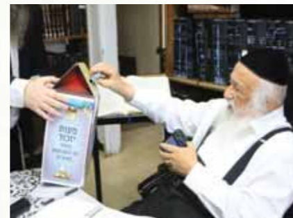
מרן ראש הישיבה הגר"ד פוברסקי שליט"א