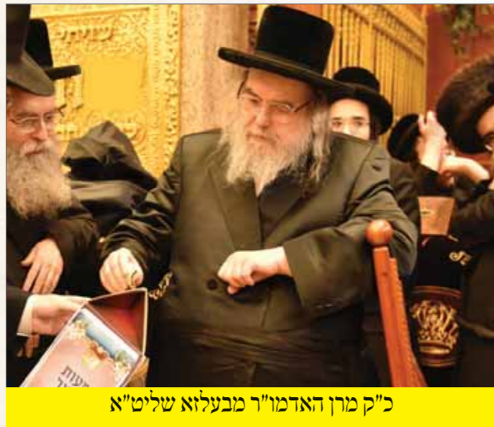
כ"ק מרן האדמו"ר מבעלזא שליט"א

כל גדולי הדור נוהגים לתרום מעוֹת יְזוּר לקופת העיר