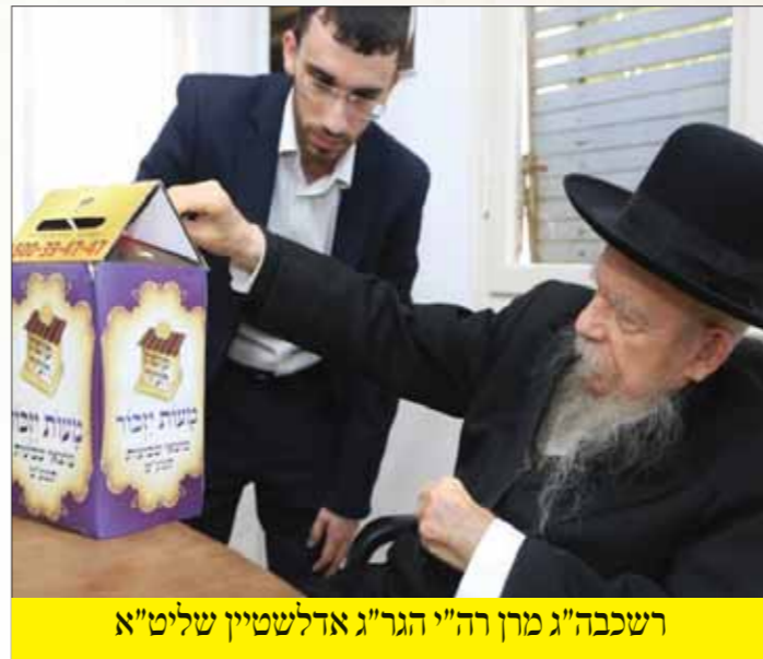
רשכבה"ג מרן רה"י הגר"ג אדלשטיין שליט"א