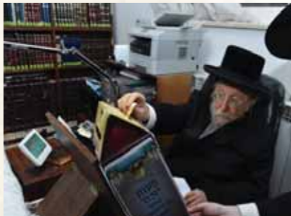
כ"ק מרן האדמו"ר מביאלא שליט"א