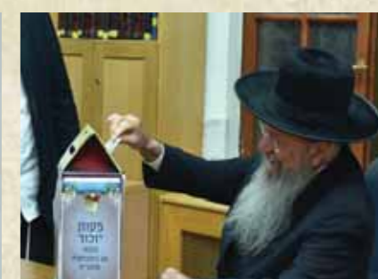
מרן הגר"י הלל שליט"א