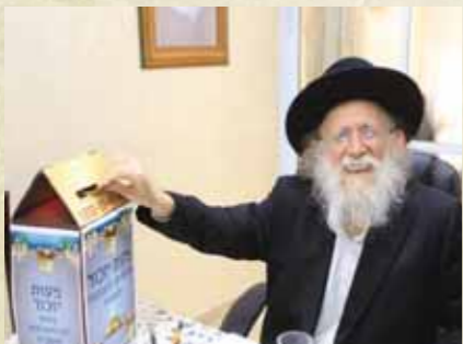
מרן הגר"ש גלאי שליט"א