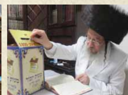
כ"ק מרן האדמו"ר מזוועהיל שליט"א