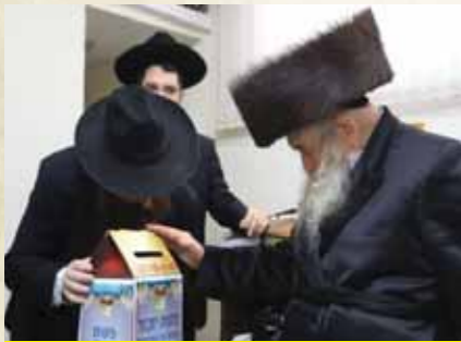
כ"ק מרן האדמו"ר מטשערנוביל שליט"א