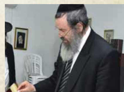
מרן הגר"ד כהן שליט"א