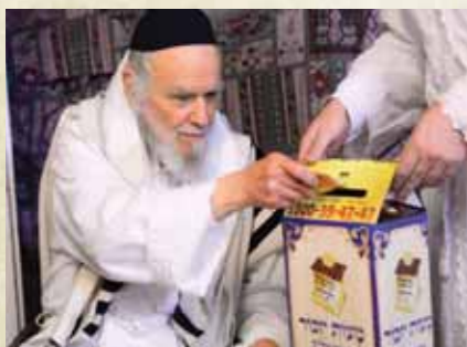
מרן הגר"ה הירש שליט"א