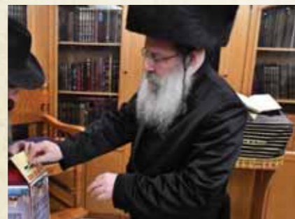
כ"ק מרן האדמו"ר מנדבורנה שליט"א