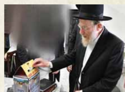
מרן הגר"א אונגרשר שליט"א