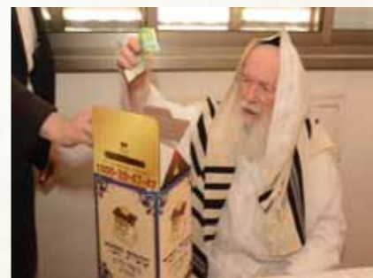
מרן הגר"י זילברשטיין שליט"א