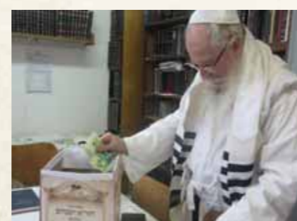
מרן הגר"א וייסבלום שליט"א