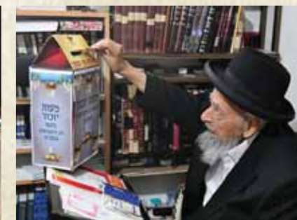
מרן הגר"ש בעדני שליט"א