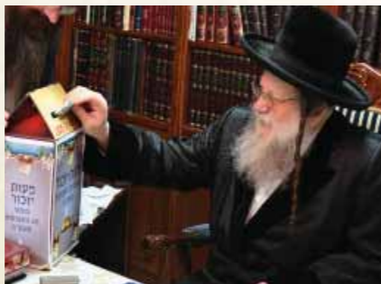
כ"ק מרן האדמו"ר ממודליץ שליט"א