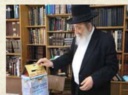
מרן הגר"א ברלין שליט"א