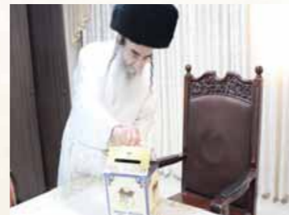
כ"ק מרן האדמו"ר מאלכסנדר שליט"א