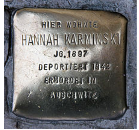
Stolperstein, Oranienburger Straße 22, in Berlin-Mitte