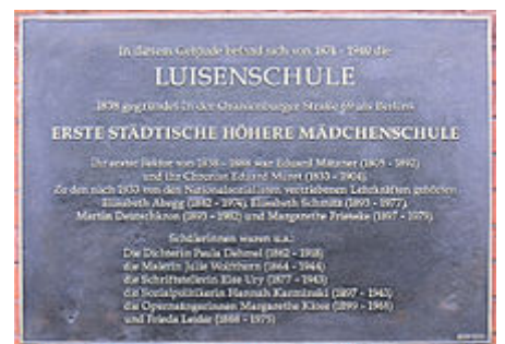
Gedenktafel am Haus Ziegelstraße 12, in Berlin-Mitte