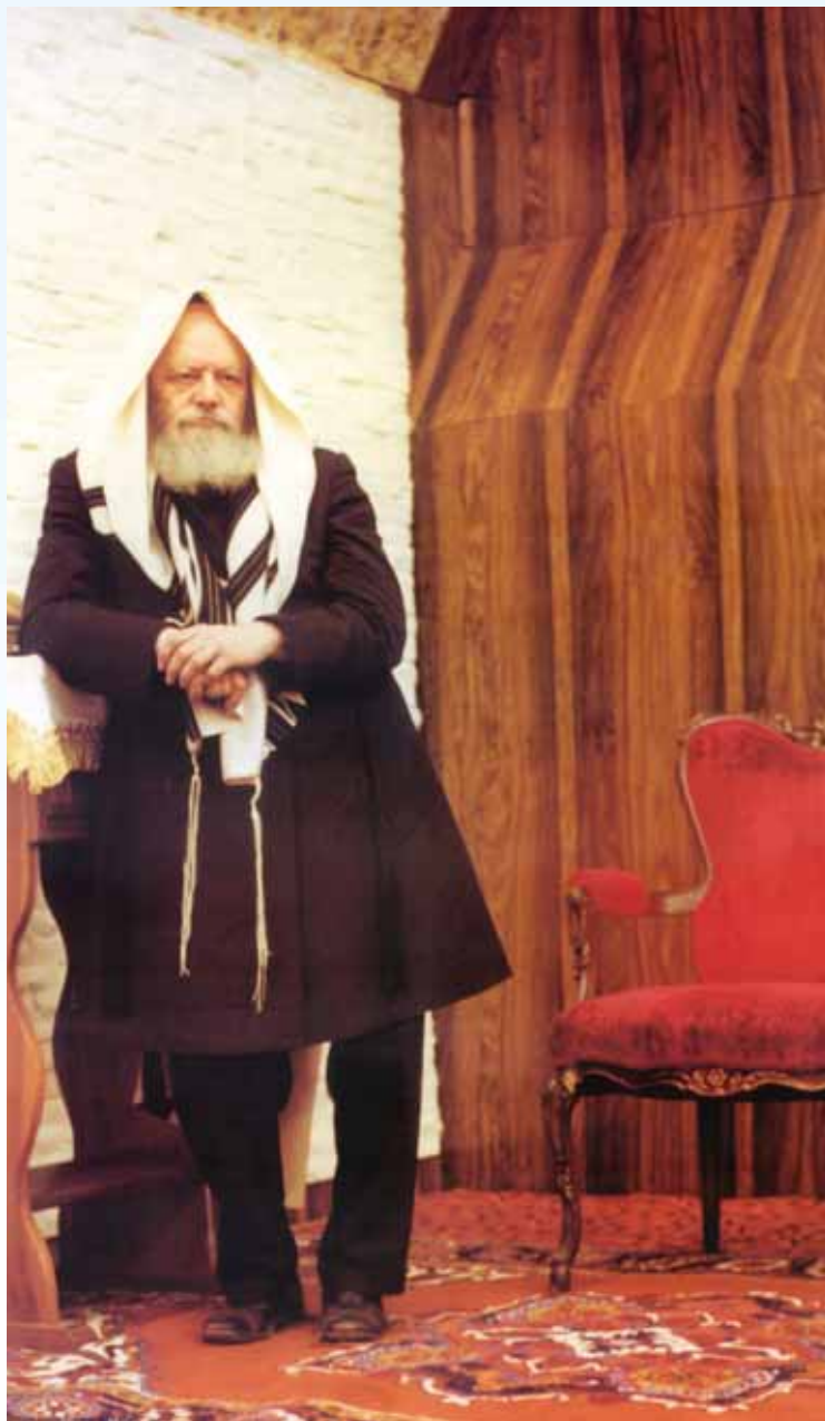
תמונה של הרבי מספר שעות לפני התקף הלב. הושענא רבה תשל"ח.