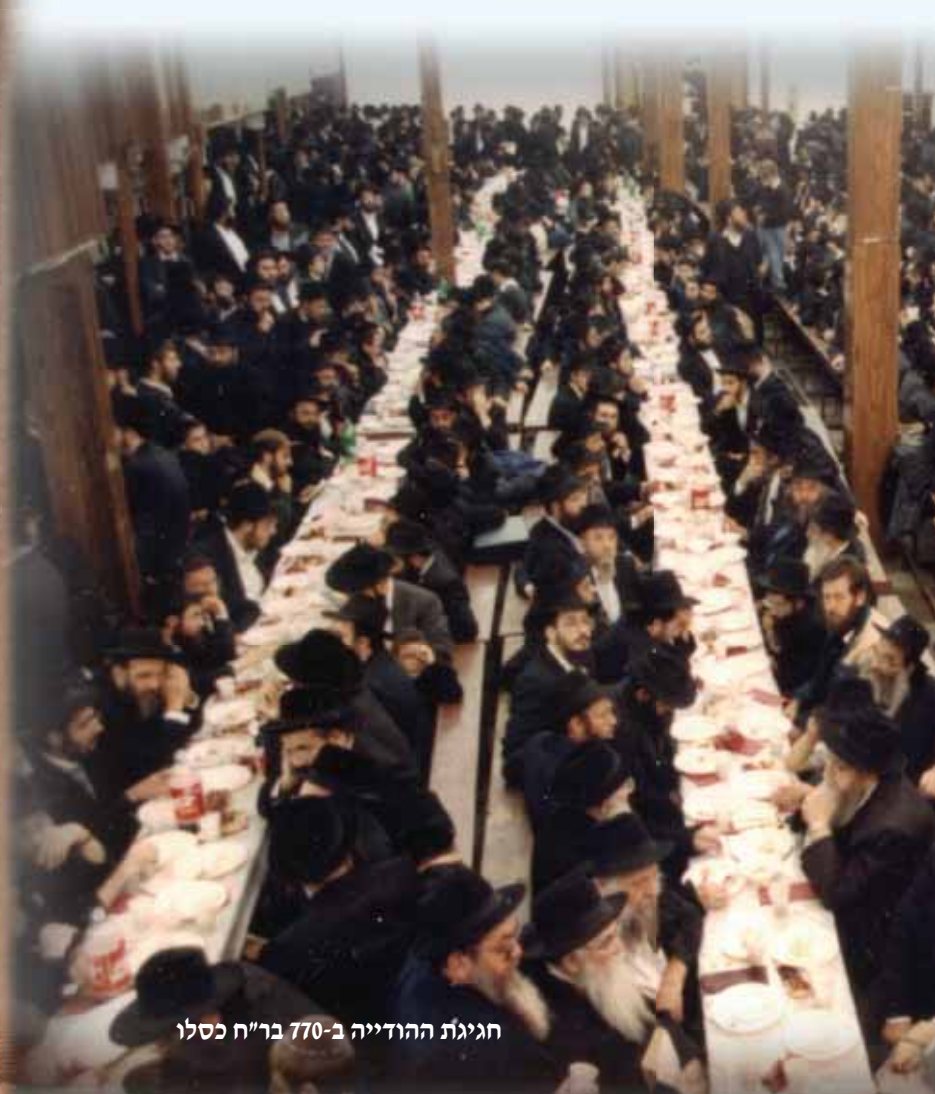
חגיגת ההודייה ב-770 בר"ח כסלו

הגיע ב - 10:05 וכשנכנס חיך לד"ר ל., יצא לקריה"ת וקבל עלי'. יצא למנחה ולא - למעריב כי נסע לביתו ב - 6:50.