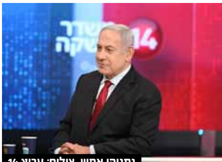
נתניהו אמר.

זו תחושה עולמית. המדינות הערביות שהיו קשורות איתנו בזמן הממשלה הראשונה כי הבינו שנעמוד מול איראן, היום כולם שולחים משלחות לאיראן ולטורקיה - ולא במקרה".