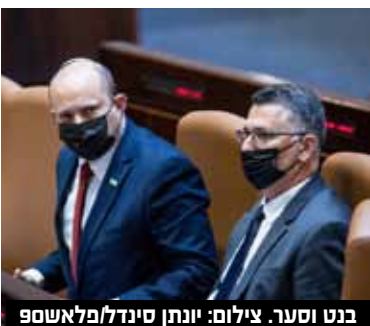
בנט וסער.

במקרה זה, הליכוד יזכה ל-35 מנדטים, יש עתיד ל-19, מפלגתו של גדעון סער ל-4, רע"מ ל-6, חול לבן ל-11, ש"ס ל-9, יהדות התורה ל-7, ישראל ביתנו ל-7, העבודה ל-8, הצינות הדתית ל-7, מרצ ל-4, וימינה ל-19.