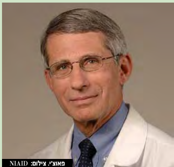
פאוצ'י.

דרום אפריקה, החוששת מקריסת ענף התיירות שטרם התאושש מהגלים הקודמים של המגיפה, התלוננה שהיא נענשת במקום לזכות בשבחים על שגילתה את הזן החדש. "צריך לשבח מדע מצויין ולא להעניש אותו", נכתב בהצהרת משרד החוץ של דרום אפריקה, שתקפה את איסורי הנסיעות