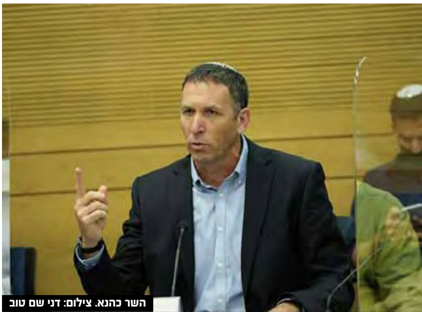
השר כהנא.

היום בשיבת הממשלה הוחלט כי הסמכות לפתוח בדין משמעתי לרבני ערים, תוחזר לשר המשפטים לשר לשירותי דת, כפי שהיה לפני שהמשרד פורק בשנת 2003. השר כהנא אמר: "אני מתכוון לעשות סדר בחקיקה בתחום הזה, חקיקה כזו שתגן על חופש הביטוי של רבני ערים".