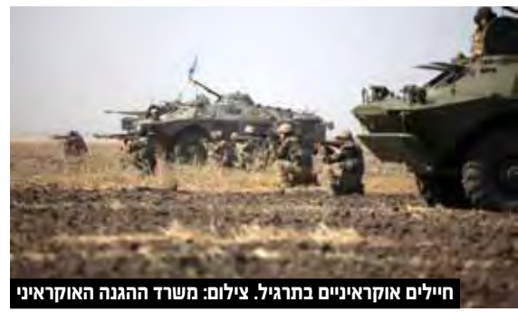
חיילים אוקראיניים בתרגיל.

את החלקים הנרחבים שנשלטים באלימות על ידי הבדלנים הרוסיים. בתגובה, טען נשיא אוקראינה, וולודימיר זלנסקי, כי לאוקראינה אין תוכניות לכבוש את האזורים וכי הרטוריקה הרוסית נועדה לפגוע במאמצי של אוקראינה לחבור לברית הצבאית עם נאט"ו. כזכור, בתחילת השנה קיבלה אוקראינה מארצות הברית משלוח נשק שכלל בין היתר טילים מתקדמים נגד טנקים מסוג ג'אולין, מרגמות ומל"טי תקיפה טורקיים. "זה רעיון רע לפחד כאשר מישוהו בא לביתך ואתה בזמן הזה מתחבא במרתף. זה לא יעבוד", אמר החייל האוקראיני ולאד, "מישהו צריך לקום ולהלחם".