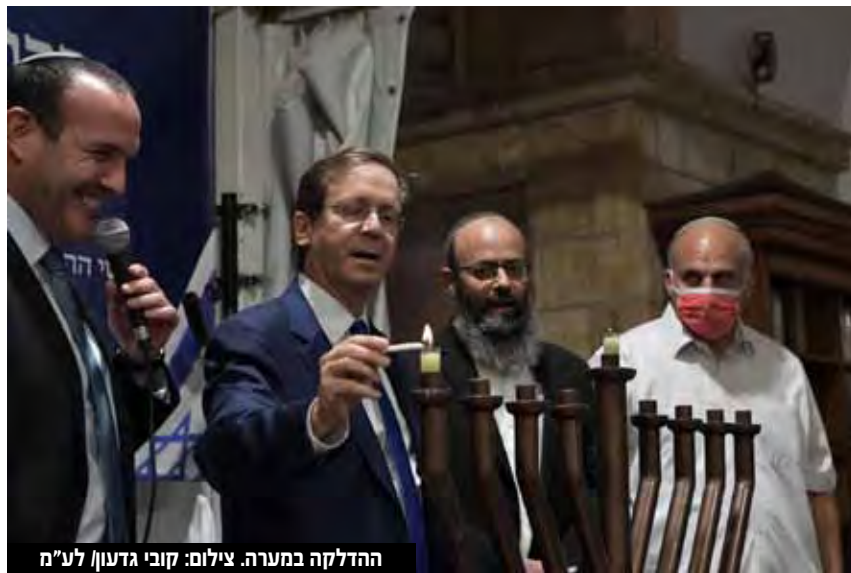
ההדלקה במערה.

המשטרה בתגובה מונעת מהם להיכנס לאזור הביקור ואף הוצא צו על ידי אלוף הפיקוד כדי למנוע את כניסתם. מתנועת שלום עכשיו נמסר בתגובה לחסימת המפגינים בכניסה לקריית ארבע: "בזמן