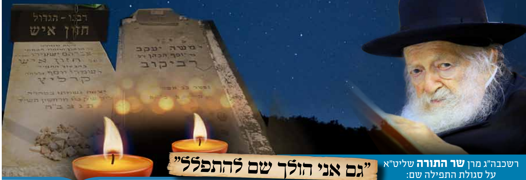
רשכבה"ג מרן שר התורה שליט"א על סגולת התפילה שם: