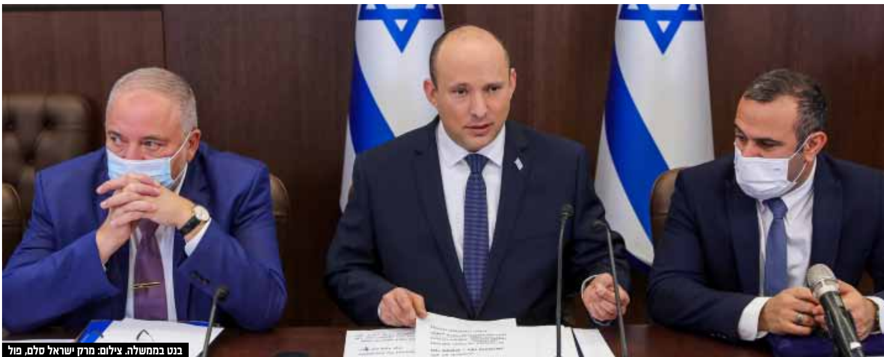
בנט בממשלה.

ראש הממשלה אמר בפתח ישיבת הממשלה: "המשימה שלנו כממשלה היא לאפשר חיים שגרתיים ככל האפשר. לשם כך, אנחנו מבצעים הערכת מצב בכל יום מחדש, מעריכים בכל יום את גודל וסוג האיום, ומתאימים לכך את הצעדים וההגבלות"