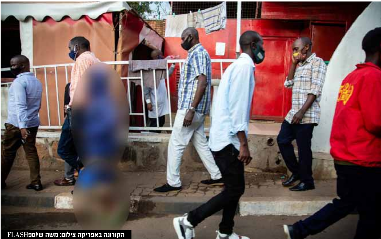
הקורונה באפריקה

עדיין לא ברורה מידת חומרתו של הזן החדש • אפריקה, בה רוב מוחץ של האוכלוסייה איננו מחוסן, לא יכולה להוות דוגמה למדינות המערב בהם ייתכן שתהיה התמודדות טובה יותר