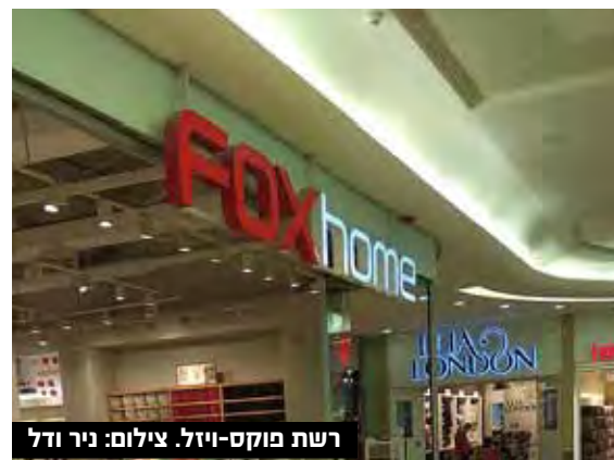
רשת פוקס-ויזל.

מכירות ללין עלו ב-22% ברבעון ל-71 מיליון שקל, בשל פתיחת שמונה חנויות חדשות לעומת רבעון מקביל, עיתוי חגי תשרי והאטה במכירות ברבעון מקביל. הרווח התפעולי שנבע מפעילות עלה ב-22.6% ל-17.3 מיליון שקל, וזאת למרות שברבעון המקביל צמצמה החברה את מרבית הוצאות הפעולה בשל הסגר.