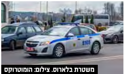
משטרת בלארוס.

מאיה לפני שהשלטונות בבלארוס יגישו נגדה כתב אישום. בני המשפחה המודאגים פנו ליו"ר לשכת עורכי הדין אבי חימי ולעורך הדין שרון נהרי המתמחה במשפט בין-לאומי כדי שיסייעו לשחרר את מאיה. השניים שלחו מכתב בהול אל שר החוץ יאיר לפיד שזה יפנה לשלטונות בבלארוס. "מתחננת לראש הממשלה, לשר החוץ יאיר לפיד, כל מי שיכול לעזור - שיעזור", אומרת אימה בבכי. "שיחזירו לנו אותה הביתה. היא לא צריכה להיות שם. יש לה ילדים זקוקים לה. אנחנו לא יכולים ככה לחכות. אני מתחננת. אני מתחננת שיחזירו אותה הביתה". ממשרד החוץ נמסר בתגובה: "הנושא מוכר ומטופל על ידי המשרד. שגריר ישראל בבלארוס ביקר את העצורה. אנשי משרד החוץ נמצאים בקשר עם בני המשפחה ועורכי הדין הישראליים של המשפחה".