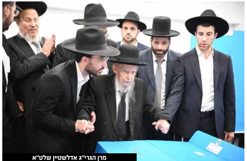
מרנן הגר"ג אדלשטיין שליט"א