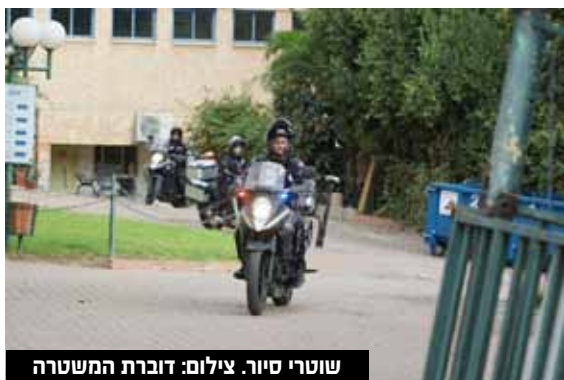
שוטרי סיור.

המשטרה פעלה על מנת להבטיח הליך הצבעה תקין בתיאום מלא ובשיתוף פעולה עם ועדת הבחירות המרכזית. יום הבחירות לכנסת ה-25 עבר עד לסגירת