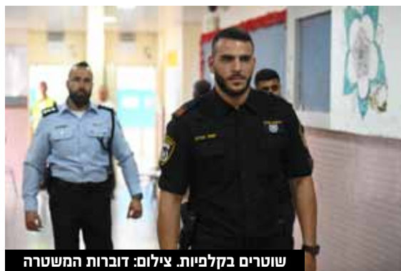
שוטרים בקלפיות.