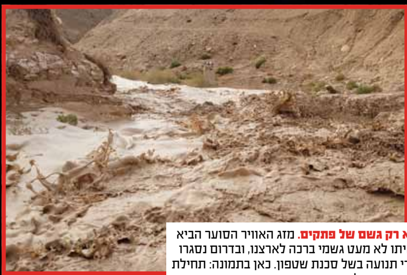
לא רק גשם של פתקים . מזג האוויר הסוער הביא איתו לא מעט גשמי ברכה לארצנו, ובדרום נסגרו צירי תנועה בשל סכנת שטפון. כאן בתמונה: תחילת שטפון בנחל אוג.