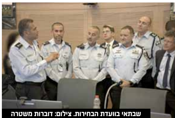
שבתאי בוועדת הבחירות.