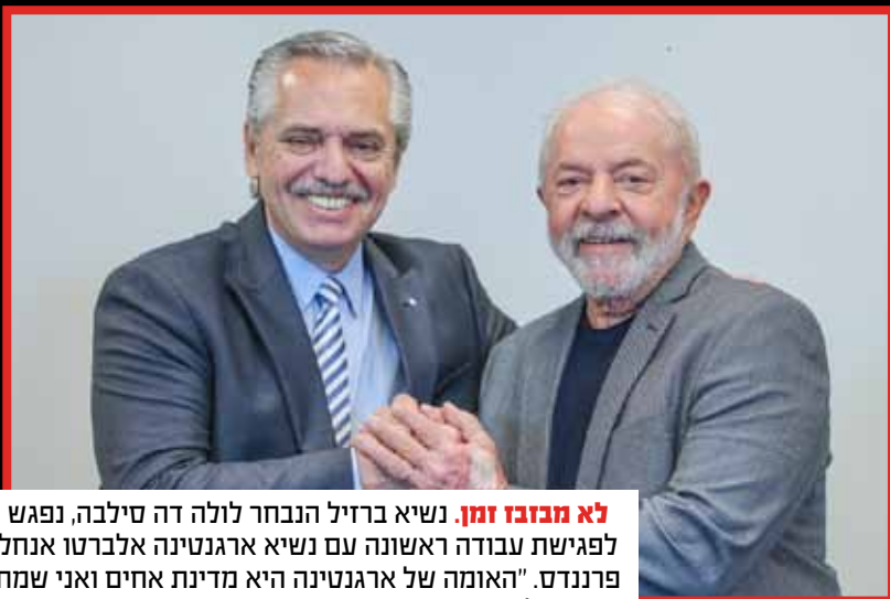
לא מבזבזו זמן. נשיא ברזיל הנבחר לולה דה סילבה, נפגש לפגישת עבודה ראשונה עם נשיא ארגנטינה אלברטו אנחל פרננדס. "האומה של ארגנטינה היא מדינת אחים ואני שמח שחזרנו לידידות" כתב הנשיא הנבחר.