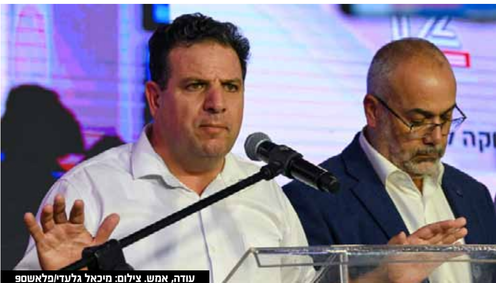
עודה, אמש.