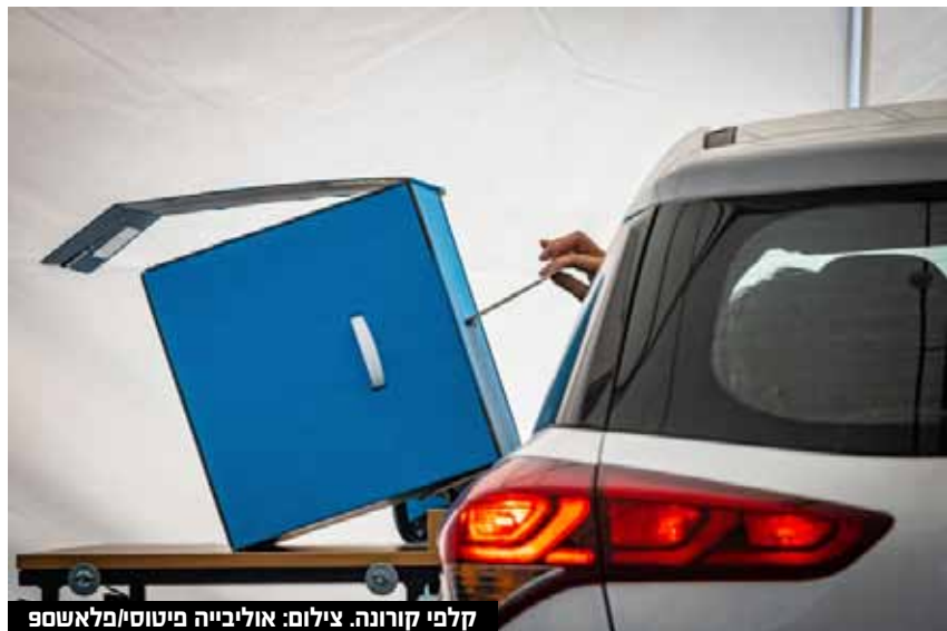
קלפי קורונה.

אחוז ההצבעה בבחירות עמד על 71.3% - הגבוה ביותר מאז 2015. עד למועד כתיבת השורות, 25.2% מהקולות נספרו. לפי ספירת הקולות: הליכוד - 33, יש עתיד - 22, הציונות הדתית - 15, ש"ס - 13, המחנה הממלכתי - 12, יהדות התורה - 11, ישראל ביתנו - 6, חד"ש-תע"ל - 4 (3.46%), העבודה - 4 (3.33%), לא עוברות: רע"מ - 2.97%, מרצ - 2.76%, בל"ד - 2.76%, הבית היהודי - 1.34%. תמונת הגושים: תומכי נתניהו - 72, חד"ש-תע"ל - 4, הקואליציה הנוכחית - 44. כאמור, מדובר בנתונים ראשוניים בלבד.