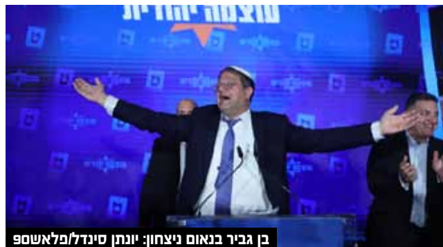
בן גביר בנאום ניצחון.