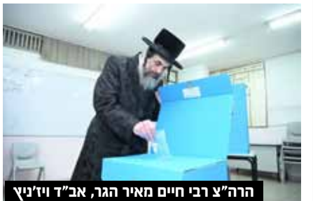
הרה"צ רבי חיים מאיר הגר, אב"ד ויז'ניץ