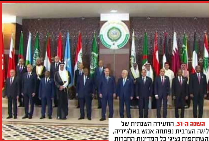
השנה ה-51 . הוועידה השנתית של הליגה הערבית נפתחה אמש באלג'יריה, בהשתתפות נציגי כל המדינות החברות בה.