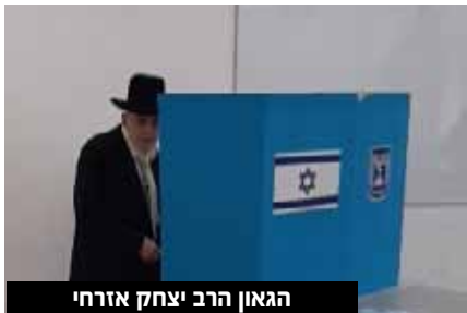
הגאון הרב יצחק אזרחי