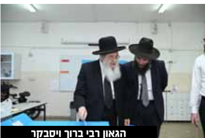
הגאון רבי ברוך ויסבקר