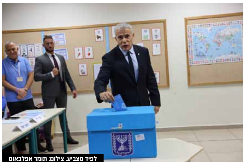
לפיד מצביע.

"הלילה הזה הולך להמשך יומיים", פתח לפיד. "עד שלא תיספר המעטפה האחרונה שום דבר לא נגמר ולא נסגר. אנחנו נחכה בסבלנות - גם אם אין לנו