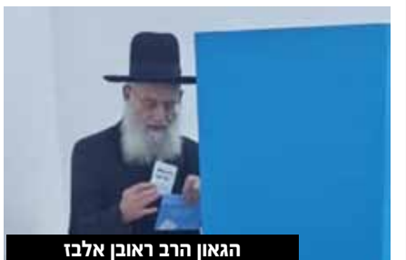
הגאון הרב ראובן אלבו