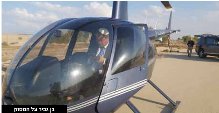
בן גביר על המסוק

רק ממשלת ימין על מלא ולא חלילה ממשלת שמאל של נתניהו וגנץ. הבחירות האלו יוכרעו על חודם של קולות בודדים. אני קורא מעומק הלב לכל המצביעים ובמיוחד לאחיי ואחיותיי בני הציבור הדתי לאומי-אל תזרקו את הקול שלכם לפח, תצביעו רק למפלגה בימין שעוברת את אחוז החסימה כדי שחס וחלילה הקול שלכם שהלך לפח היה הקול החסר להגיע ל-61 ולהקמת ממשלה יהודית לאומית וציונית". ח"כ בן גביר טס במהלך יום הבחירות על מסוק מבאר שבע למרכז בעקבות דיווחים על התחזקות של גנץ בקלפיות בנתניה והשרון, כך לדבריו. ח"כ בן גביר אמר אז: "הדיווחים על ההתחזקות של גנץ בקלפיות בשרון הם מדאיגים. אם אנחנו נהיה גדולים - גנץ יהיה באופוזיציה ואני אוכל להיות השר לבטחון פנים. אם נהיה קטנים - יש סכנה לממשלה עם גנץ. חייבים למנוע את זה. חייבים ממשלת ימין".