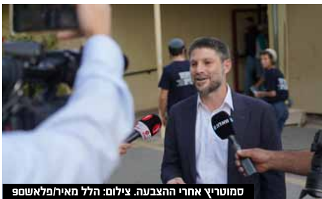
שמוריץ אחרי ההצבעה.