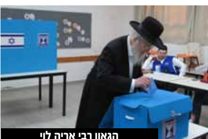
הגאון רבי אריה לוי