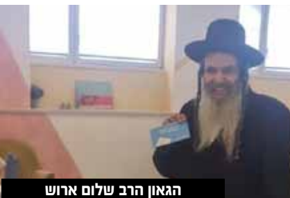
הגאון הרב שלום ארוש