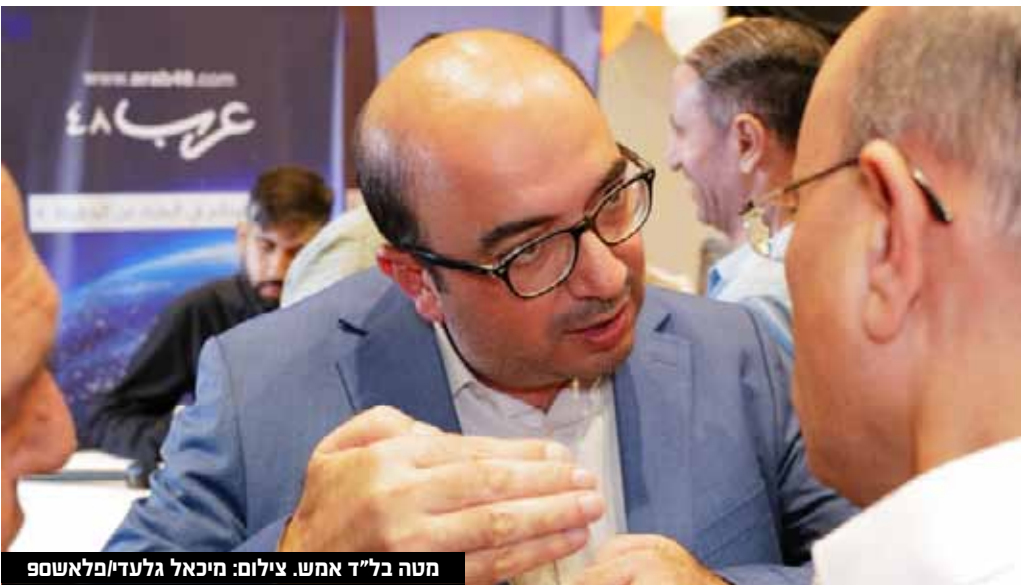
מטה בל"ד אמש.

המפלגה הערבית בל"ד מסכנת את 61 המנדטים של נתניהו, וי"ר המפלגה טוען כי עבר את אחוז החסימה • עודה: "הכהניזם הפך ל-15% מהציבור הישראלי, נעמוד איתן מול הפשיזם והגזענות"