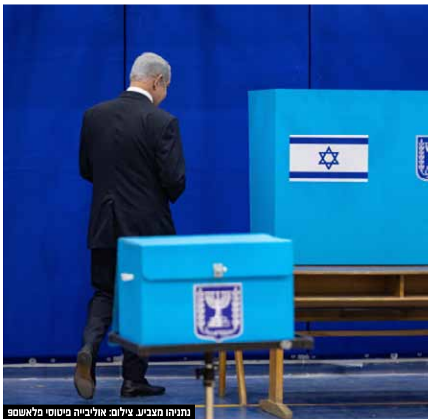
נתניהו מצביע.

הימין חייבים לצאת מהבית ולהצביע". נתניהו אמר ביציאתו מהקלפי: "נתוני הפתיחה מדאיגים, אחוזי הצבעה גבוהים יותר במעוזי יש עתיד והשמאל. קורא לליכודניקים לצאת להצביע מיד מחל".