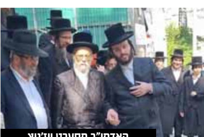
האדמו"ר מסערט ויזניץ