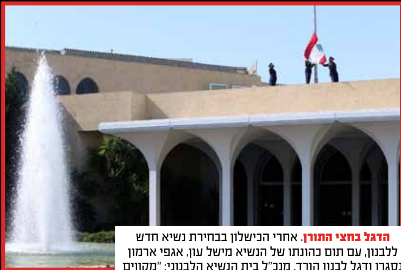
הדגל בחצי התורן. אחרי הכישלון בבחירת נשיא חדש ללבנון, עם תום כהונתו של הנשיא מישל עון, אגפי ארמון נסגרו ודגל לבנון הורד. מנכ"ל בית הנשיא הלבנוני: "מקווים לבחור נשיא בהזדמנות הראשונה".