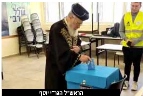
הראש"ל הגר"י יוסף