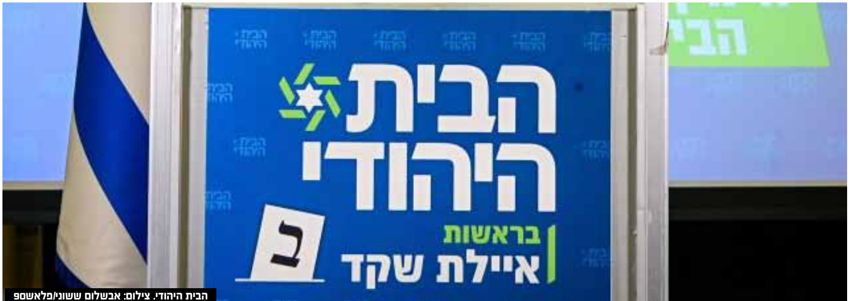
הבית היהודי.