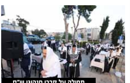
תפילה על קברי מנהיגי ש"ס