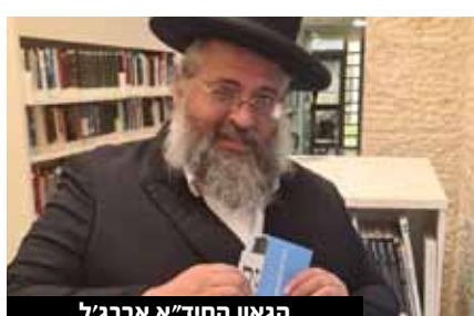
הגאון החיד"א אברג'ל