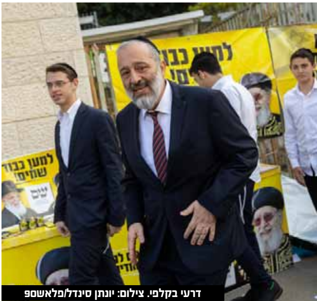
דרעי בקלפי.