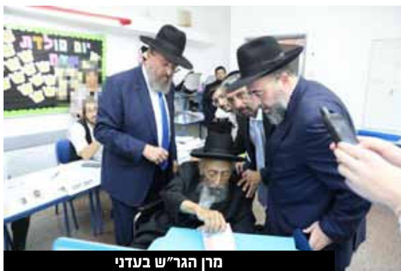
מרן הגר"ש בעדני