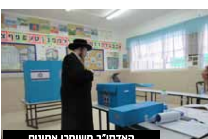
האדמו"ר משומרי אמונים