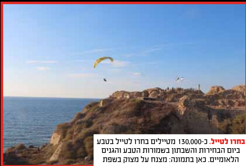
בחרו לטייל - כ-130,000 מטיילים בחרו לטייל בטבע ביום הבחירות והשבתון בשמורות הטבע והגנים הלאומיים. כאן בתמונה: מצנח על מצוק בשפת החוף.