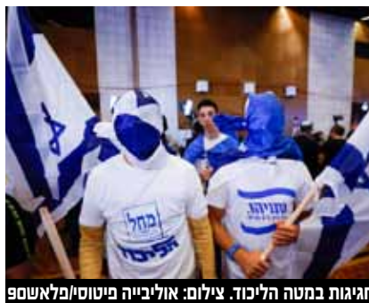
חגיגות במטה הליכוד.

נתניהו, והיום הגיעה לשיא - רמת אבטחה של ראש ממשלה.