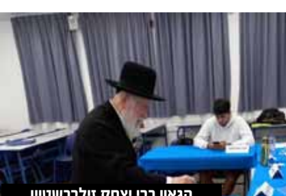
הגאון רבי יצחק זילברשטיין