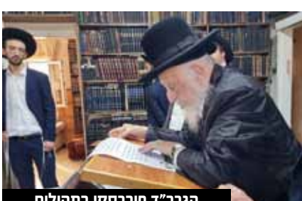
הגרבי"ד מברסקי בתהלים