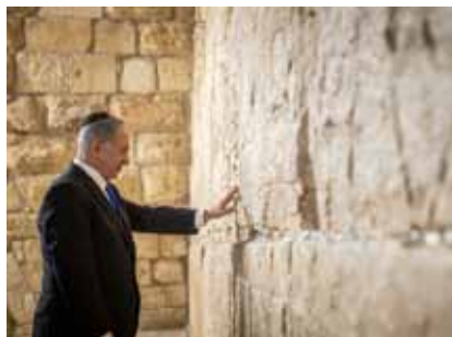
נתניהו בכותל לילה לפני.

הימין חייבים לצאת מהבית ולהצביע". נתניהו אמר ביציאתו מהקלפי: "נתוני הפתיחה מדאיגים, אחוזי הצבעה גבוהים יותר במעוזי יש עתיד והשמאל. קורא לליכודניקים לצאת להצביע מיד מחל".