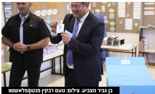
בן גביר מצביע.

ההוקרה לפעילים: "נעם לא נעלמה ולא תיעלם לשום מקום. אנחנו ממשיכים בכל העוז את מה שהתחלנו בכנסת הקודמת: לחשוף לציבור את האמת על הארס שחדר למערכות הציבוריות ולעמוד כחומת מגן בפני כל ניסיון לערער ולטשטש את זהותה היהודית של המדינה ומגבירים הילוך בעשייה?". "מחד, ניקוי המערכות הציבוריות מנזקי הפוסטמודרנה שהוטמעו בהן בעזרת כספי הקרנות והמדינות הזרות, ובעיקר במערכת הנינוך ובצה"ל. נשים בע"ה קץ למציאות שבה מוחם של ילדי ישראל נשטף בתכנים מנוכרים לאנושיות וליהדות, בניגוד מוחלט לרצון הוריהם. נשים קץ בע"ה למציאות שבה צה"ל ושאר כוחות הביטחון מתנהלים על פי שיקולים אחרים מלבד ביטחון מדינת ישראל ואזרחיה והכרעת הקמים עלינו לכלותנו". "ומאידך, נפעל לחיזוק דמותה וזהותה היהודית של ישראל. נחזק ונעצים את מעמדה של הרבנות הראשית. נתקן את מערכות הגיוור והכשרות מנזקי העבר, יד ביד עם הרבנים הראשיים לישראל. נחזק את מעמד השבת במרחב הציבורי. בניגוד לשקרים שטפלו עלינו שוב ושוב, לא ניגע ולא נתערב בחיי הפרט של אף אחד, אבל מצד שני, לא ניטוש את אחריותנו ולא נרפה מתפקידנו ביחס לכל מה שנוגע לפרהסיא של מדינתנו, לדמותה ולזהותה", דברי מעוז.