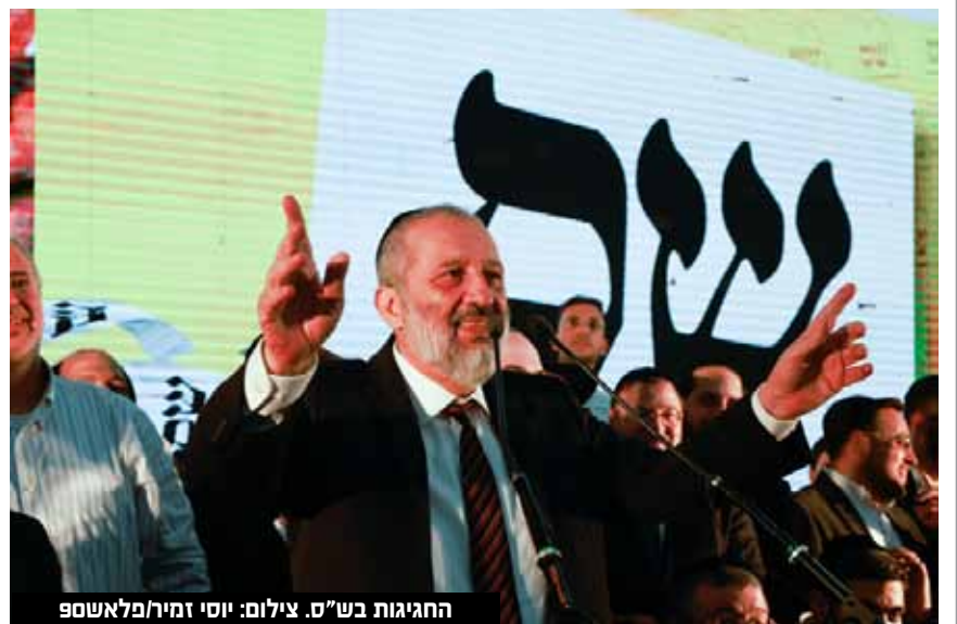
החגיגות בש"ס.