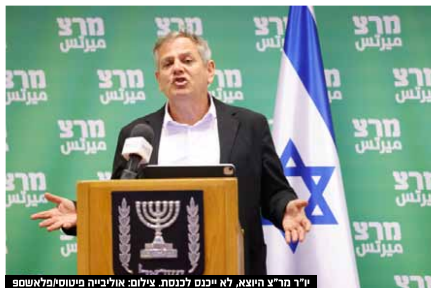
יו"ר מרצ היוצא, לא ייכנס לכנסת.