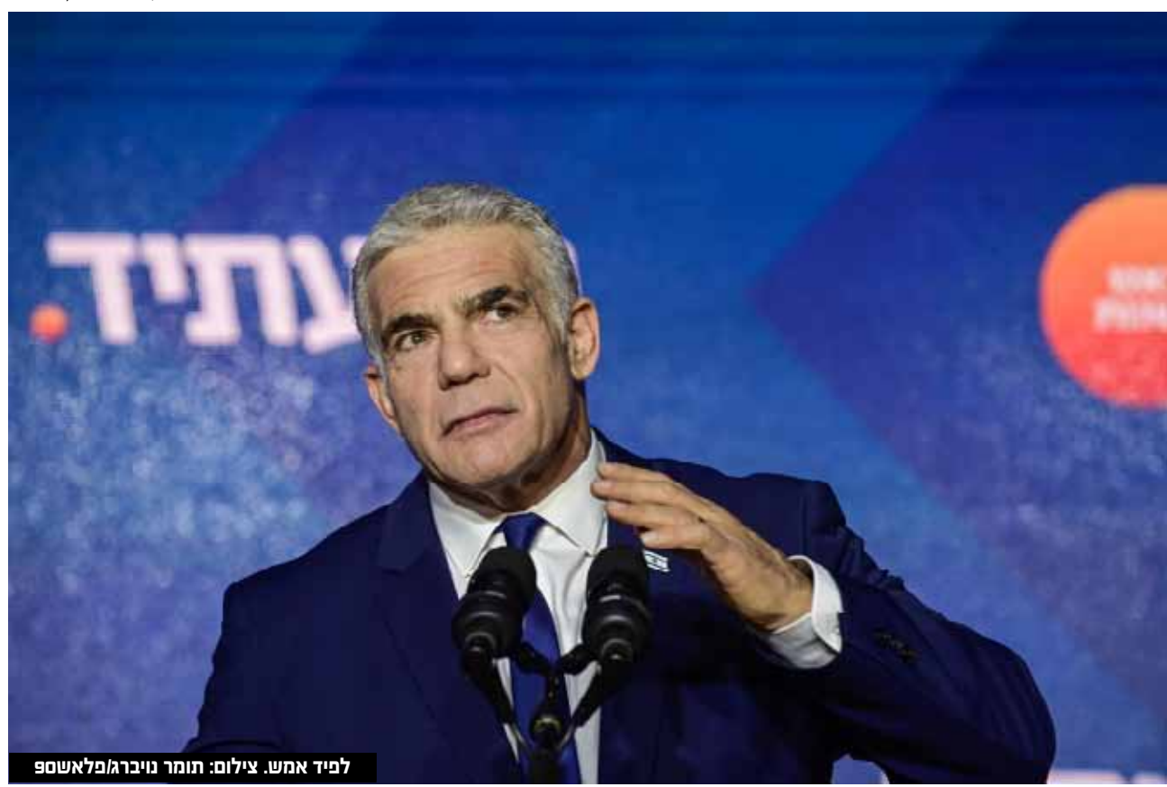
לפיד אחש.