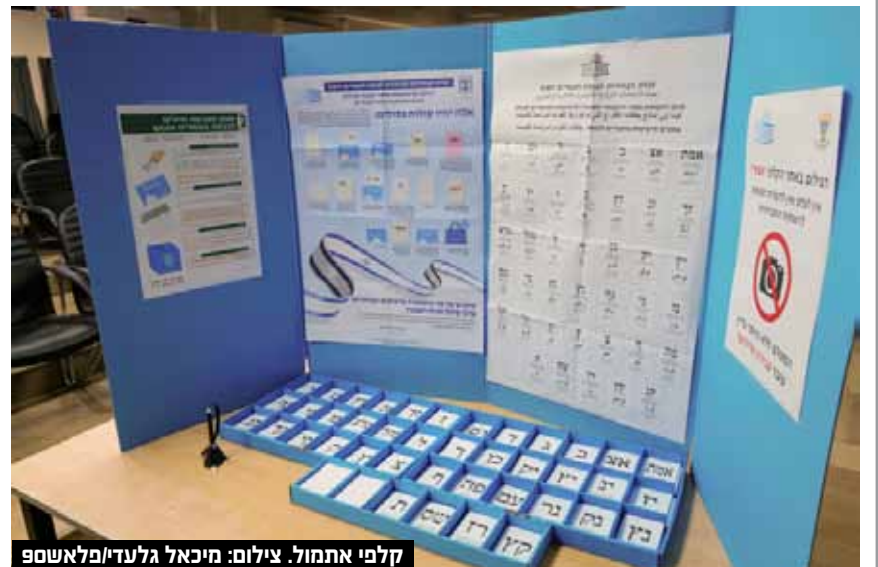
קלפי אתמול.