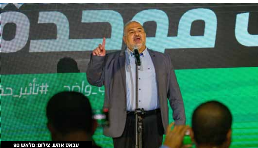
עבאס אמש.

בישראל אם אתה לא חלק מהרשות המבצעת. הייתי קצת באופוזיציה וקצת בקואליציה. הבדל עצום בין כאן ולכאן. אנחנו נשמח להיות חלק מהאווירה היא של ייאוש".