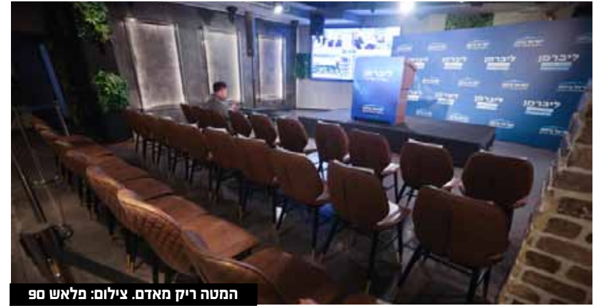
המטה ריק מאדם.