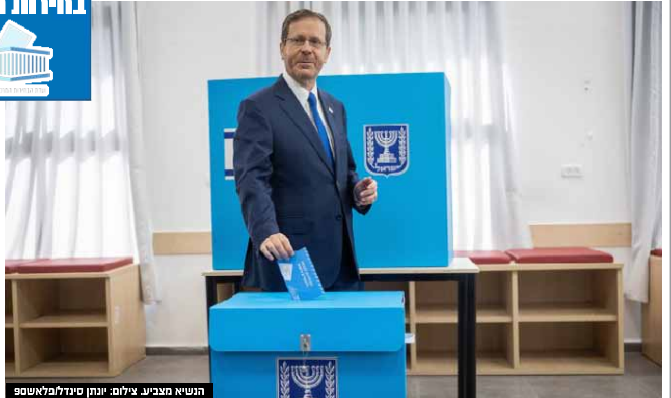
הנשיא מצביע.

המפלגות הערביות (חד"ש-תע"ל ורע"מ) עוברות ומקבלות גם הן 4 מנדטים כל אחת, למעט בל"ד שלא עוברת את אחוז החסימה. הבית היהודי בראשות איילת שקד נותרה הרחק מאחור. גוש הימין מנצח את מערכת הבחירות הזו וזוכה ל-61 מנדטים, לעומת 59 מנדטים בלבד לגוש הפדר והערבים.