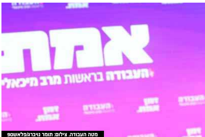
מטה העבודה.