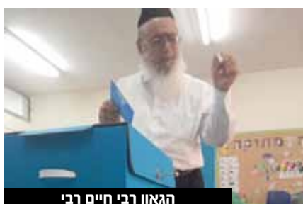
הגאון רבי חיים רבי