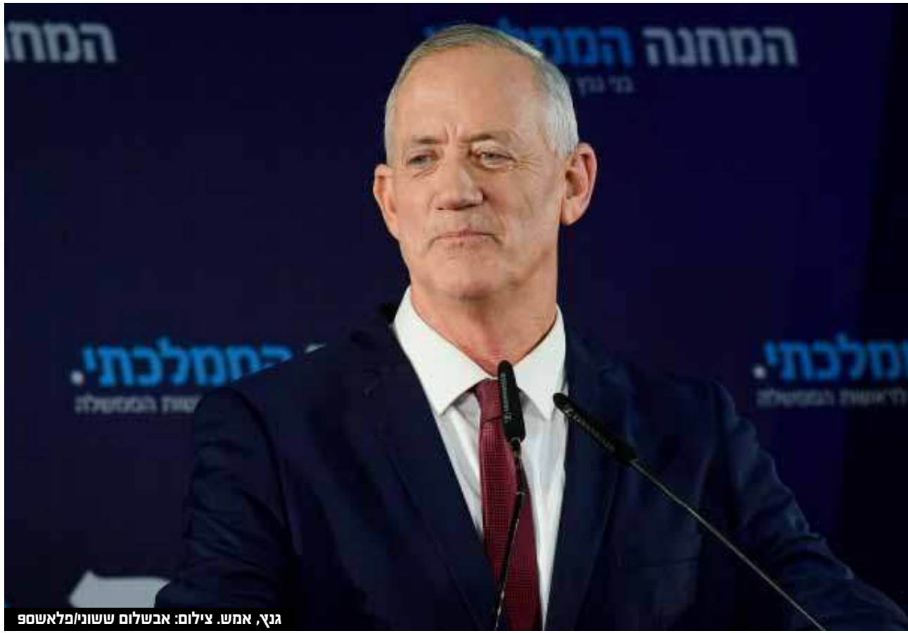
גנץ, אמש.