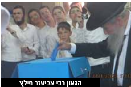
הגאון רבי אביעזר פילץ