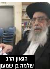
הגאון הרב שלמה בן שמעון