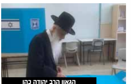
הגאון הרב יהודה כהן