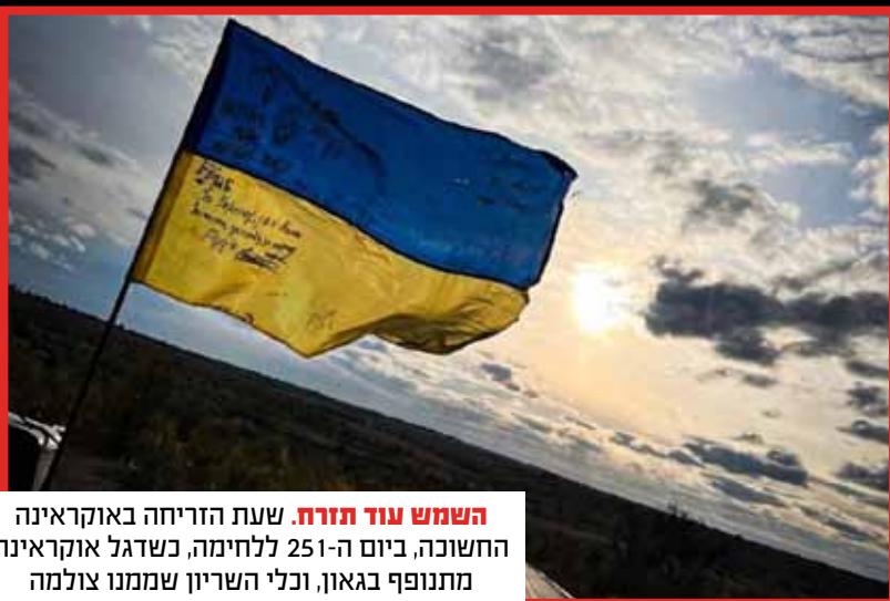
השמש עוד תזרח . שעת הזריחה באוקראינה החשוכה, ביום ה-251 ללחימה, כשדגל אוקראינה מתנופף בגאון, וכלי השריון שממנו צולמה התמונה נראה בתחתית.