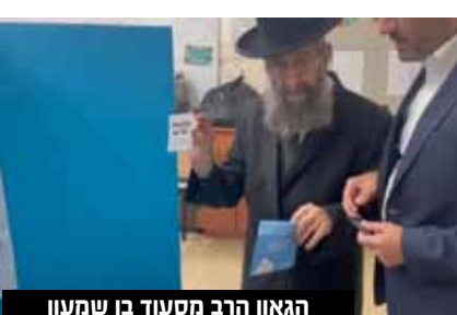
הגאון הרב מסעוד בן שמעון