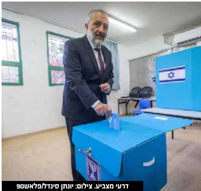
דרעי מצביע.