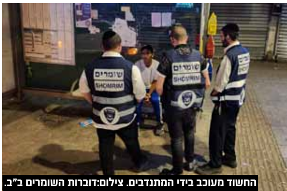
החשוד מעוכב בידי המתנדבים.

קריית שמונה, בעל עבר פלילי - שזוהה כגנב סידרתי המבצע מקרי פריצה רבים בעיר - עוכב במקום עד להגעת שוטרי סיוור של משטרת מרחב דן שהובילו אותו להמשך חקירה. בהמשך יוחלט האם להביאו בפני שופט לצורך הארכת מעצרו.