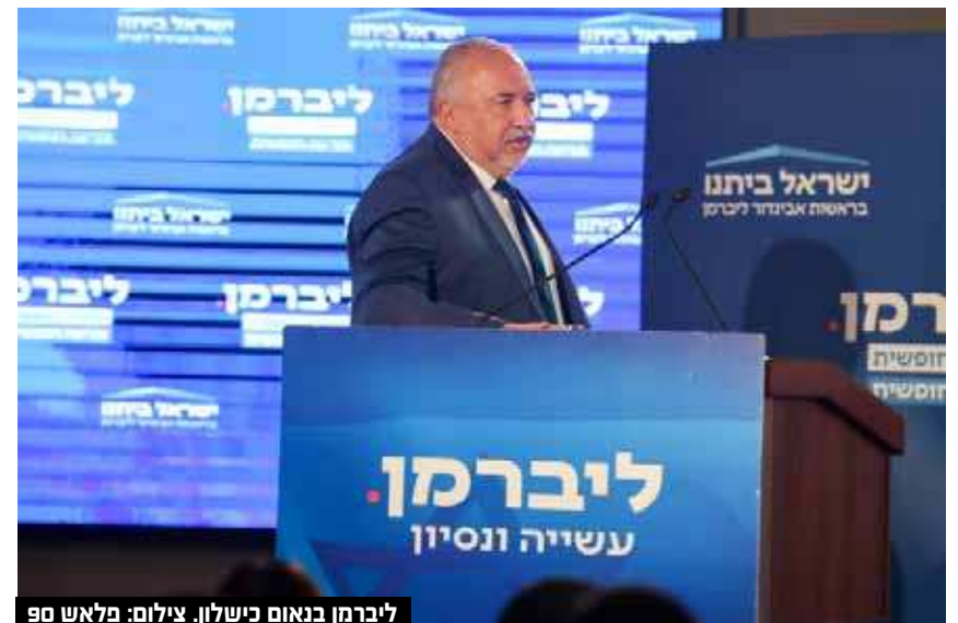
ליברמן בנאום כישלון.