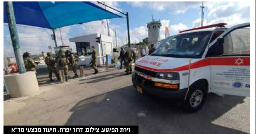
זירת הפיגוע.