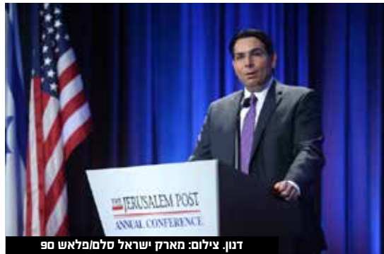
דנון. צילום: מארק ישראל סילמפלדאש 90

אחרי הניצחון הדי ברור של גוש הימין ומפלגת הליכוד, הקרבות על התפקידים טרם החלו באופן בולט אך יש מי שכבר מסמן מטרה. דני דנון השגריר לשעבר וחבר הכנסת הנבחר הודיע כי "אתמודד על תפקיד יו"ר הכנסת". אחרי פרסום התוצאות אמר דנון: "הכנסת היא הריבון. אזרחי ישראל בחרו אתמול כנסת חדשה. על הכנסת הנבחרת להחליף מיד עם השבעתה את יו"ר הכנסת הנוכחי מידי לוי על מנת שגשיב את השליטה על המהלכים בכנסת לידי הליכוד, מפלגת השלטון". השגריר לשעבר הוסיף, "אחרי שנה בה נרמס מעמד הכנסת ע"י ממשלת לפיד, בכונתי להתמודד על תפקיד יו"ר הכנסת ולהחזיר את הכנסת למקומה הראוי". לפי גורמים בליכוד, השמות שצפויים להצטרף למרוץ לקבלת התפקיד הנחשק הם חברי הכנסת יריב לוין,