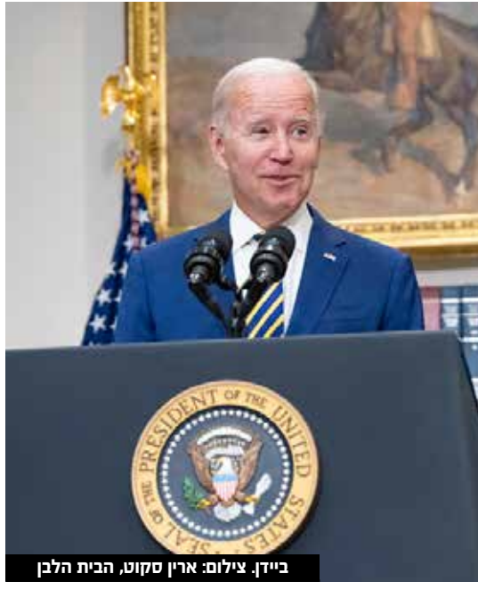
ביידן, צילום: ארין סקוט, הבית הלבן

ססיים את נאומו באוניברסיטת צפון קרוליינה בעניין טכנולוגיה חקלאית, בסוף הנאום הוא הסתובב ונראה מושיט את ידו ללחיצה - אלא שאף אחד לא היה לציודו. ביידן היה נראה מבולבל מעט מלחיצה היד לאוויר לפני שירד מהבמה, והתייער הפך לאחת הבדיחות ברשת. בדרכו לעלות על המטוס בדרך ללוס אנג'לס, ביידן נמנע מלהתייחס לכתבים שהגיעו למקום ומיהר במדרגות, מה שגרם לו לאבד שליטה למעור באופן מביך למדי. ועד שכבר הצליח להתייבב, שוב איבד אחיזה וצנח על המדרגות. במהלך טקס כבוד האומה לארבעה מחיילי הצבא האמריקאי, שנלחמו בגבורה במלחמת וייטנאם, ג'ו ביידן העניק לכל אחד מהם מדליית הוקרה. אחד הנבחרים, דווייט ו. בירדוול, קיבל את המדליה על עזרתו ביציאה מווייטנאם ופינוי פצועים בשנת '68, למרות הפציעות הקשות שלו בפלג גופו העליון ופניו. כשביידן התכוון להניח את המדליה על צווארו, הוא הניח אותה הפוך, כאשר תליון הכוכב הולבש על גבו של בירדוול. הסרטון של הטעות הפך לויראלי ברשתות החברתיות, כאשר הגולשים החלו לטעון כי "אינו כשיר להיות נשיא".