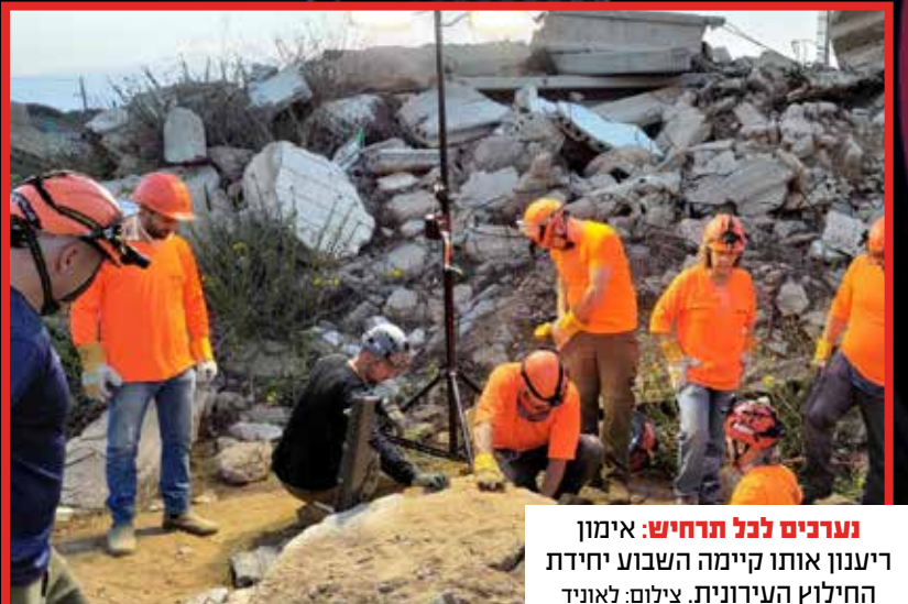
נערכים לכל תרחיש: אימון ריענון אותו קיימה השבוע יחידת החילוץ העירונית.