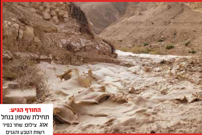
החורף הגיע: תחילת שטפון בנחל אוג