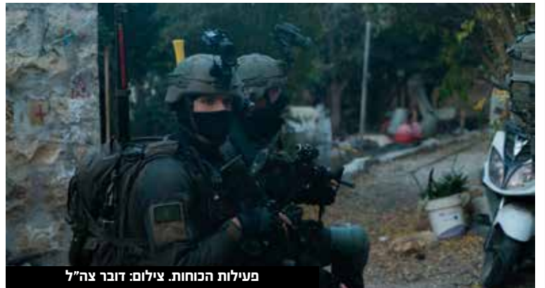
פעילות הכוחות.

עשרת המבוקשים שנעצרו הועברו להמשך חקירת כוחות הביטחון, ודובר צה"ל עדכן ב"ה כי אין נפגעים לכוחותינו.