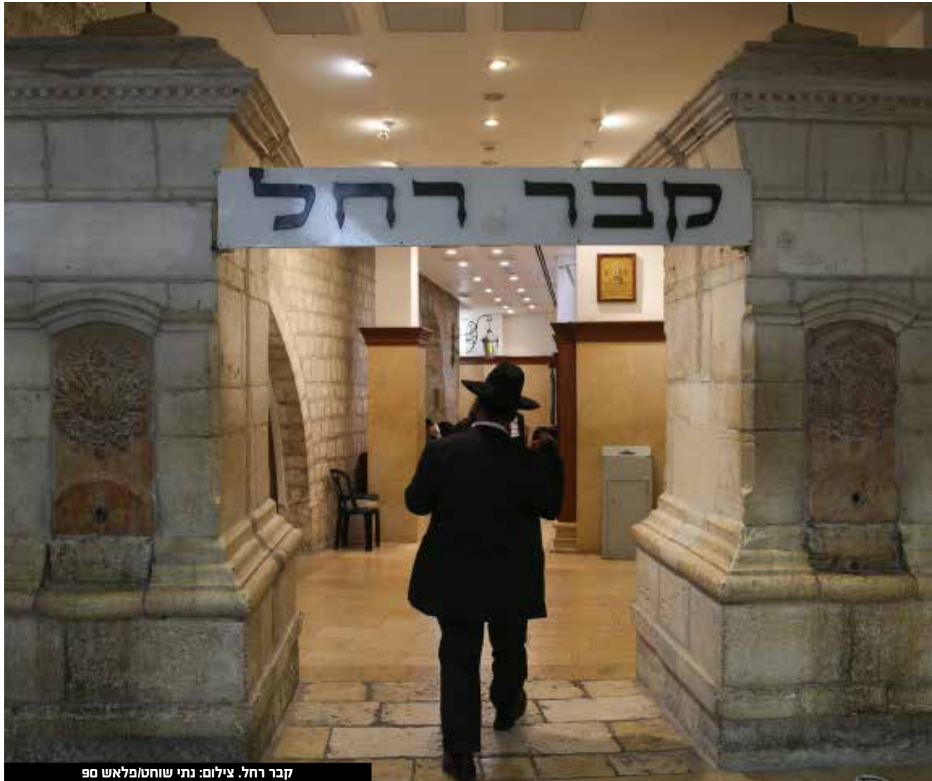
קבר רחל.

צומת הרומרין מצומת המנהרות וצומת טנטור צפויים להיסגר לסירוגין, זאת בהתאם לעומסי התנועה במקום.