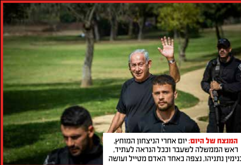
המנצח של היום: יום אחרי הניצחון המוחץ, ראש הממשלה לשעבר וככל הנראה לעתיד, בנימין נתניהו, נצפה כאחד האדם מטייל ועושה כושר בגן סאקר