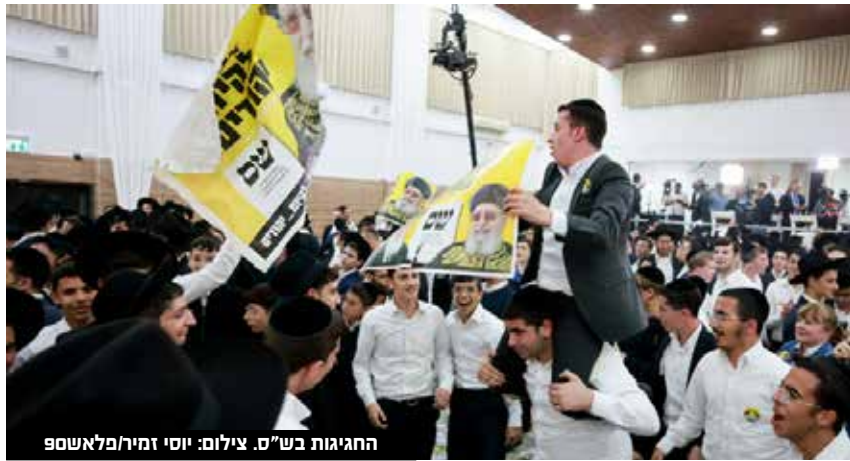
החגיגות בש"ס.

עוד טען חבר הכנסת כי "אני מסתכל על הערים, ברוב ערי הפריפריה וגם בירושלים גדלנו באופן משמעותי. אנשים ראו מפלגה אמينة, יציבה, מפלגה שבאמת נלחמה שנה וחצי באופן מושלם בממשלה הזו, לא זגוגנו מעולם".