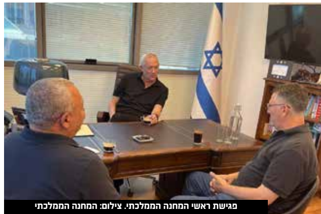
פגישה ראשי המחנה הממלכתי.

"לפיד לא דאג לחיבור של המפלגות הערביות, הוא לא דאג לחיבור מרצ והעבודה, הוא לא דאג להסכמי עודפים, והוא לא דאג לקרוא להצבעה למרצ בכדי