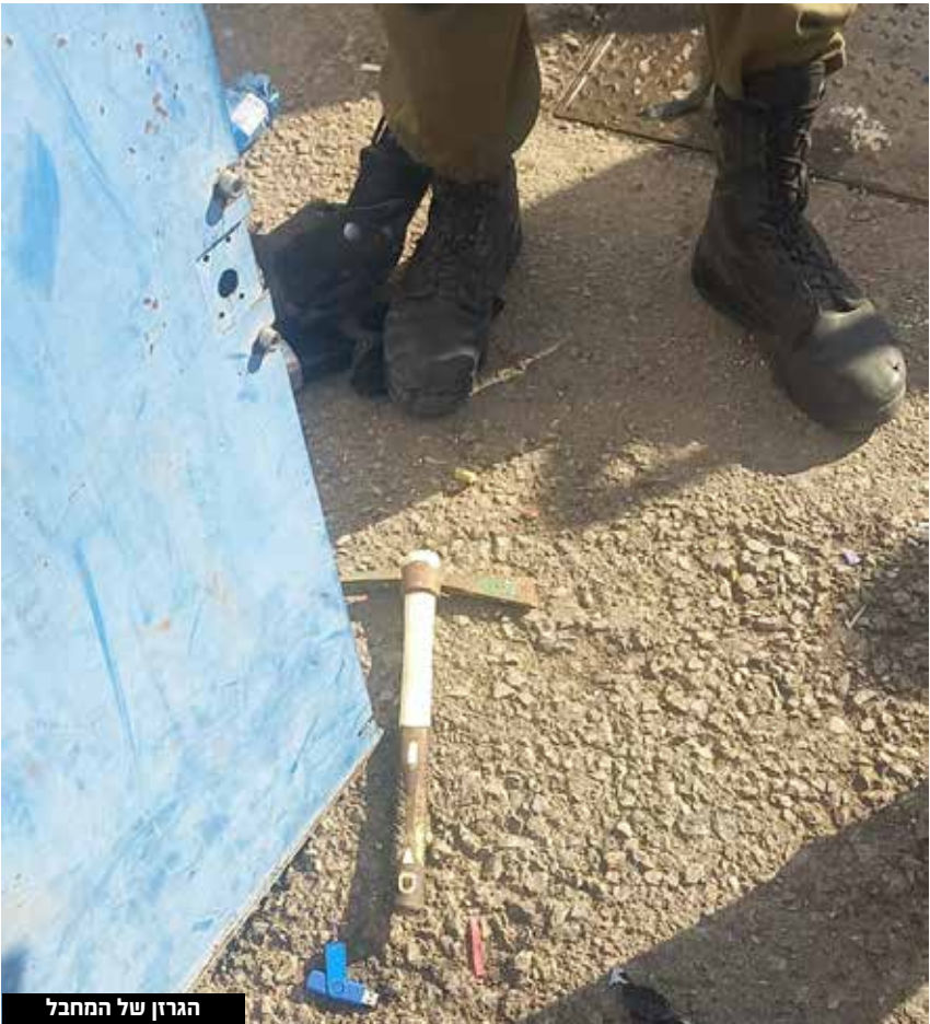
הגרזן של המחבל

דוד גולדברג גל הטרור: מחבל דרס לוחם צה"ל סמוך למחסום מכבים בבנימין, ניסה לדקור אותו - נורה וחוסל. הצעיר, שנפצע באורח קשה, פונה לבית החולים שערי צדק בירושלים עם חבלות בגפיים. הפרמדיקים דיווחו: "הפצוע היה בהכרה מלאה וסבל מחבלות בגפיים. הענקנו לו טיפול רפואי שכלל עצירת דימומים, קיבועים ומתן תרופות לשיכוך כאבים ופינינו אותו במהירות בניידת טיפול נמרץ של מד"א תוך כדי המשך טיפול רפואי לבית החולים". מבית החולים נמסר תחילה כי "ליחידת הטרואומה במרכז הרפואי שערי צדק הגיע פצוע פיגוע הדריסה במחסום מכבים. הפצוע, בשנות ה-20 לחייו,