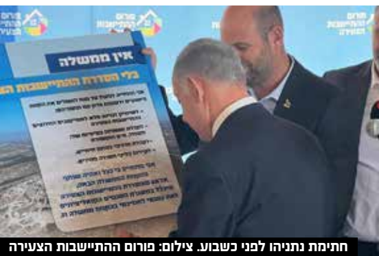
חתימת נתניהו לפני כשבוע.

כל זאת מתוך אהבה, מתוך ענווה ומתוך כבוד אחד לשני. בעזרת ה', ממשלת ישראל הקרובה תגדיל ותחזק את עולם התורה ואנחנו מאחוריהם".