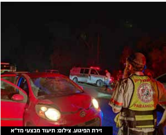
זירת הפיגוע.

אלחנן טולדנו הקטל בכבישים נמשך: תאונות דרכים קשה ביותר התרחשה אמש, כאשר הולך רגל נפגע בכל גופו מפגיעת רכב פרטי בכביש 4 בצומת אורן בסמוך ליישוב טירת הכרמל. הולך הרגל כבן 50, זהותו עדיין לא ידועה, הנהגת ברכב נפצעה באורח קל בלבד. המשטרה פתחה בבדיקת התאונה הקשה. צוותי מד"א דיווחו: "הגבר שכב על הכביש בסמוך לרכב שהיה עם פגיעות קשות בחלקו הקדמי ושמשה מנופצת. ביצענו בדיקות רפואיות אבל הוא היה ללא סימני חיים ולא נותר לנו אלא לקבוע את