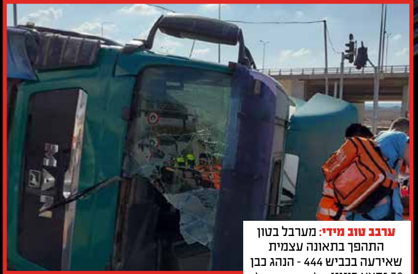
ערבב טוב מידי: מערבול בטון התהפך בתאונה עצמית שאירעה בכביש 444 - הנהג כבן 30 נפצע בינוני