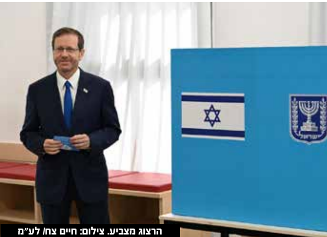
הרצוג מצביע.