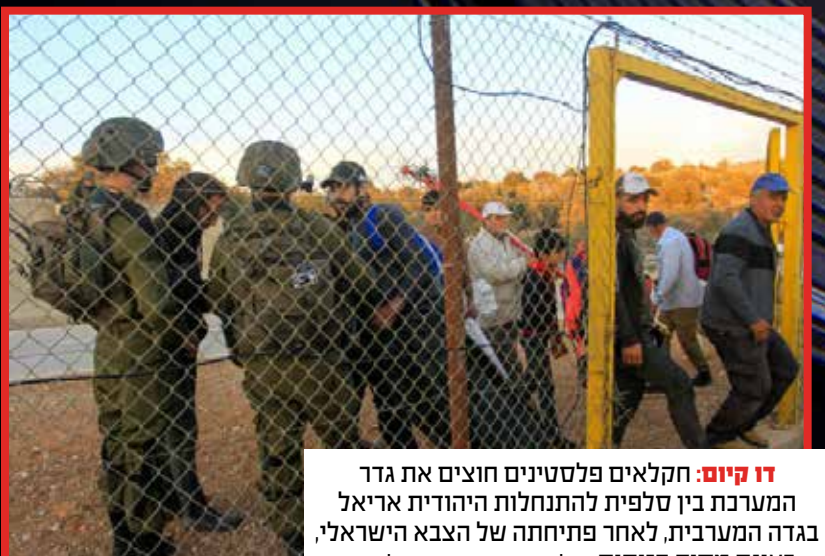
דו קיום: חקלאים פלסטינים חוצים את גדר המערכת בין סלפית להתנחלות היהודית אריאל בגדה המערבית, לאחר פתיחתה של הצבא הישראלי, בעונת מסיק הזיתים.