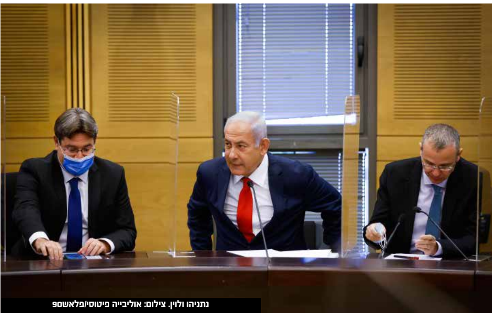
נתניהו ולוין.

לביטחון פנים יהיה איתמר בן גביר, עם רפורמות מאוד משמעותיות בסמכויות שלו. את תיק השיכון עתיד לקבל יצחק גולדקנוף. יצחק וסרלאוף, בן ה-30, מועמד להיות השר השני מטעם מפלגת עוצמה יהודית. השר השני הצעיר ביותר מקום המדינה. תיק הבריאות יינתן ככל הנראה ליואב קיש או לעידית סילמן. שמות נוספים שעלו הם דני דנון, אופיר אקוניס ודודי אמסלם. שמה של גילה גמליאל עלה גם הוא, אך היא הוזכרה גם בהקשר לתיק הגנת הסביבה - בו כיהנה בעבר. דוד אמסלם אמר כי מבחינתו הוא יישאר מחוץ לממשלה אם לא יקבל את תיק המשפטים, ואמיר אוחנה עשוי אולי גם כן להתמודד על תפקיד יו"ר הכנסת - אך ייתכן שגם הוא יתעניין במשרד החוץ.