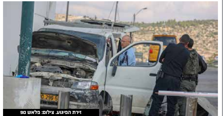
זירת הפיגוע.