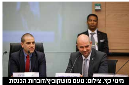
מינוי כץ.