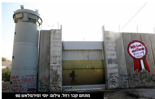
מתחם קבר רחל.

במהלך החודשים האחרונים, יידו רעולי פנים אבנים, בקבוקי תבערה ובחלק מהמקרים גם מטעני צינור. באירועים אלו כוחות הביטחון הגיבו באמצעים שונים נגד המתפרעים. לאחר שחוקרי המשטרה התחקו אחר זהותם של חלק ממפרי הסדר המרכזיים, שלשום נעצרו שני חשודים, פלסטינים תושבי מחנה הפליטים עאידה בשנות העשרים לחייהם.