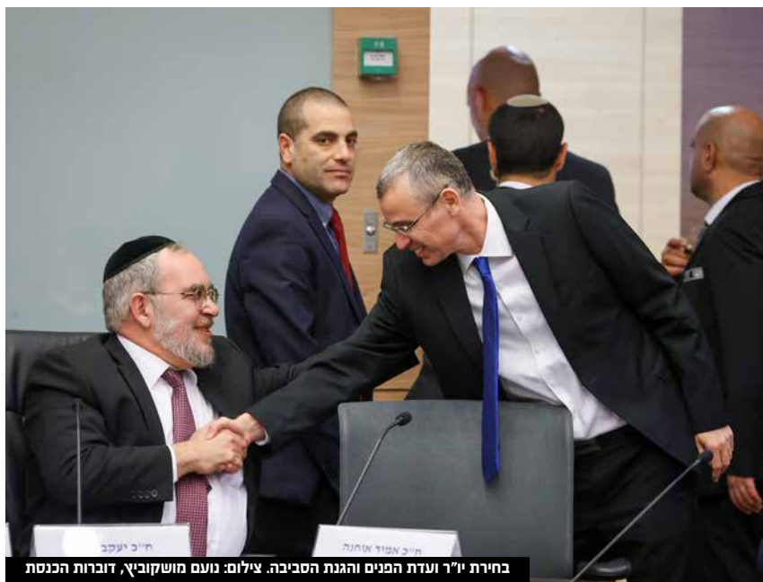
בחירת יו"ר ועדת הפנים והגנת הסביבה.

יושב ראש הכנסת, ח"כ אמיר אוחנה, בירך את ח"כ אשר: "המינוי שלך, ח"כ אשר, לעמוד בראש הוועדה הוא הראוי ביותר בגלל הניסיון האישי שלך כראש עיר לשעבר וכיו"ר לשעבר של ועדה חשובה בכנסת. האכפתיות שלך הן כלפי האזרחים והן כלפי