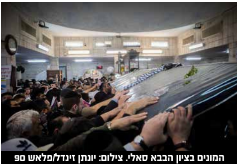
המונים בציון הבבא סאלי.