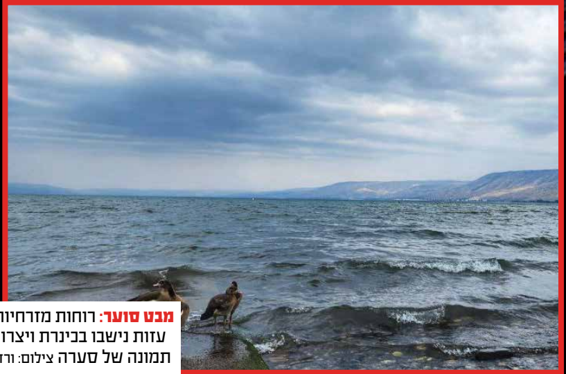
מבט סוער: רוחות מזרחיות עזות נישבו בכינרת ויצרו תמונה של סערה