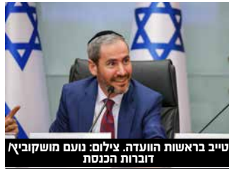
טייב בראשות הוועדה.

שרת החינוך הקודמת. מה שהיה בחינוך - לא יהיה עכשיו. זה יהיה אחרת. כגוף שנבחר ע"י הציבור, אנחנו נוביל את הספינה הזאת וזה אך טבעי שיקרה בה שינוי". שר במשרד החינוך חיים ביטון: "הולכת להיות מהפכה במערכת החינוך. יש הרבה חדלי ישע וכדי לפתור את זה צריך בולדוורים. ח"כ טייב הוא בולדור". השר לפיתוח הפריפריה, הנגב והגליל יצחק וסרלאוף: "כשעוסקים בחינוך - האחריות היא קודם כל על עצמנו, להיות אנשי מעלה. ההתנהגות שלנו היא מה שמקרין יותר מכל הסיפורים שנספר לילדינו".