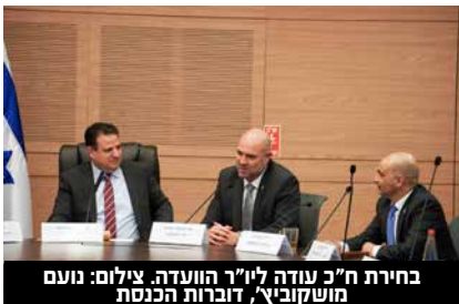
בחירת ח"כ עודה ליו"ר הוועדה.

ועדת הכנסת התכנסה לשיבתה הראשונה במהלכה נבחר פה אחד ח"כ אופיר כץ לעמוד בראש הוועדה. עם אישור ההחלטה אמר יו"ר הוועדה, ח"כ אופיר כץ: "הוועדה הזאת היא הלב הפועם של הכנסת, מקווה ומאמין לעשות את העבודה על הצד הטוב ביותר וליסייע לבקשות חברי הכנסת". יו"ר הכנסת, ח"כ אמיר אוחנה בירך את היו"ר הנכנס: "יש בוועדה הזאת הרבה תוכן וחשיבות. מברך אותך בעשייה מוצלחת ואני לרשותך לכל דבר". ח"כ משה גפני: "אתה סמל ודוגמה לחריצות בעשייה