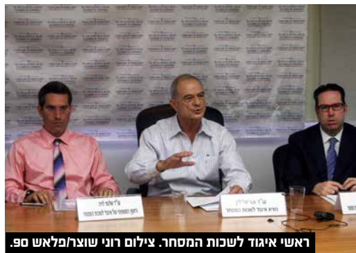
ראשי איגוד לשכות המסחר.

בתכנית מציע האיגוד שינוי משטר המיסוי על ייבוא: כיום, מיסי הייבוא כוללים את מחיר המוצר בתוספת העלויות הכרוכות בשילוחו לישראל ושחרורו משער הנמל. באופן אבסורדי, ככל שעלויות השילוח גבוהות יותר, המס שיגבה מהיבואן יהיה גדול