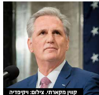
קווין מקארתי.

היו"ר שייבחר בסופו של דבר יחליף את הדמוקרטיה ננסי פלוסי, שישבה בראש בית הנבחרים מאז 2019, ומפנה את התפקיד בעקבות הניצחון הדחוק של הרפובליקנים בבחירות שנערכו אליו בנובמבר האחרון.