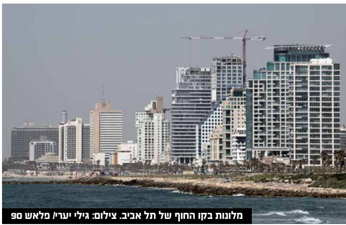
מלונות בקו החוף של תל אביב.

שכר המינימום במשק צפוי לעלות בחודש אפריל הקרוב ל-5,572 שקלים בעקבות עליית השכר הממוצע במשק. הסיבה לכך נובעת מכך שהשכר הממוצע למשרת שכיר במשק עלה בחודש אוקטובר ל-11,809 ש"ח, עלייה של 4.3% לעומת אוקטובר 2021, כך דיווחה היום הלשכה המרכזית לסטטיסטיקה, כתוצאה ממנגנון העדכון אוטומטי, שכר המינימום צפוי לעלות גם הוא. הלשכה המרכזית לסטטיסטיקה פרסמה היום כי עליית השכר הממוצע למשרת שכיר במחירים שוטפים עומדת על 4.3% לעומת אוקטובר 2021, אז עמד השכר על 11,324 ש"ח.