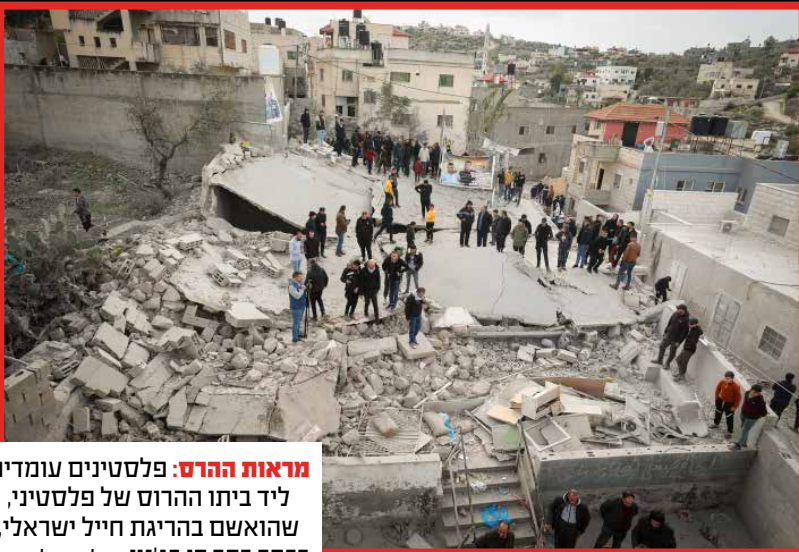
מראות הרוס: פלסטינים עומדים ליד ביתו ההרוס של פלסטיני, שהואשם בהריגת חייל ישראלי, בכפר כפר דן בג'נין.