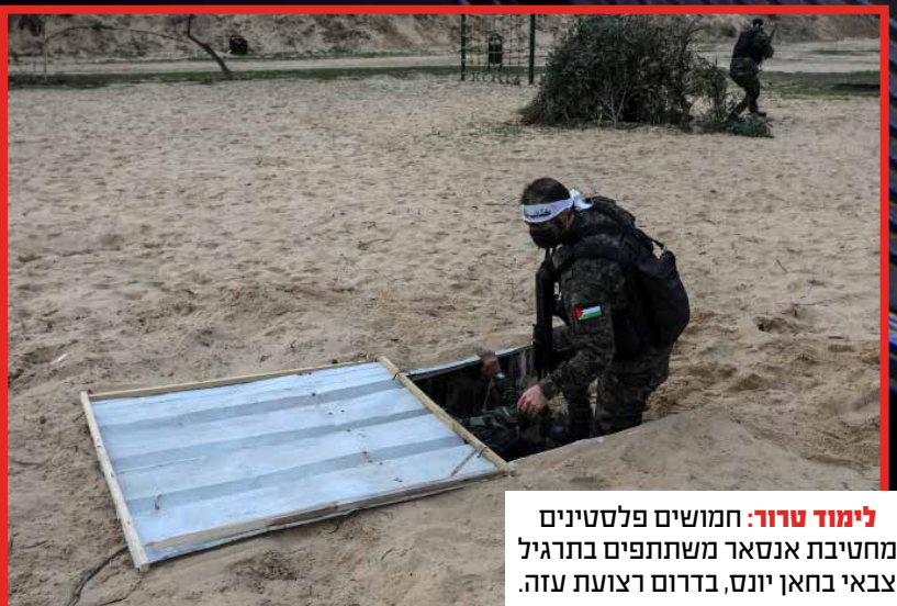
לימוד טרור: חמושים פלסטינים מחטיבת אנסאר משתתפים בתרגיל צבאי בחאן יונס, בדרום רצועת עזה.