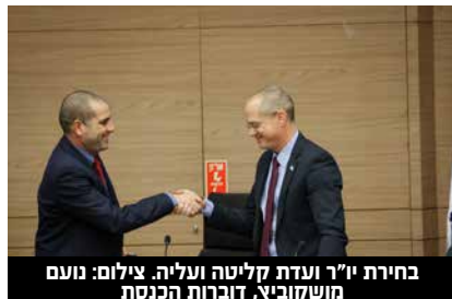
בחירת יו"ר ועדת קליטה ועליה.