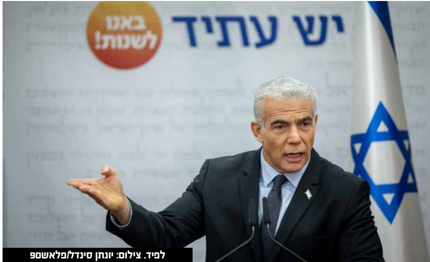
לפיד.

שר המשפטים לשעבר גדעון סער תקף: "השר לוי איזכר הערב בפתח דבריו את מנחם בגין, מנהיגו המיתולוגי והראשון של הליכוד. אך דבריו היו לא פחות מהוצאה להורג של משנתו הדמוקרטית והמשטרית של מנחם בגין. אין ספק שמנחם בגין היה דוחה כל אחד מסעיפי התוכנית לשינוי המשטר