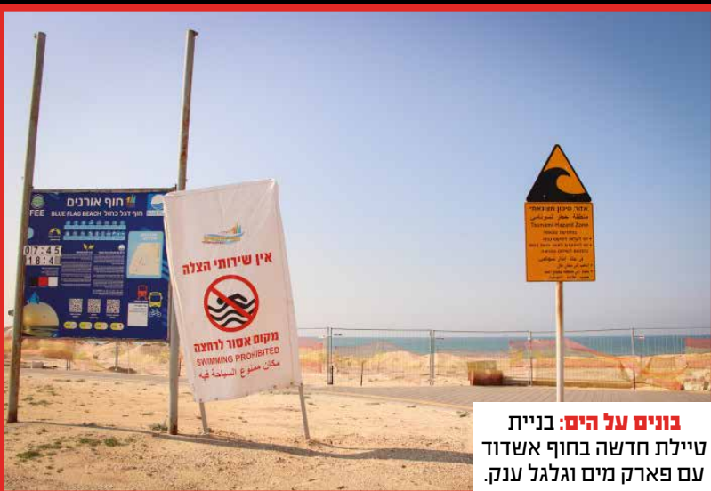
בונים על הים: בניית טיילת חדשה בחוף אשדוד עם פארק מים וגלגל ענק.