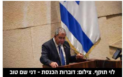
לוי תוקף.

שלי לבג"ץ יצאתי נגד הממשלה ואמרת שהחלוקה אינה על דעתך. שלח בג"ץ חזרה את האנשים לדרך בנושא עוד פעם, התקיימו אצלי בלשכה שש ישיבות בעניין הזה. בסוף זה התפוצץ על שתי המקומות בוועדת כספים ועל זה זה התפוצץ, אבל מה זה חשוב?"