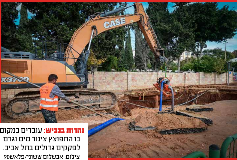
נהרות בכניש: עובדים במקום בו התפוצץ צינור מים וגרם לפקקים גדולים בתל אביב.