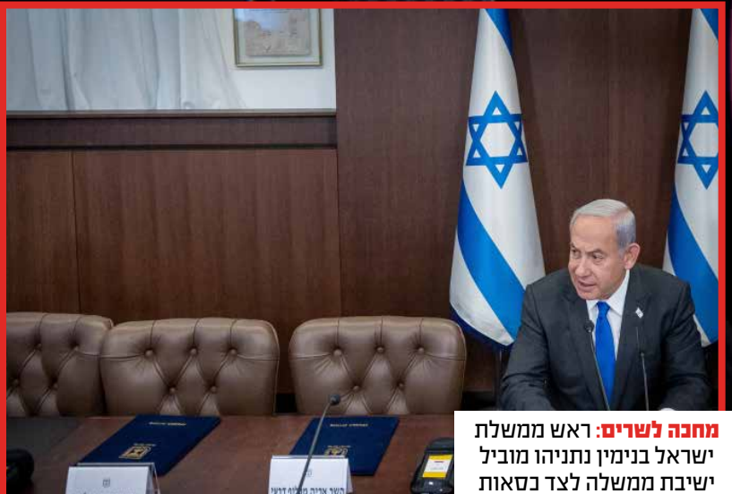
מחנה לשרים: ראש ממשלת ישראל בנימין נתניהו מוביל ישיבת ממשלה לצד כסאות ריקים.