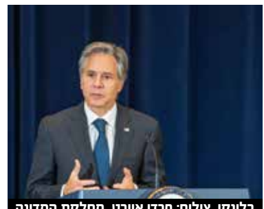
בלינקן.