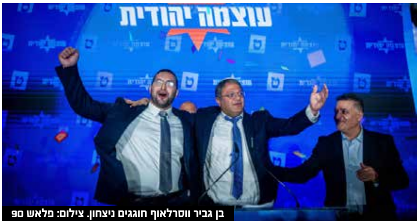
בן גביר ווסרלאוף חוגגים ניצחון.

"כל כפייה אנטי-דתית שהכריחו, כל כפייה חילונית, אני מתנגד לזה. לכן נפעל כנגד כפייה חילונית, נשמור על הסטטוס קוו", לטענתו. בוא נחזור רגע לשמאל. אתה מבין את החששות שלהם והאמירות כמו 'הלכה לנו המדינה'? "אז אני עונה להם דבר פשוט - נעסוק בסוגיית הביטחון האיש, הרי מחבל שמגיע לפגוע לא מבדיל בין שמאל לימין ובין אשכנזי לספרדי. אני מאמין.. בעצם מה זה מאמין, אני יודע שאנחנו מחויבים לכל