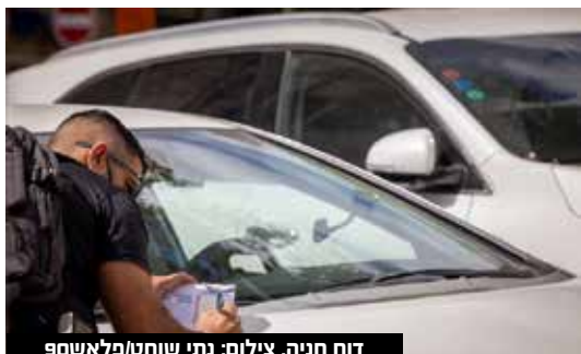
דוח חניה.

ליקוי מדאיג נוסף נוגע להתנהלות העירייה מול חברות השכרת כלי