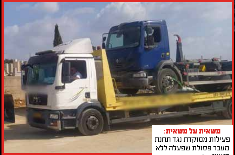
משאית על משאית: פעילות ממוקדת נגד תחנת מעבר פסולת שפעלה ללא רישיון