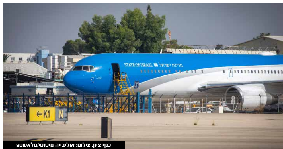
כנף ציון.