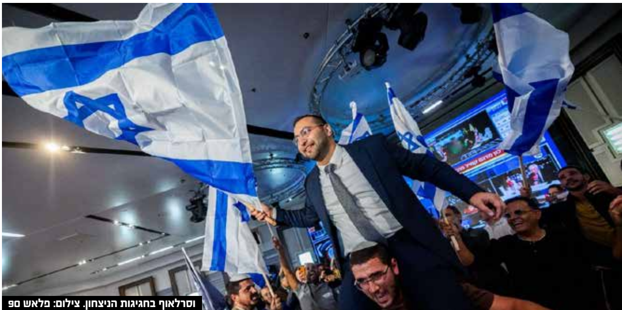
וסרלאוף בחגיגות הניצחון.

מספר 2 בעוצמה יהודית ומי שצפוי להיות שר בממשלה בראיון ל'שחרית': "לא נלך אחורה בחוק גירוש מחבלים. נתחיל מלהוציא את טיבי, עודה ומנסור עבאס מהכנסת - ובהמשך צריכים שישלחו אותם לסוריה. אין להם מה לחפש פה" • על השותפות עם המפלגות החרדיות: "האמירות של משה גפני מפריעות לי - מכיר את הדעות האישיות שלו"