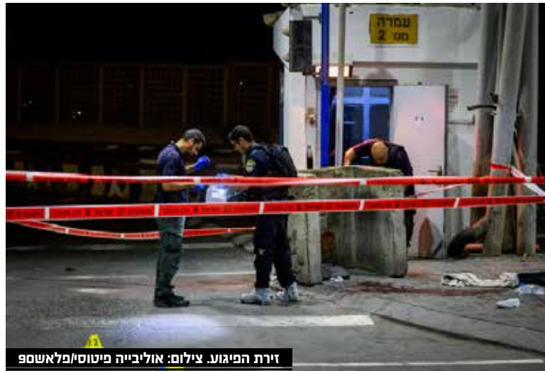
זירת הפיגוע.

בתוך כך, לאחר התחקיר התקבלה המלצה להדיח משירות נגד ממוג"ב, וגם את מפקד המחסום - זאת בשל תפקודו בפיגוע. ההמלצות צפויות להיבחן ע"י הייעוץ המשפטי למשטרה.