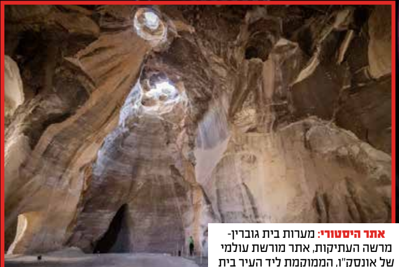
אתר היסטורי: מערות בית גוברין-מרשה העתיקות, אתר מורשת עולמי של אונסק"ו, הממוקמת ליד העיר בית שמש.