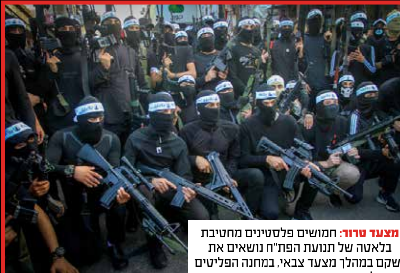
מצעד טרור: חמושים פלסטינים מחטיבת בלאטה של תנועת הפת"ח נושאים את נשקם במהלך מצעד צבאי, במחנה הפליטים בלאטה.