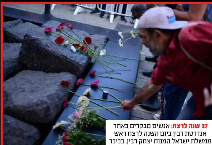
27 שנה לרצח: אנשים מבקרים באתר אנדרטת רבין ביום השנה לרצח ראש ממשלת ישראל המנוח יצחק רבין, בניכר רבין בתל אביב.