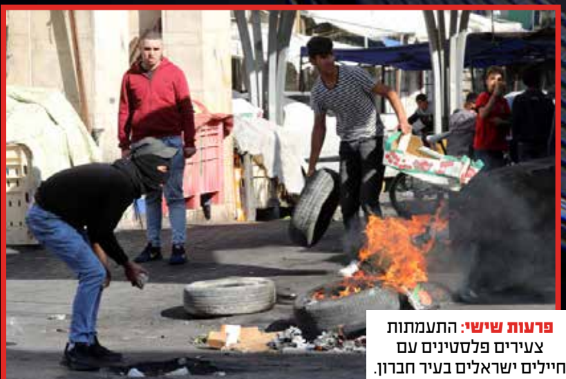
פרעות שישי: התעמתות צעירים פלסטינים עם חיילים ישראלים בעיר חברון.