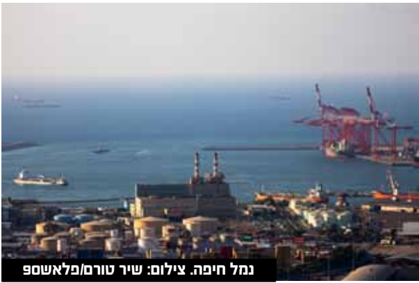
נמל חיפה.

הבעת אמון בחברה וביכולותיה הפיננסיות, ומגבה את התוכניות המקצועיות של החברה לפיתוח הנמלים לטובת המשק הלאומי כולו. המשך פיתוח נמלי הים חיוני להבטחת צמיחתה של כלכלת ישראל, ונועד להשיג את היעד האסטרטגי של הגדלת השתתפותה של ישראל בסחר הגלובלי והאזורי".