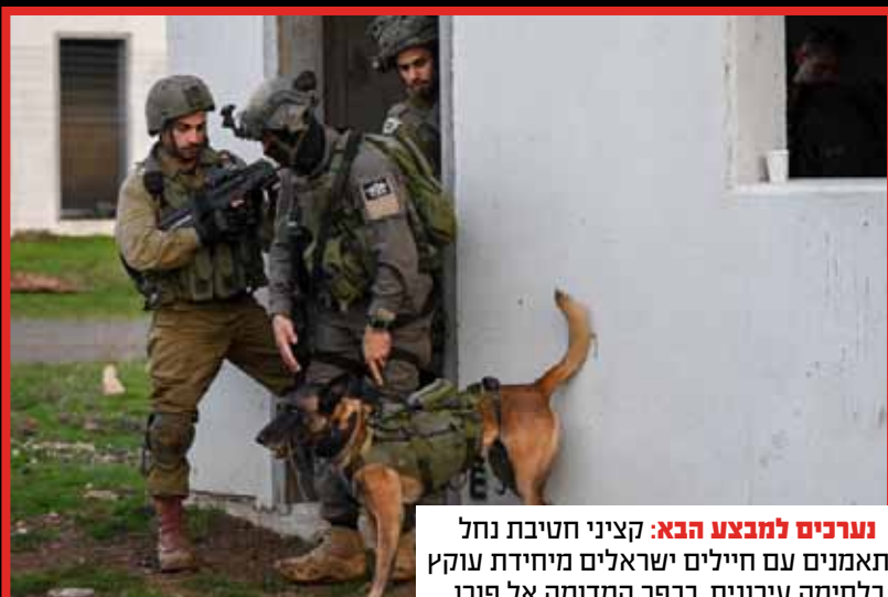
נערכים למבצע הבא: קציני חטיבת נחל מתאמנים עם חיילים ישראלים מיחידת עוקץ בלחימה עירונית, בכפר המדומה אל פורן, בצפון רמת הגולן.