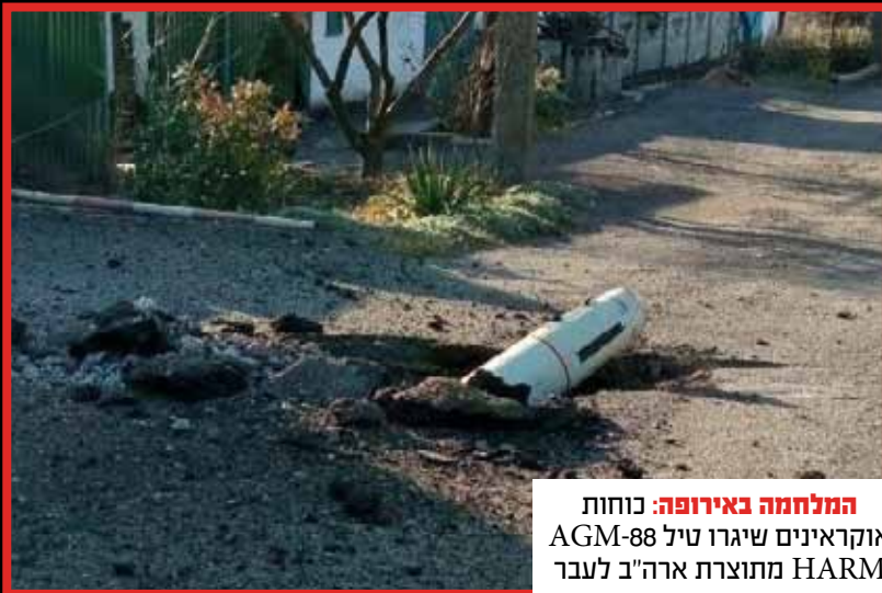
המלחמה באירופה: כוחות אוקראינים שיגרו טיל AGM-88 HARM מתוצרת ארה"ב לעבר מחוז דונייצק שתחת כיבוש רוסי.