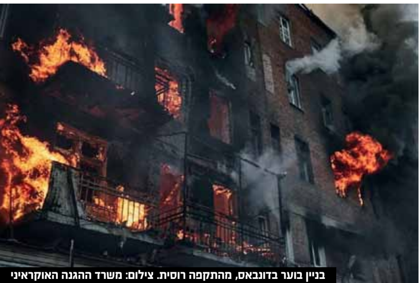
בניין בוער בדונבאס, מהתקפה רוסית.

לפי מקורות מערביים, התגובה של זלנסקי הייתה חריפה ביותר. "פוטין, יש לך שתי אפשרויות. תסתיים, או שנילחם בכך ונגרש אתכם באמצעות הרבה דם שיישפך", אמר זלנסקי. מנגד, כאמור, נראה שרוסיה מנסה לשדר מסרים מפויסים יותר. במסיבת עיתונאים שקיים דובר הקרמלין פסקוב, הוא אמר שרוסיה לא מעוניינת בכיבוש שטחים נוספים באוקראינה אלא בהחזרת הקרקעות שהיא הצליחה לכבוש בתחילת הלחימה ונסוגה ממנו בהמשך בעקבות הפגזות צבא אוקראינה.