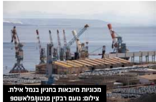
מכונות מיבואות בחניון בנמל אילת.

אשתקד, פרט למקררים. יבוא של מכונות כביסה, מייבשי כביסה ומדיחי כלים עלה ב-6.7%, 12.3% ו-28.7% בהתאמה. יבוא של מקררים, לעומת זאת, ירד ב-7.1%. מנתונים מעניינים נוספים, המתפרסמים על ידי רשות המיסים, עולה כי ערך יבוא הסיגריות עלה ב-16.8% בנובמבר 2022 לעומת התקופה המקבילה אשתקד. זאת בהמשך לעליה בספטמבר - אוקטובר 2022 ולאחר ירידה מתחילת השנה. סך ערך כלל היבוא בחודש נובמבר 2022 הסתכם ב-7.8 מיליארד $, ירידה של 3.4% לעומת ערך היבוא בנובמבר 2021. נתוני מגמה מצביעים על ירידה מתונה בערך יבוא, לאחר עליה ממושכת החל מיוני 2020. מנתוני אוקטובר 2022 עולה כי נרשמה ירידה בכמויות השיוק של בנזין וסולר בשיעורים של 6.8%-1.2.5% בהתאמה. הירידה מוסברת ע"י מיעוט ימי עבודה באוקטובר 2022 בשל החגים. בספטמבר - אוקטובר 2022 מדובר בעליה של 2.6%-1.3.6% בהתאמה לעומת ספטמבר - אוקטובר 2021.