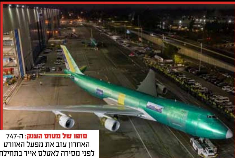
סופו של מטוס הענק: ה-747 האחרון עזב את מפעל האוורט לפני מסירה לאטלס אייר בתחילת 2023.