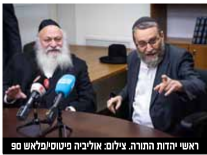
ראשי יהדות התורה.

את ההצעה לחוק יסוד לימוד התורה הגה לראשונה עורך הדין יעקב ויינרוט ז"ל, כאשר ביהדות התורה והליכוד 'שלפו' אותו מחדש. ההתקדמות השנייה היא בסוגיית התקציבים, כאשר יהדות התורה דרשה בין 4 ל-5 מיליארד שקלים במטרה להשוות