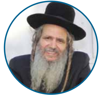
הגה"צ הרב שלום ארוש שליט"א

הכי טוב זה כששמחים. תפילה בשמחה מתקבלת הכי הכי יפה! תחשוב עכשיו, נגיד הבן שלך, אם הוא בא ובוכה, ואפילו מעורר לך את הרחמים, בסדר. אבל אם הוא בא שמח - "אבא היקר! איזה חיים יפים! איזה אבא טוב אתה!", שמח! מה שיבקש אתה תתן לו