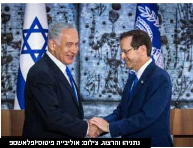
נתניהו והרצוג.

"בשלב זה נחתמו עם כל הסיעות שהמליצו עלי לתפקיד ראש הממשלה (64 ח"כים), נספחים או מכתבים הנוגעים לתפקידים בממשלה ה-37. מסמכים אלה הונחו על שולחן הכנסת בהתאם לקבוע בחוק. עם