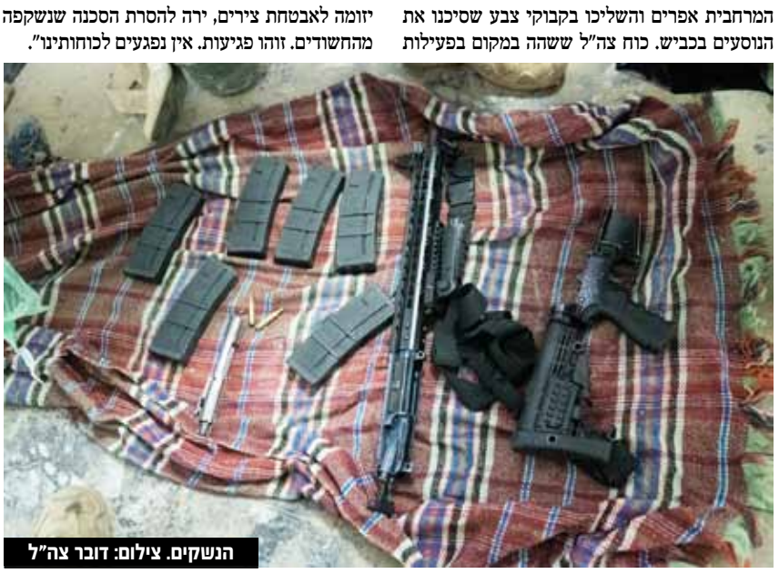
הנשקים.