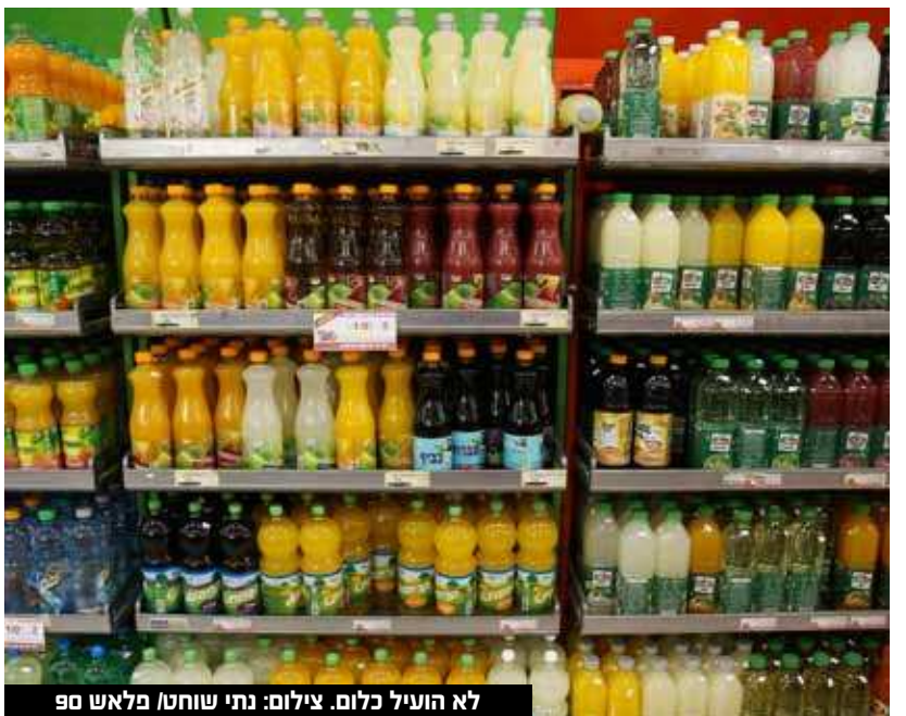
לא הועיל כלום.

מהתאחדות התעשיינים נמסר: "אנחנו מברכים את בנק ישראל על קביעתו כי מס המשקאות לא הביא לתוצאה המצופה. לראיה, הדו"ח מראה באופן ברור כי המשקאות הממוסים ירדו ב-5% בלבד לעומת ירידה כפולה של 9% במשקאות שלא מוסו כלל. יש לציין שמגמת הירידה בצריכת המשקאות הממוסים החלה עוד לפני החלת המס, ולכן השפעת המס לא הוכחה".