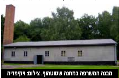
מבנה המשרפה במחנה שטוטהוף.

מתים בגו במחנה. למרות זאת, בשבוע שעבר קראו עורכי הדין של הנאצית לזכות אותה, ואמרו כי ראיות לא הוכיחו