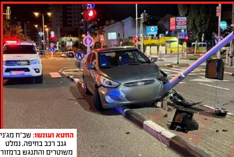
החטא ועונשו: שב"ח מג'נין גנב רכב בחיפה, נמלט משוטרים והתנגש ברמזור.