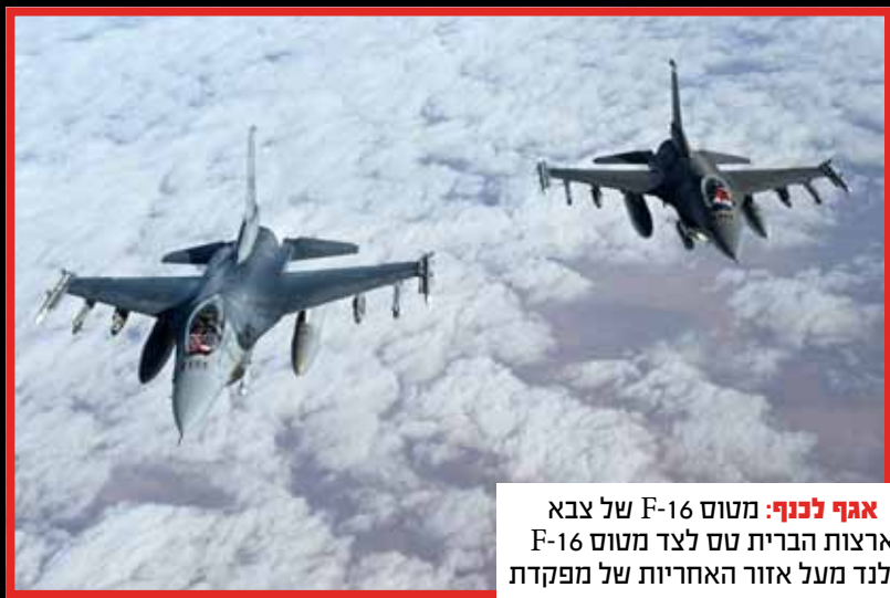
אגף לכנף: מטוס F-16 של צבא ארצות הברית טס לצד מטוס F-16 הולנדי מעל אזור האחזקה של מפקדת הסנטקום.