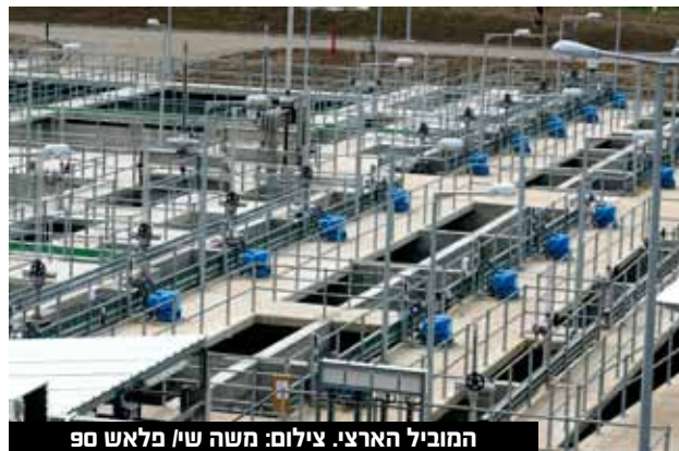
המוביל הארצי.

מועצת רשות המים אישרה את העלאת תעריפי המים לצריכה ביתית בכ-3.5% החל מינואר 2023. ברשות המים מסבירים כי עליית התעריפים נדרשה לאור ההתייקרויות האחרונות בסל המדדים (כ-2% מאז עדכון תעריף המים האחרון בחודש יולי 2022) ובשל העלייה החדה בתעריף החשמל, לצד הגידול בהשקעות במשק המים בישראל. ההחלטה התקבלה במועצת רשות המים בתום הליך שימוע שקיימה המועצה במהלך החודש האחרון, בו הוצגו עמדות הגורמים השונים. על אף עלייה מתונה זו, ברשות מדגישים כי "תעריף המים בישראל וחשבונו המים למשק בית הם מהנמוכים בעולם". הגידול בעלויות משק המים נובע מהשקעות של תאגידי המים והביוב, עדכון עלויות מט"ש, ותשלומים נוספים הנדרשים כחלק מהמשך הערכות לקליטת מי הים המותפלים, השומרים