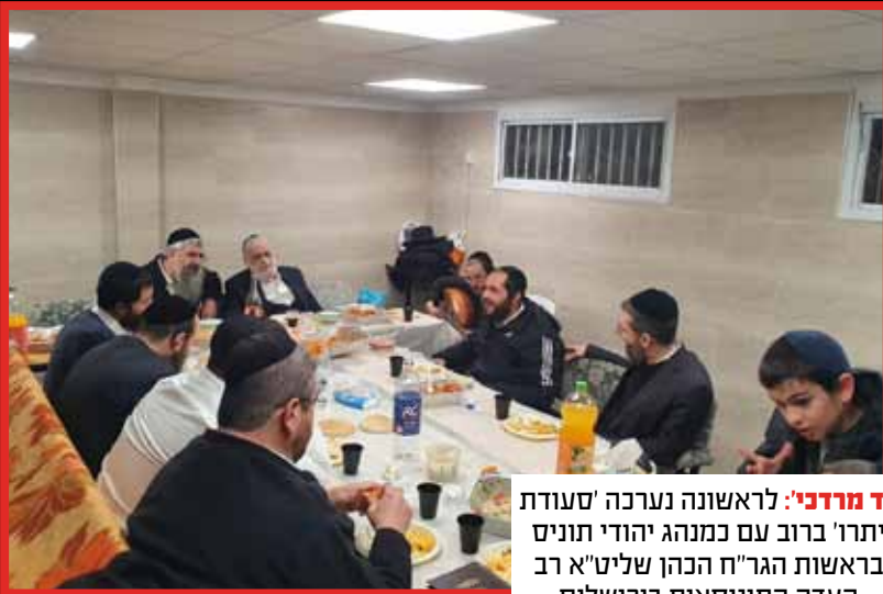
יד מרדכי: לראשונה נערכה 'סעודת יתרו' ברוב עם כמנהג יהודי תוניס ברשות הגר"ח הכהן שליט"א רב העדה התוניסאית בירושלים