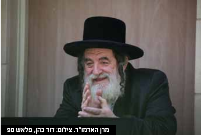
מרן האדמו"ר.