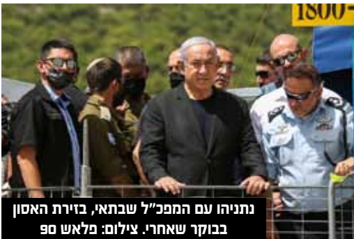
נתניהו עם המפכ"ל שבתאי, בזירת האסון בבוקר שאחרי.

את אסון מירון, והוא הצביע על אחריות לאירוע על יו"ר ש"ס אריה דרעי. לפי הדוח שנכתב בידי מהנדסים, לדרעי, שכיהן כשר הפנים בעת האסון, הייתה אחריות בשני היבטים - הראשון הוא העובדה שהיה אחראי על מינהל התכנון ב-2018 וסרב לחתום על תכנית להסדרת ההר. השני הוא קריאתו הפומבית, יחד עם פנייתו לשר לביטחון פנים דאז, אמיר אוחנה, לקיים את ההילולה במתווה של הר פתוח.