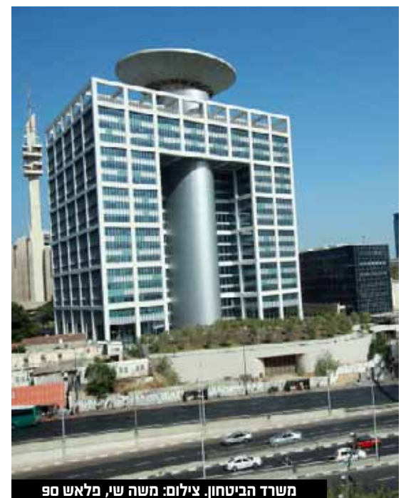
משרד הביטחון.

במהלך המבצע הבוקר, נתפסו חשבוניות בנק, נדל"ן ועוד והמשטרה תבקש את חילוטם במסגרת הליך הפלילי נגד החשודים. כאמור נעצרו