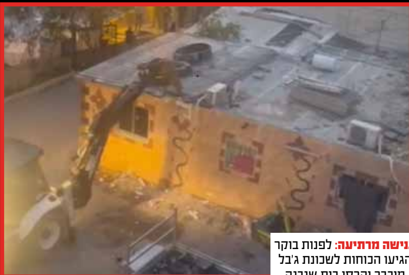
ענישה מרתיעה: לפנות בוקר הגיעו הכוחות לשכונת ג'בל מוכבר והרסו בית שנבנה שלא כחוק וללא היתרים