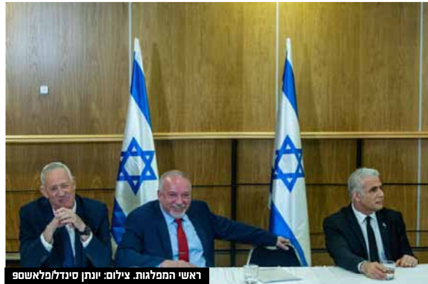
ראשי המפלגות.

יו"ר מפלגת העבודה, ח"כ מרב מיכאלי: "בימים הקרובים, חברי היקרים לאופוזיציה, יופעלו עלינו לחצים מאוד גדולים מכל הצדדים תחת השם 'הידברות'; לצערי הרב המילה הידברות היא מלכודת". יו"ר ישראל ביתנו אביגדור ליברמן יצא במתקפה חריפה: "כולנו מאוחדים בהתנגדות למהלך אבסורדי של פגיעה אנושה בחוסן הלאומי. יש מהלך שכולל בתוכו שלושה מרכיבים: חוקים שנועדו להציל באופן אישי את דרעי ונתניהו - שני האישים הבכירים האלה נמצאים בסכנה והחקיקה נועדה לחלץ אותם מהתסבוכת האישית שלהם. השני זאת פגיעה קשה בבית המשפט העליון כשמטרתו של נתניהו להפוך את בית המשפט העליון לבית הדין של הליכוד והשלישי זה המאבק בין התנועה הציונית למסדר החרדי המשיחי, התכנים שמסתתרים מאחורי כל הוויכוח