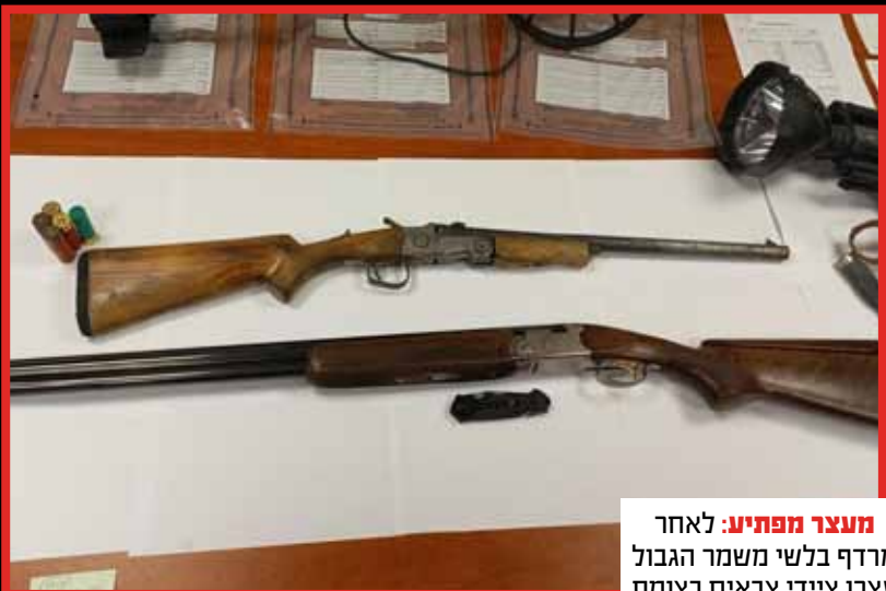
מעצר מפתיע: לאחר מרדף בלשי משמר הגבול עצרו ציידים צבאים בצומת חוסן.