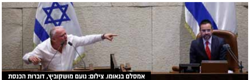
אמסלם בנאומו.

"שמעתי את אהרן ברק, כשנשאל מדוע לא היו עוד שופטי עליון מהעדה המזרחית, ענה כי 'חיפשתי ולא מצאתי'. זה קשה? למה רק החבר'ה שלך גאונים.. רק אתה גאון. איך אתה אומר? 'זה פוטר וזה יוכרע בטנקים', אז אני טנקיסט ורק לא יודע לאיזה כיוון לנסוע מר ברק. אין לי מושג, תן הנחייה לאן נוסעים, לכיוון הכנסת? אתה ראש המסיתים ולא יודע איך אתה עדיין לא עצור", תקף