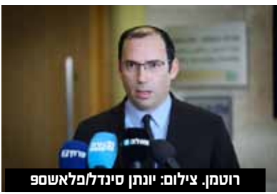
רוטמן.