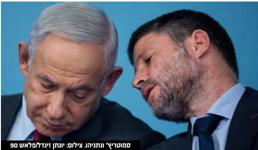
סמוטריץ' ונתניהו.

סמוטריץ' הציג כמה מהנוקודות העיקריות בחוק, כמו חוק תשתיות לאומיות שיאפשר לנו להאיץ את הביצוע של פרויקטי התשתית ולקצר בחצי את זמן ההקמה שלהם, תכנית דיור רחבה ובראשה הגדלת היצע הדיור בין היתר באמצעות תמרוץ השלטון