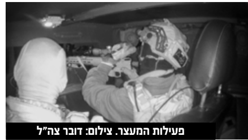
פעילות המעצר.

החשודים הלילה, בוצעו חילופי אש בין כוחותינו למבוקשים וכתוצאה מכך נפצעו שני המבוקשים, שמיד לאחר מכן נתפסו על ידי הכוחות. בסריקות במבנה הוחרמו שני כלי נשק מסוג M-16, שעל פי החשד שימשו את המחבלים. החשודים הועברו לחקירת שב"כ, אינן נפגעים לכוחותינו. "כוחות הביטחון ימשיכו לפעול למניעת וסיכול הטרור ולמעצר מבוקשים החשודים במעורבות וסיוע בפעילויות טרור", נמסר בהודעת כוחות הביטחון.