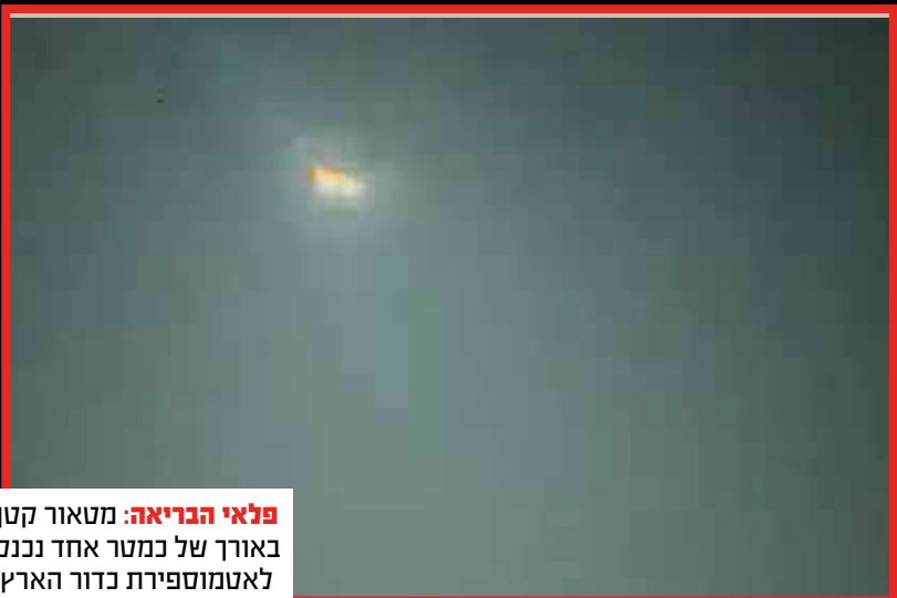
פלאי הבריאה: מטאור קטן באורך של כמטר אחד נכנס לאטמוספירת כדור הארץ מעל צפון צרפת