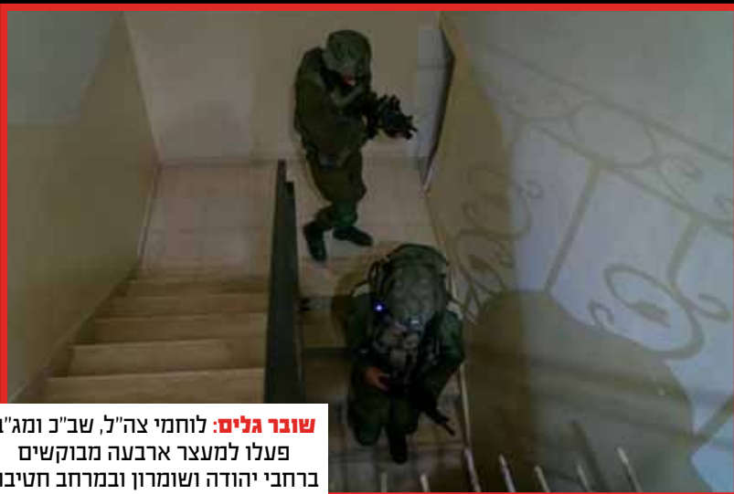
שובר גלים: לוחמי צה"ל, שב"כ ומג"ב פעלו למעצר ארבעה מבוקשים ברחבי יהודה ושומרון ובמרחב חטיבת הבקעה והעמקים.