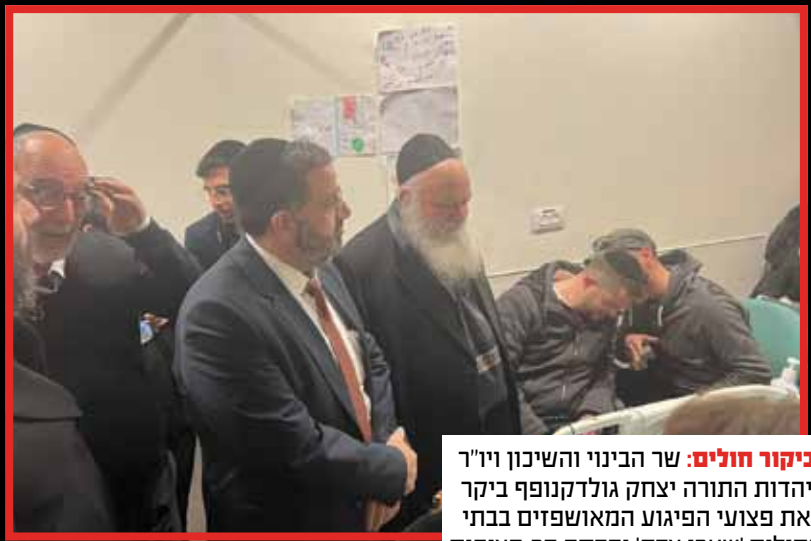
ביקור חולים: שר הבינוי והשיכון ויו"ד יהדות התורה יצחק גולדקנופף ביקר את פצועי הפיגוע המאושפזים בבתי החולים 'שערי צדק' והדסה הר-הצופים