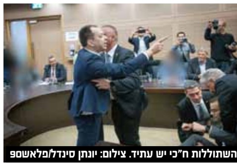
השתוללות ח"כ ישי עתיד.

יו"ר ועדת החוקה ח"כ שמחה רוטמן הגיב: "קראתי ועודני קורא גם לחברי האופוזיציה