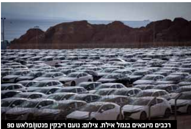
רכבים מיובאים בנמל אילת.

השרה רגב אמרה כי מדובר בצעד נוסף להגברת התחרות בשוק הרכב, הנשלט כיום בידי מספר יבואנים גדולים. השרה ציינה כי "רכישת רכב היא ההוצאה השנייה בגובהה למשק הבית הישראלי. בכוונתנו לעודד תחרות בשוק יבוא הרכב, וכך להביא להורדת מחיר הרכישה ולהקלה על סל ההוצאות של המשפחה הישראלית".