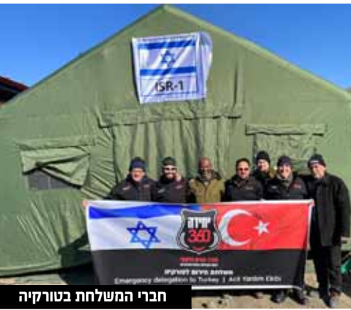
חברי המשלחת בטורקיה

הודו לנו מקרב לב". "במהלך הימים האחרונים, לפני שרוב המשלחות עזבו את טורקיה, חברי המשלחת עבדו כתף אל כתף לצד משלחות רבות מרחבי העולם בהם חברי משלחת סינית שהביעו את התפעלותם מהמקצועיות והידע של הישראלים. המיומנות של הכוחות שלנו הרשימה אותם, והם אמרו כי עוצמתה