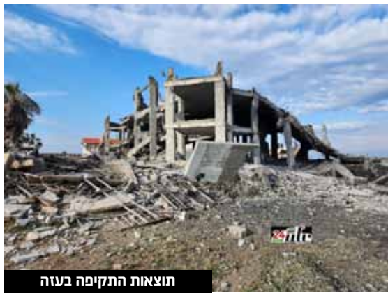
תוצאות התקיפה בעזה

צה"ל נמסר כי זוהו ארבעה שיגורי רקטות מהרצועה לשטח ישראל, שמתוכם שלוש התפוצצו באוויר ואחת נפלה בשטח פתוח. בתגובה לירי הנוסף מרצועת עזה, טנקים של צה"ל תקפו עמדות צבאיות של ארגון הטרור חמאס בגבול רצועת עזה.